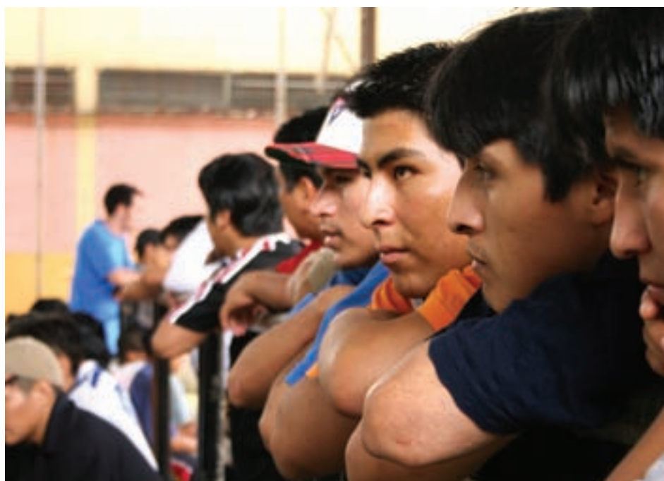
Campeonato de futebol na Escola João Kopke - capital