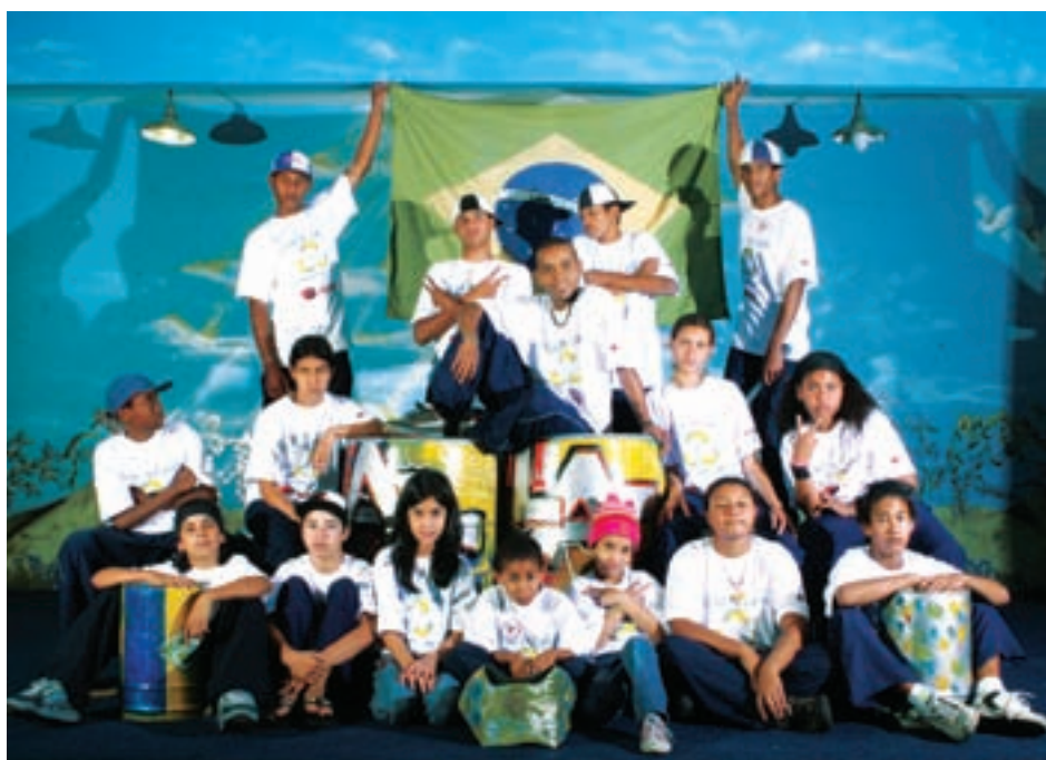
Grupo Arte na Lata, criado na periferia de Osasco - Grande São Paulo