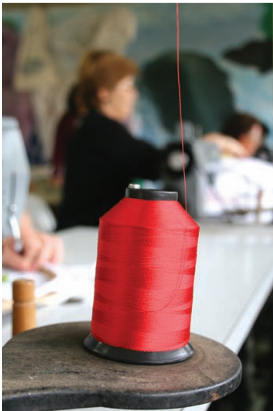
Oficina de bordado industrial da Escola Maria Assunama - Registro (SP)