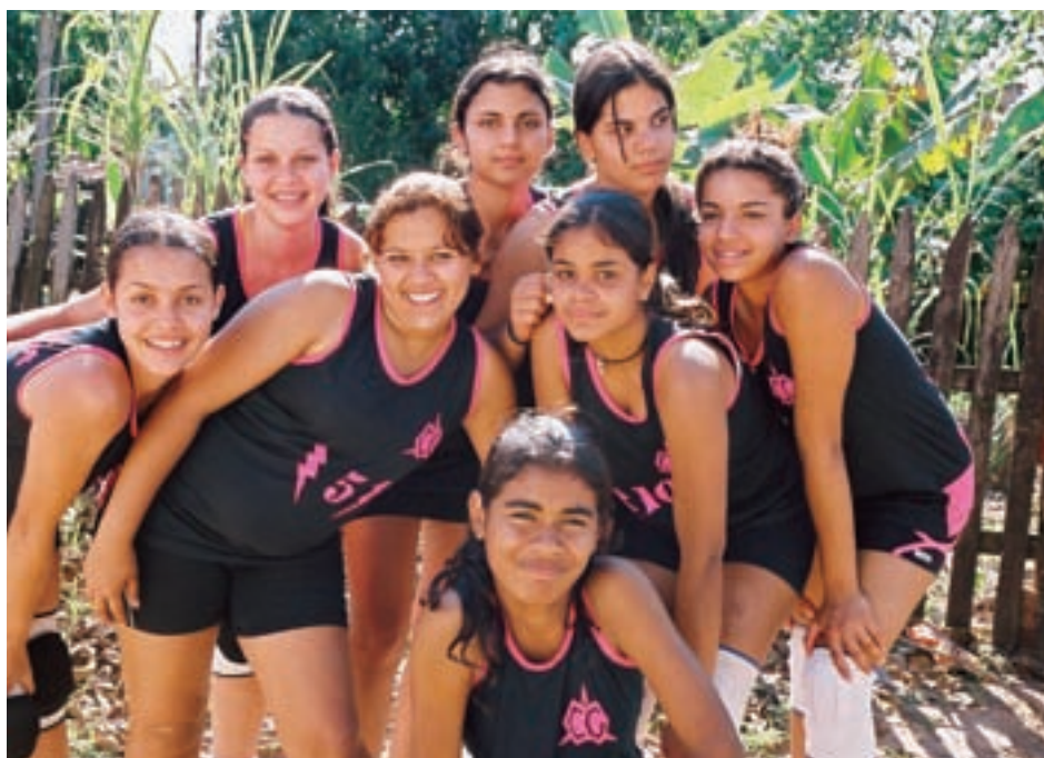
Equipe de vôlei da Escola Vereador José Diniz - Coronel Goulart (SP)