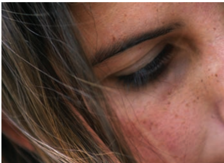
Minha mãe não quer essa vida pra mim, menina infratora de Registro (SP)