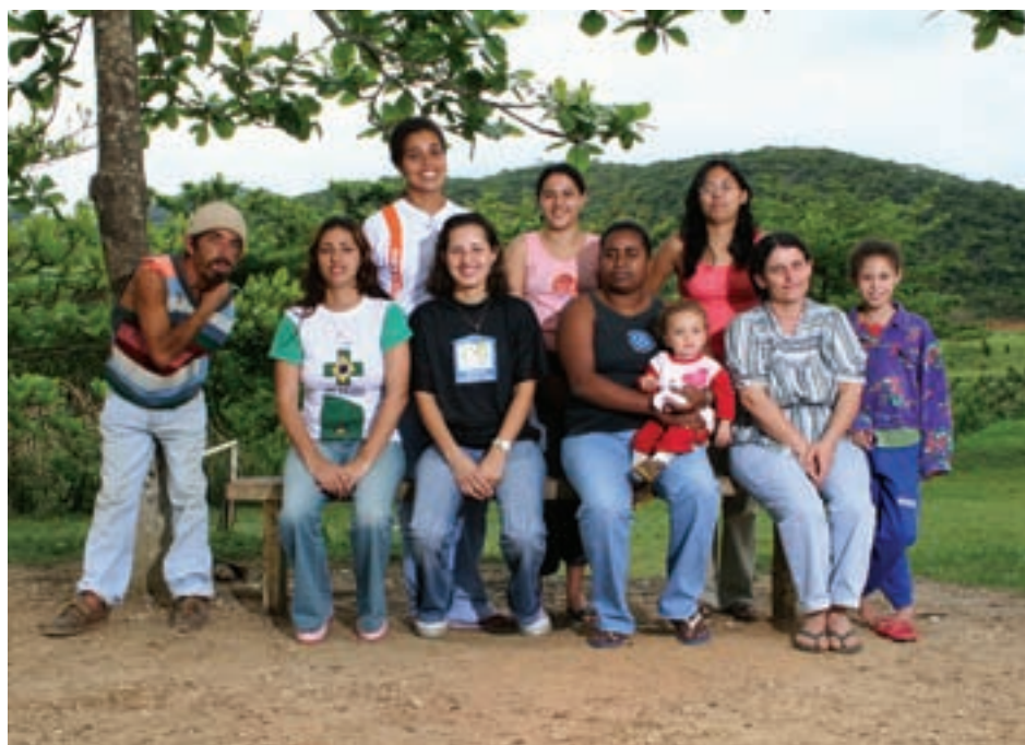
Dito e as participantes da oficina de fibra de bananeira - Boa Esperança (SP)