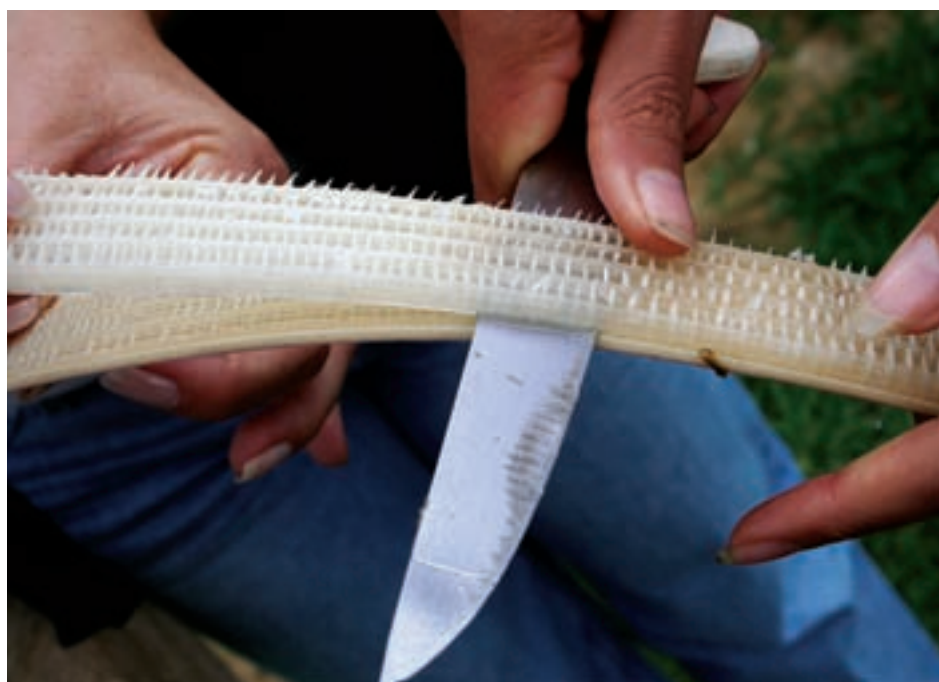
Em Boa Esperança (SP), mulheres cortam fibra de bananeira durante oficina de artesanato