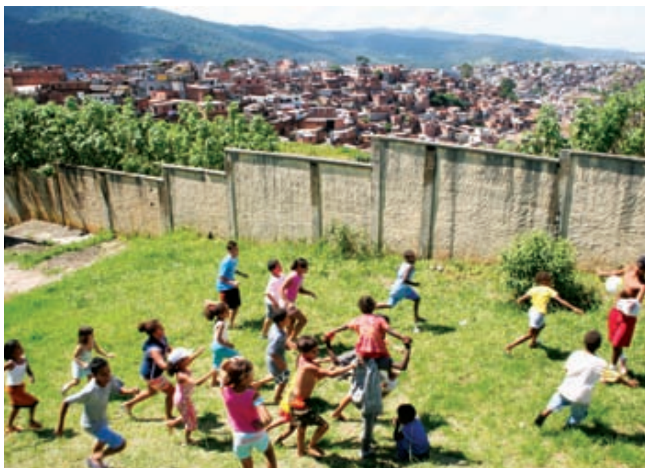
Crianças batem bola na Escola Professor Crispim de Oliveira, na Brasilândia - capital