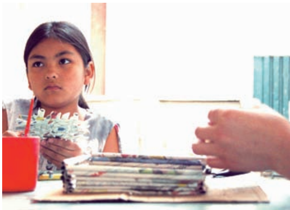
Menina boliviana participa de oficina de artesanato na Escola João Kopke - capital