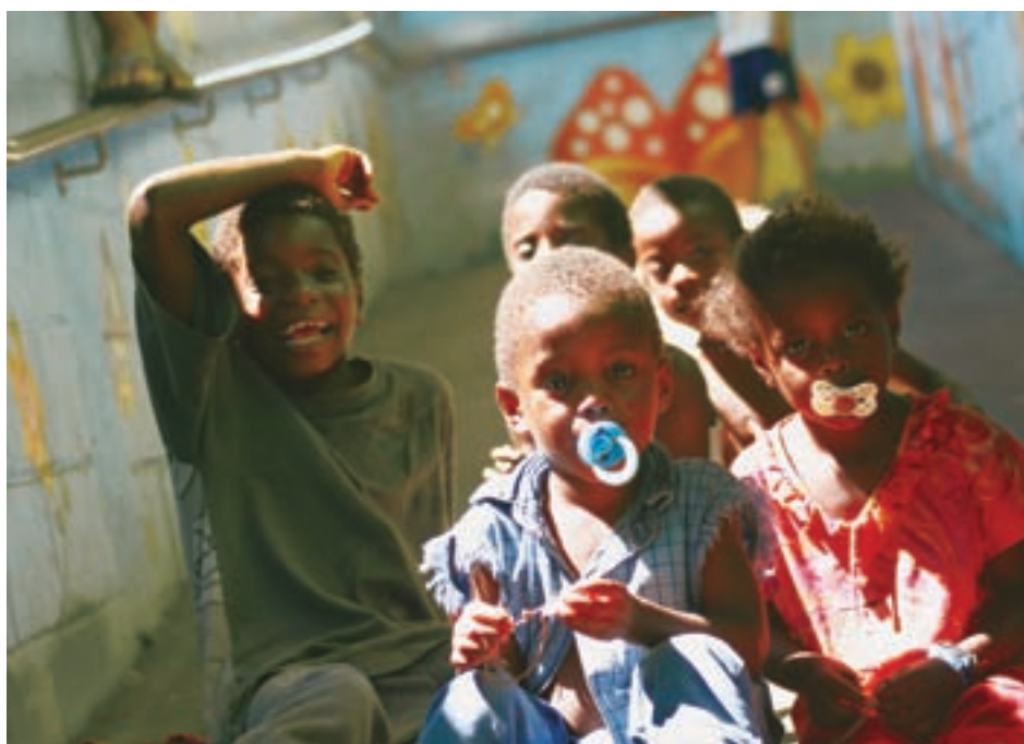
Irmãos que freqüentam, aos domingos, a Escola Crispim de Oliveira, na Brasilândia - capital