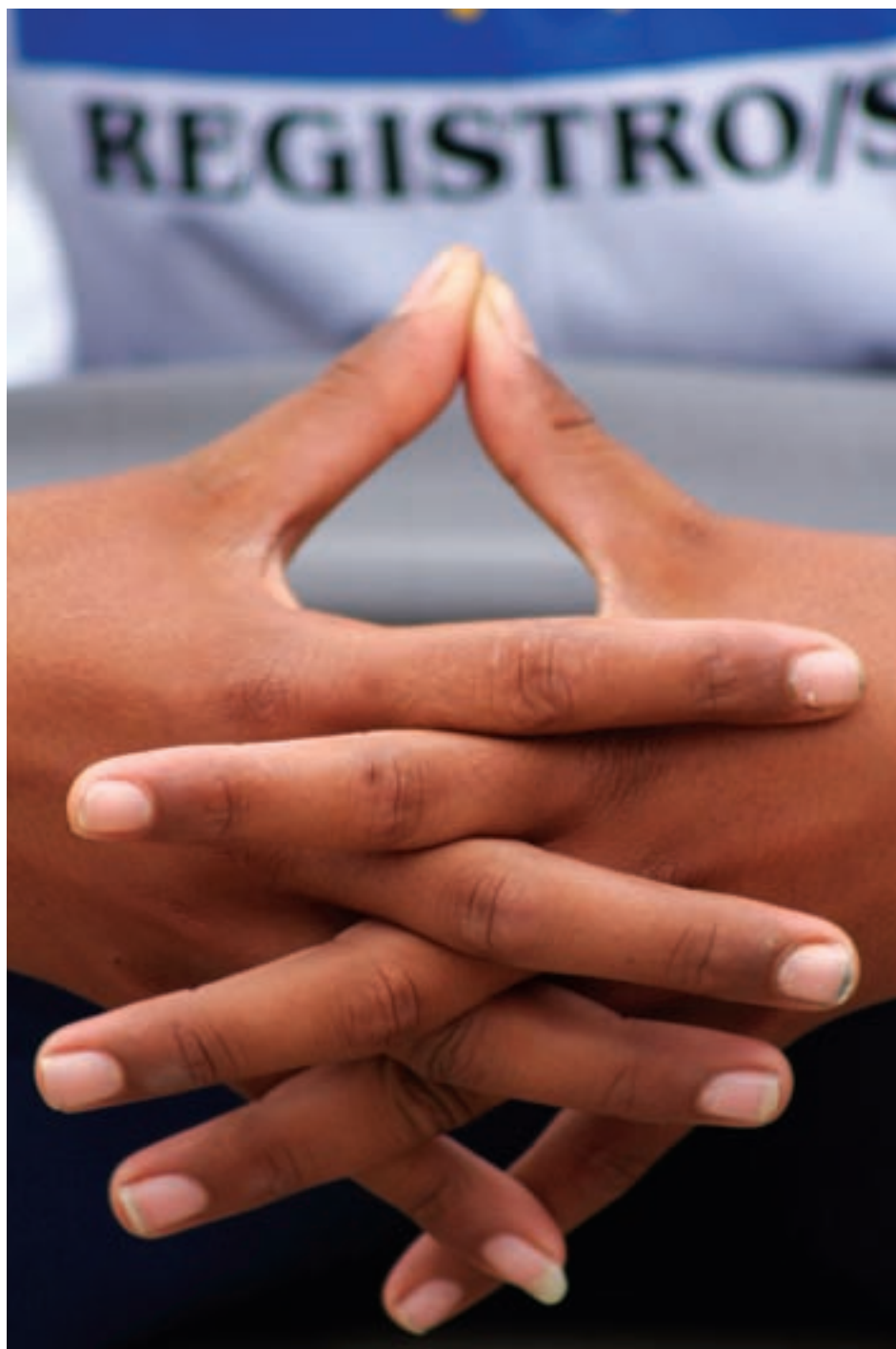
Estou melhor. Parei de roubar e só fumo cigarro, garoto de Registro - (SP)