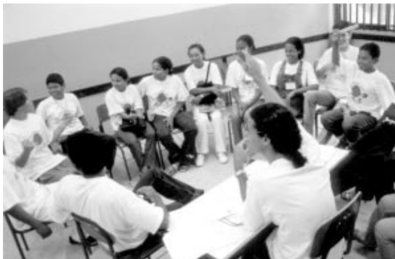
Expressão de sonhos.