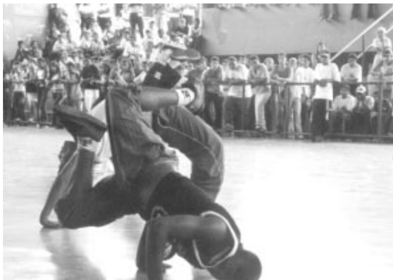
Apresentação de dança de rua (B-Boys).

Quem valoriza sua cultura tem condições de desenvolver seu futuro em bases mais sustentáveis e com mais soberania.