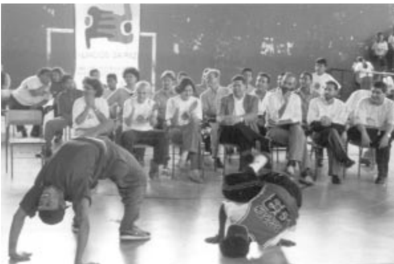
Apresentação de dança de rua.

Cada povo tem seu conhecimento, sua forma de pensar, seu conjunto de valores, suas tradições, que devem ser internamente fortalecidos, mas respeitando e compreendendo a cultura dos outros.