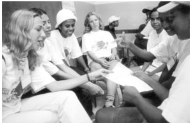
Jovens em reunião.

A vida sexual da juventude está iniciando cada vez mais cedo, incluindo até casos de crianças de 10 anos. Está cada vez mais freqüente a gravidez aos 12 ou 13 anos, fato agravado pela falta de condições financeiras, pela baixa capacidade de se criar um filho. Daí muitos casos de aborto, de abandono ou criação do filho em condições precárias e desumanas. Isto ocorre basicamente por falta de formação e informação. O fato de os jovens estarem começando cada vez mais cedo sua vida sexual deve-se também à sua criação, ao tipo de educação que cada família oferece aos filhos.