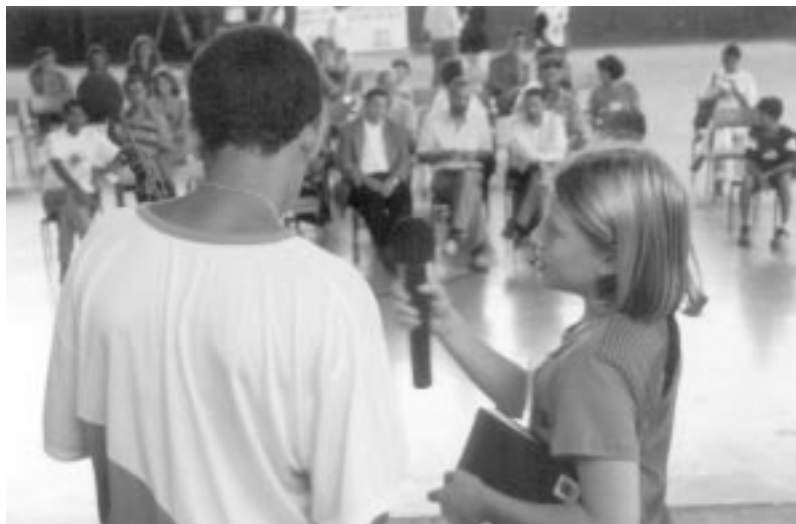
Apresentação no Colégio Médice.

As atividades da plenária foram coadjuvadas pela Equipe do Escritório da UNESCO-MT, pelo grupo mediador e pela equipe do Escritório da UNESCO-Brasil.