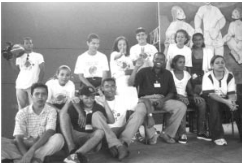
Grupo de jovens

2000, já se evidenciavam a autonomia, a elaboração de agenda de trabalho, as estratégias de mobilização e divulgação e, até mesmo, mecanismo logístico de apoio ao Programa Espaço Aberto.