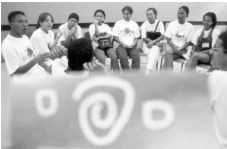
Oficina de trabalho

Passos e Veredas: fazendo caminhos é uma metodologia que busca contrariar as verdades preestabelecidas ou modelos pré-definidos, mas, sobretudo, exercitar a criação de alternativas.