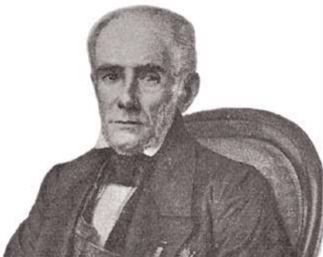
Marquês de Olinda