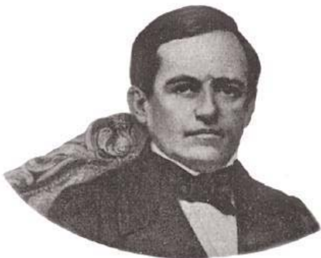
Barão de Muritiba