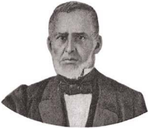
Visconde de Abaeté