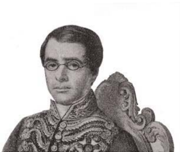
Visconde de Itaboraí