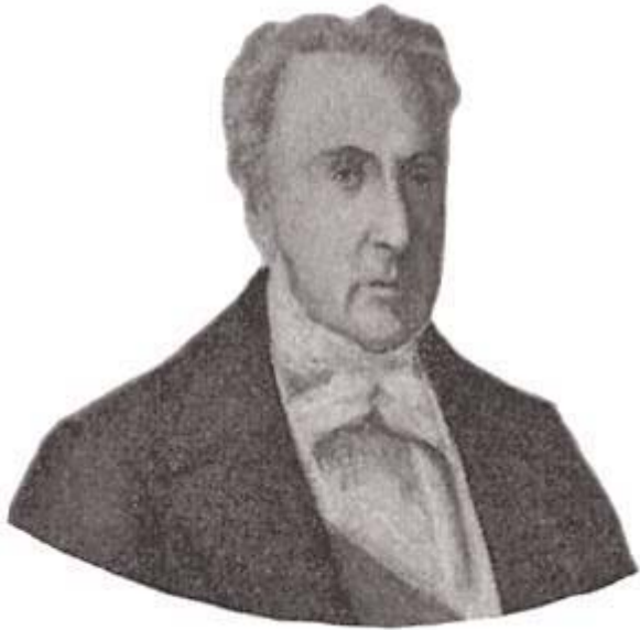
Marquês de Paranaguá