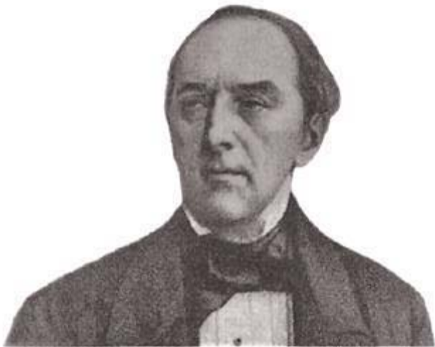
Visconde do Uruguai