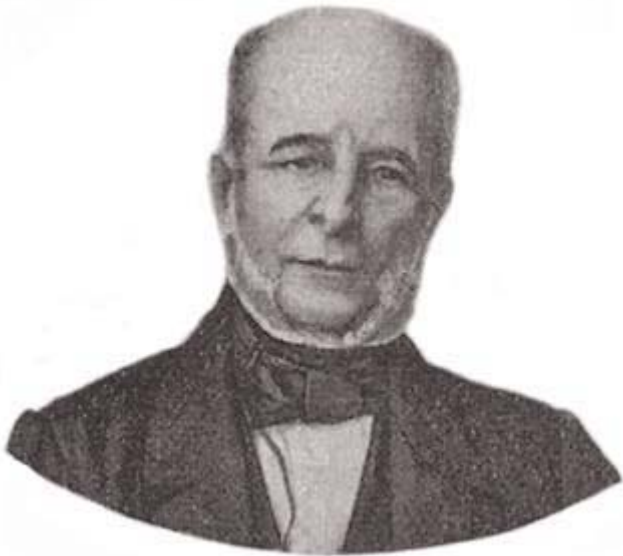
Marquês de Monte Alegre