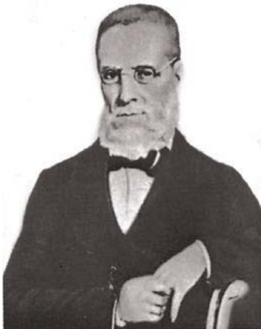
Marqués de Sapucaí