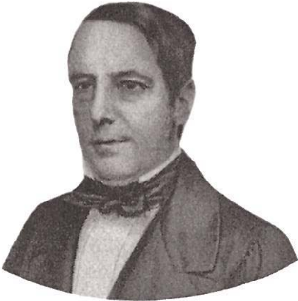
Nabuco de Araújo