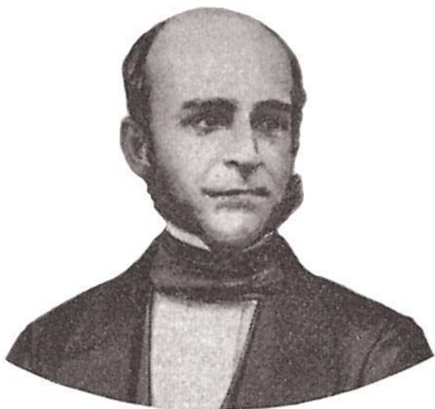
Visconde do Rio Branco