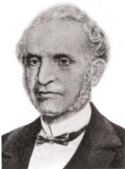
Barão de Cotegipe