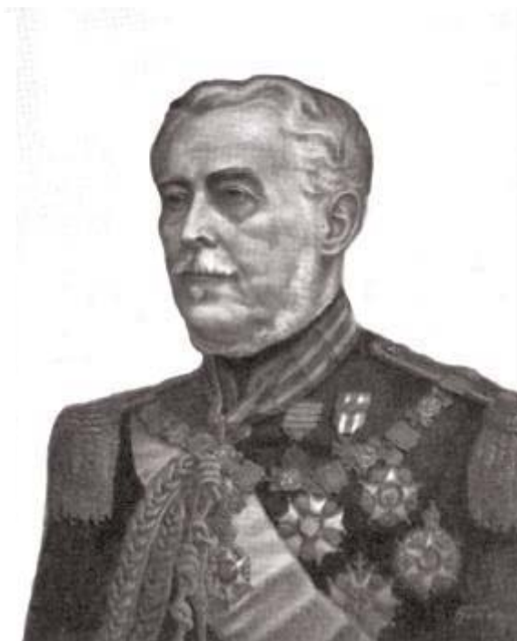
Duque de Caxias