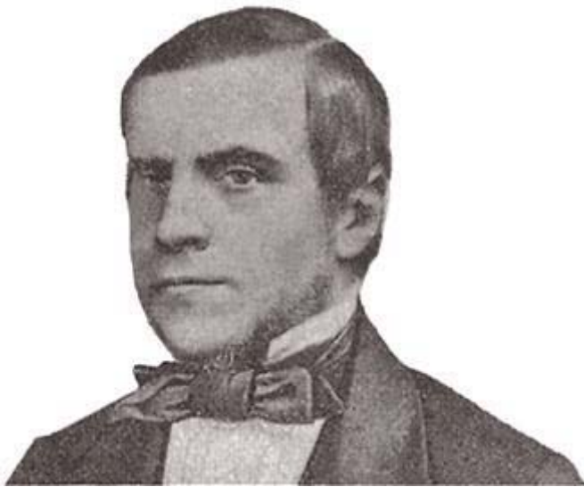
Marquês do Paraná