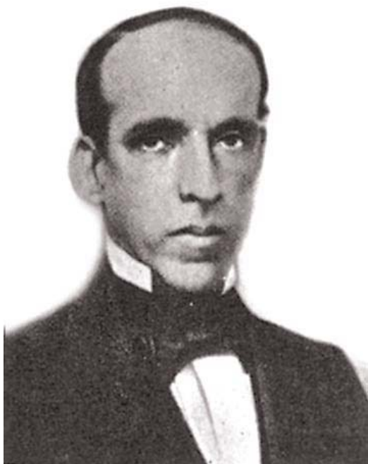
Zacarias de Góis e Vasconcelos