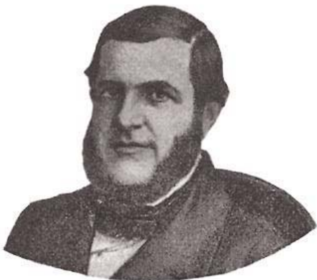
Eusébio de Queirós