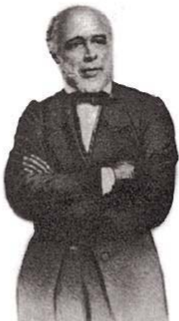
Francisco Jê Acaiaba de Montezuma