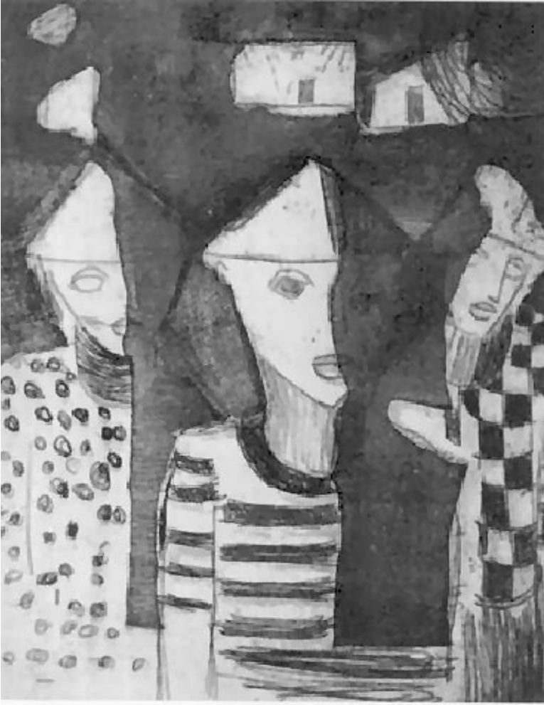
Fig. 5 Luiz C. A. Lima. Composição III. 1963. Gravura em metal. 21 x 17 cm. Acervo MAC-PR.