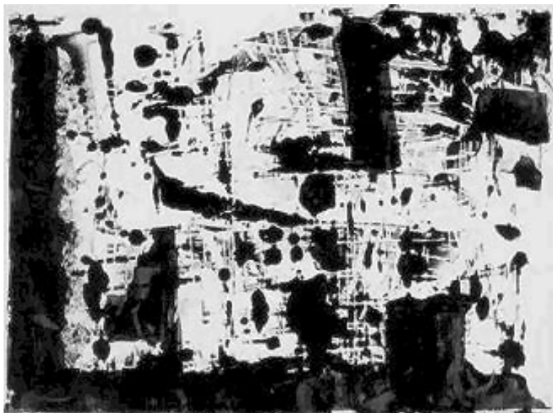
Fig. 3 Loio-Pérsio. Sem título. 1957. Tinta metálica.

influência do informalismo do artista espanhol Antoni Tàpies e revendo seus posicionamentos estético-ideológicos recentes, apresenta seus primeiros estudos abstratos já em 1957 ( Fig. 3 ), em exposição na galeria Cocaco 28 . Entretanto, seria somente nos primeiros anos da década de 60 que o ambiente cultural paranaense assistiria ao despontar, inclusive oficial, dessa poética.