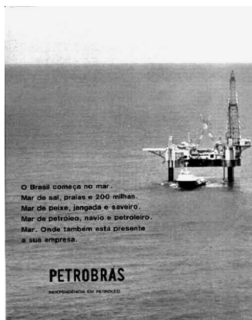
Figura 1 - Revista Veja n. 209 de 6/09/1972, p. 59.

comemorativa do 7 de Setembro de 1972, Sesquicentenário da Independência do Brasil, mas o mapa - símbolo não inclui esta porção marítima do território, o que transmite a sensação de que ela não existe na prática, apenas nos tratados e acordos. Este mapa - símbolo é um mapa das terras brasileiras emersas, e não exatamente do território sobre o qual a soberania é exercida.