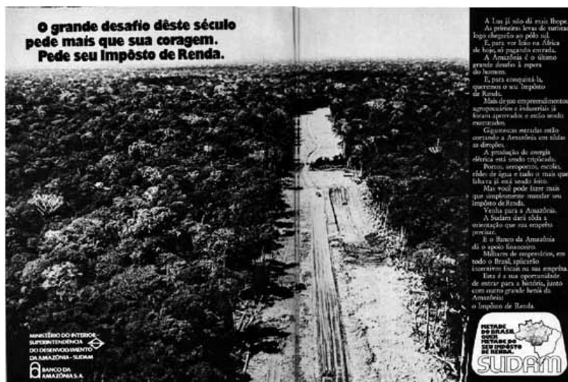
Fig.7 - Revista Veja n. 165, de 3/11/71, p. 16-17