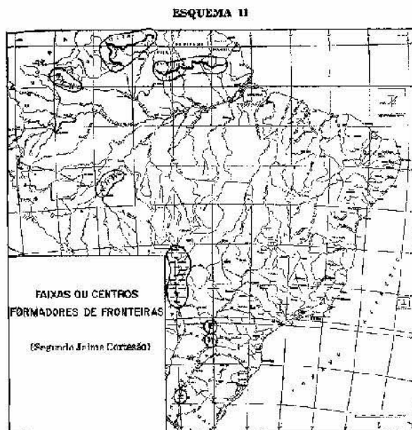
Figura 2. Apud Golbery do Couto e SILVA. Geopolítica do Brasil.

Enraizada no imaginário medieval e colonial da Ilha - Brasil, esta compreensão do Estado nacional e de seu território contamina o mapa usual do país e é transmitida juntamente com ele e suas variações.