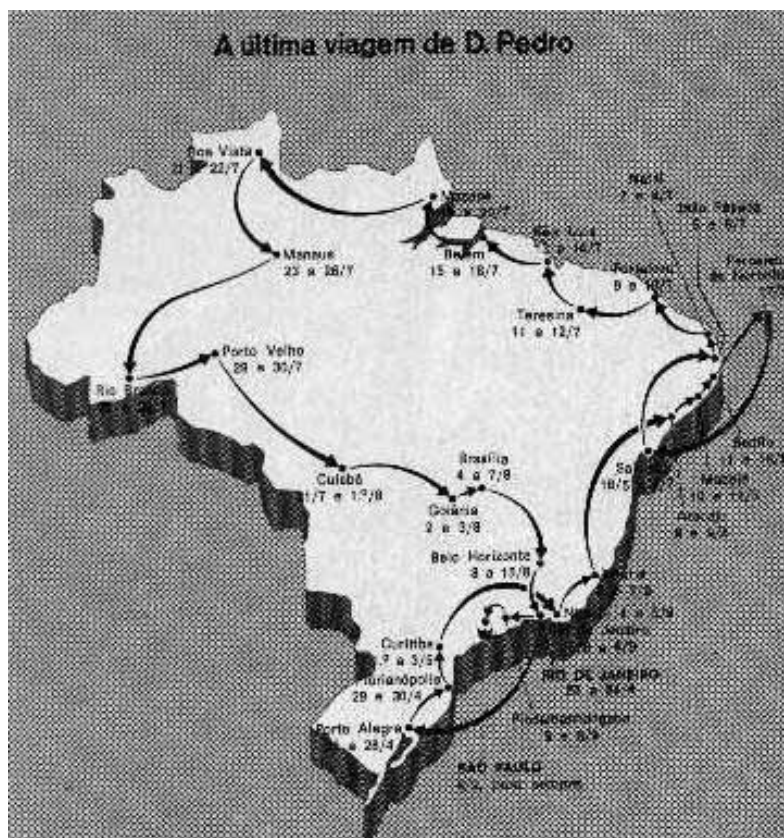
Figura 5 - Box em reportagem da revista Veja n. 190, de 26/4/1972, p. 23.