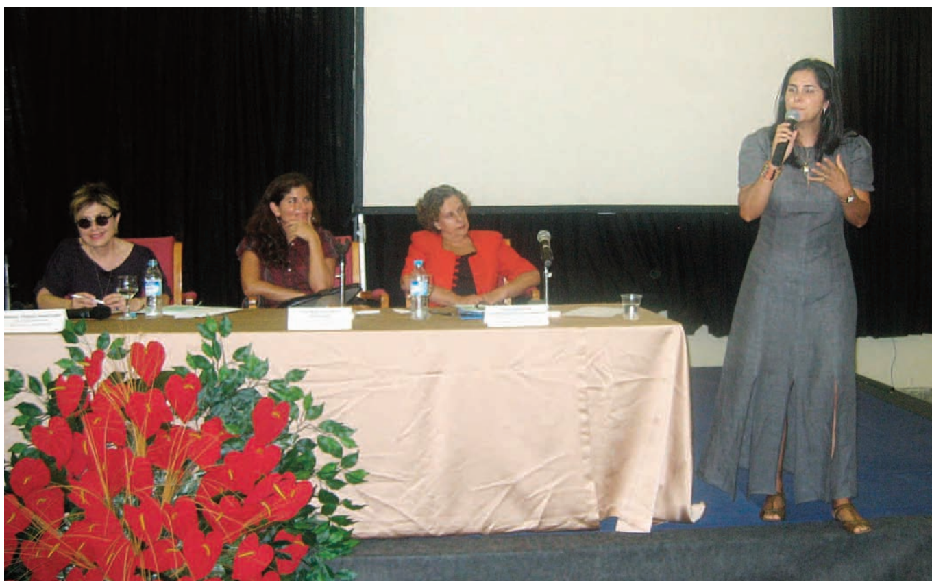
Em Brasília, Curso de Formação atendeu a 144 professores de todos os Estados e o DF