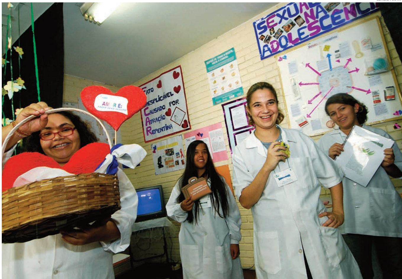
Trabalhadores da saúde também precisam comprometer-se com as práticas da inclusão