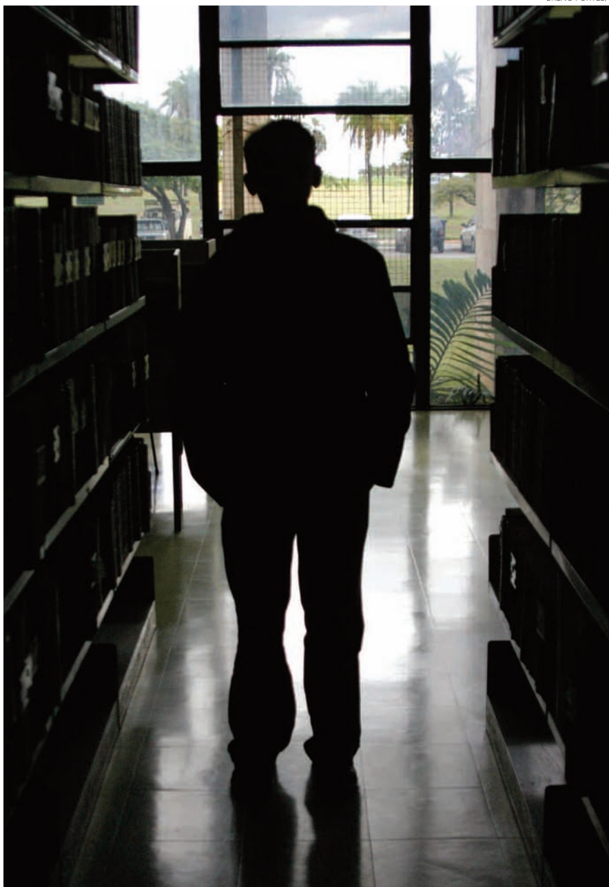
Compromisso com o trabalho para inclusão de qualidade