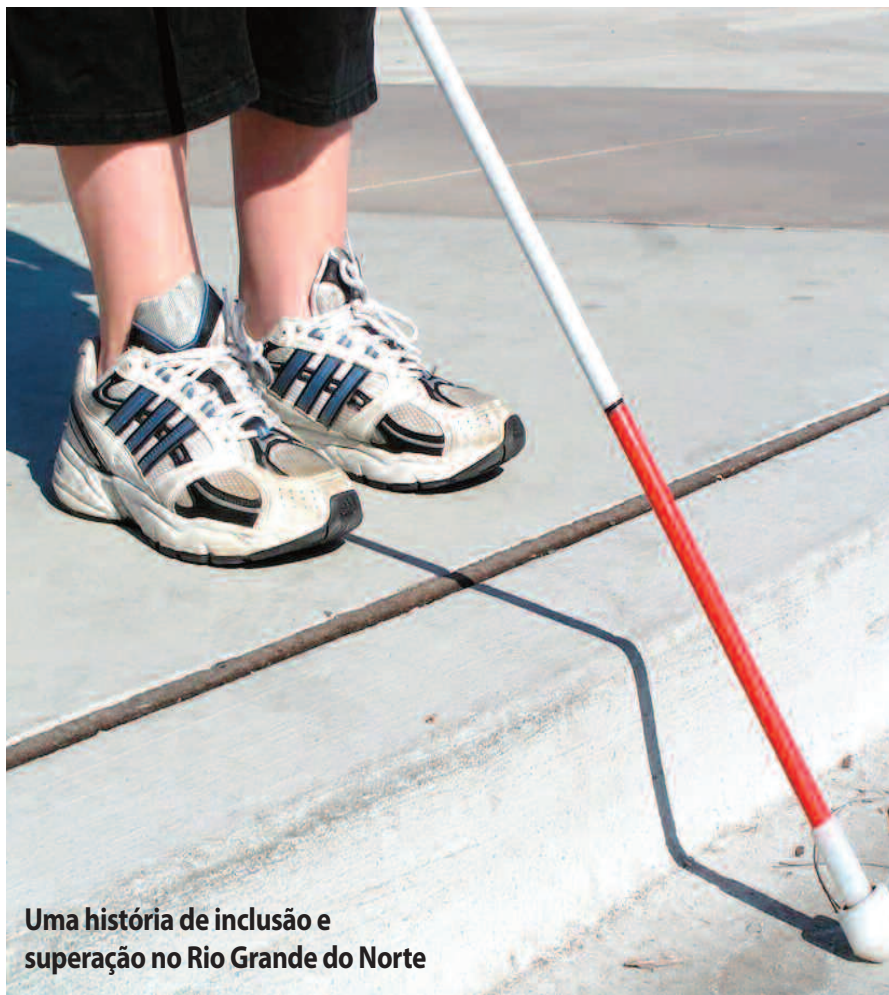
Uma história de inclusão e superação no Rio Grande do Norte

Minha família não tinha o conhecimento real da minha deficiência (baixa visão), decorrente de atrofia no nervo óptico, permitindo-me enxergar em torno de 5% (cinco por cento) no melhor olho. No entanto, em decorrência do material utilizado no ensino infantil na época (por exemplo: livros com letras grandes e contendo muitas gravuras) e a não-exigência de se copiar do quadro, facilitaram a minha boa integração com alunos e professores durante