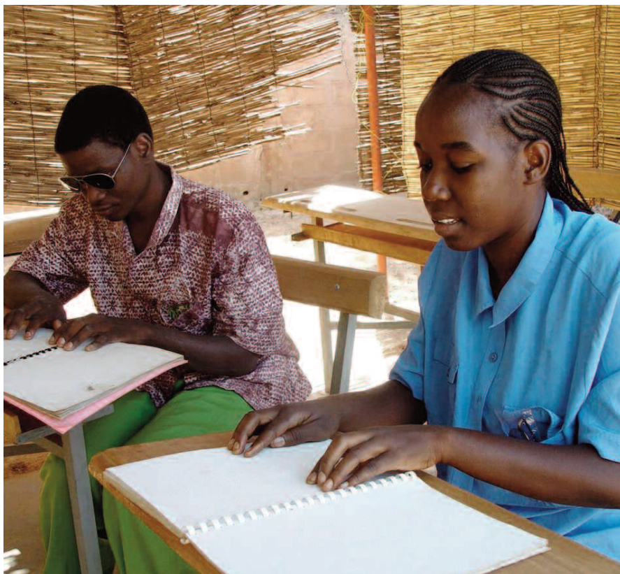
Acompanhamento e material adaptado são fundamentais na inclusão

O cenário brasileiro para população surdocega está mudando. Até os anos de 1990 não tínhamos muitos programas de atendimento para eles, hoje contamos com vários programas pelo Brasil e conquistas no processo de inclusão. Esperamos que as ações, em parceria com Grupo Brasil, Associação Educacional para a Múltipla Deficiência (Ahimsa), Associação Brasileira de Surdocegos (ABRASC) e Associação Brasileira de Pais e Amigos dos Surdocegos e dos Múltiplos Deficientes Sensoriais (ABRAPASCEM) e o Ministério da Educação, possam favorecer muitos surdocegos para a inclusão com responsabilidade e atenção às reais necessidades dessa população.