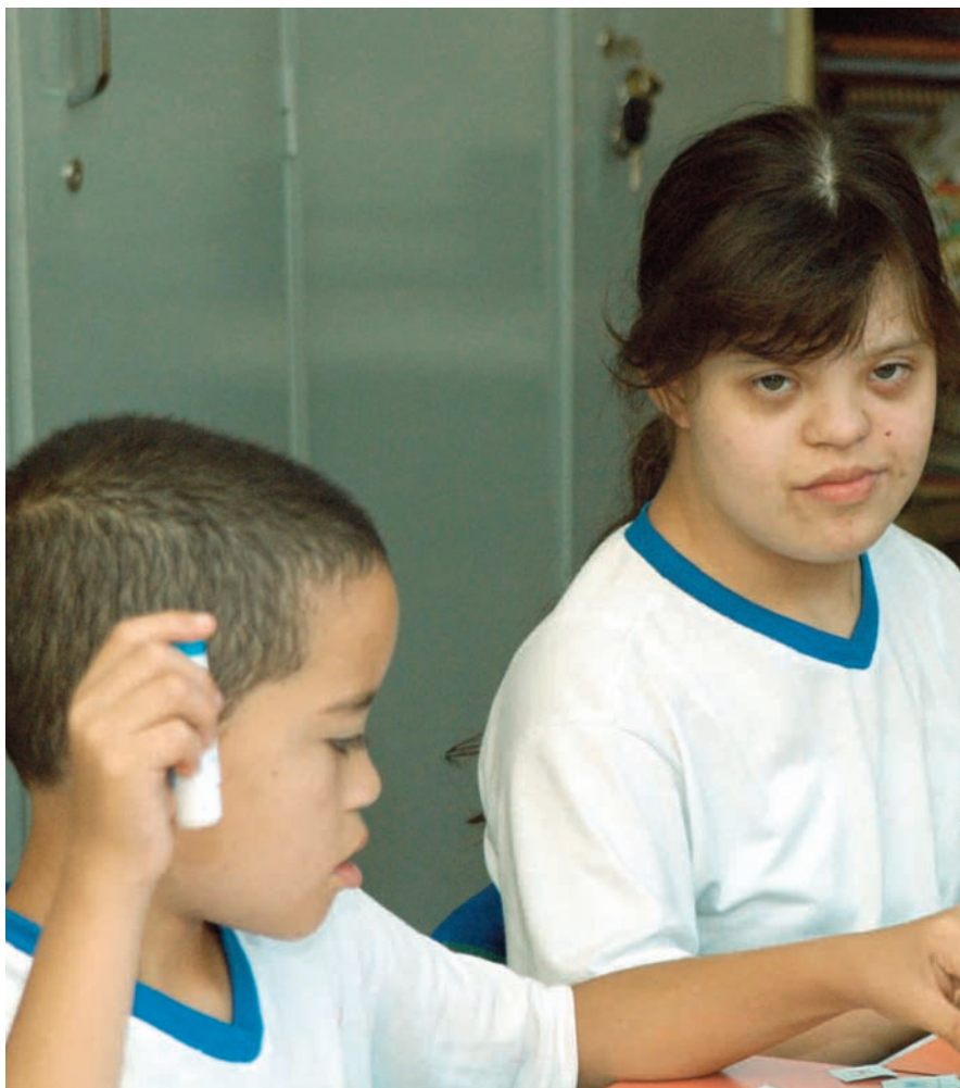
O comprometimento intelectual é variado de um indivíduo para o outro

As alterações cromossômicas são responsáveis por uma ampla gama de expressividade clínica.