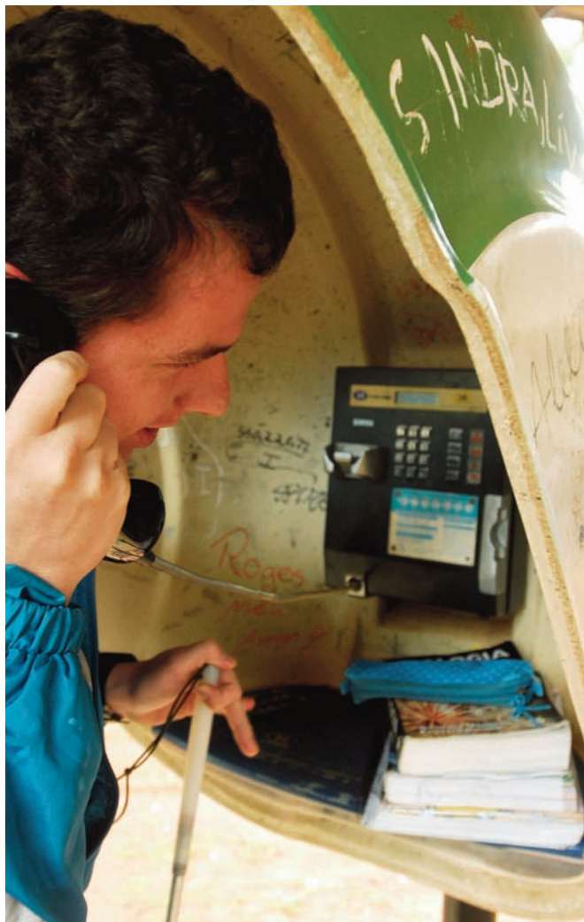
Orelhões sem cabine: eliminação de barreiras para evitar acidentes

Indica-se, portanto, a necessária promoção de “aproximação segura”, “alcance visual e manual” e “circulação livre de barreiras” para todas as pessoas (Decreto 5.296, art 16) nos campi universitários segundo as normas da ABNT. O que nos remete à necessária implementação de algumas ações, tais como: