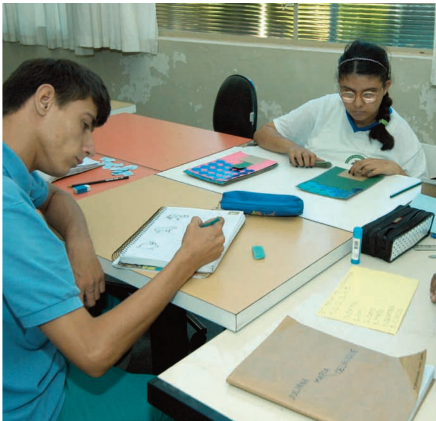
As universidades devem desenvolver ações interativas

O incômodo do desconhecimento pode ser positivo, se através dele assumimos nossa condição de eternos aprendizes que convivem constantemente com a dúvida e que consideram as cegueiras do conhecimento (ilusão e erro) e enfrentam as incertezas. Neste sentido, Morin nos adverte que, “de agora em diante, só devemos crer em crenças que comportem a dúvida no seu próprio princípio” (MORIN, 1986), pois “conhecer e pensar não é chegar a uma verdade absolutamente certa, mas dialogar com a incerteza.” (MORIN, 2002). O desafio de aprender a aprender ou, especialmente, aprender com as diferenças, possibilita a construção de um paradigma educacional que é flexível e propício à inovação em vivências personalizadas do aprender a aprender – especialmente no ensino superior.