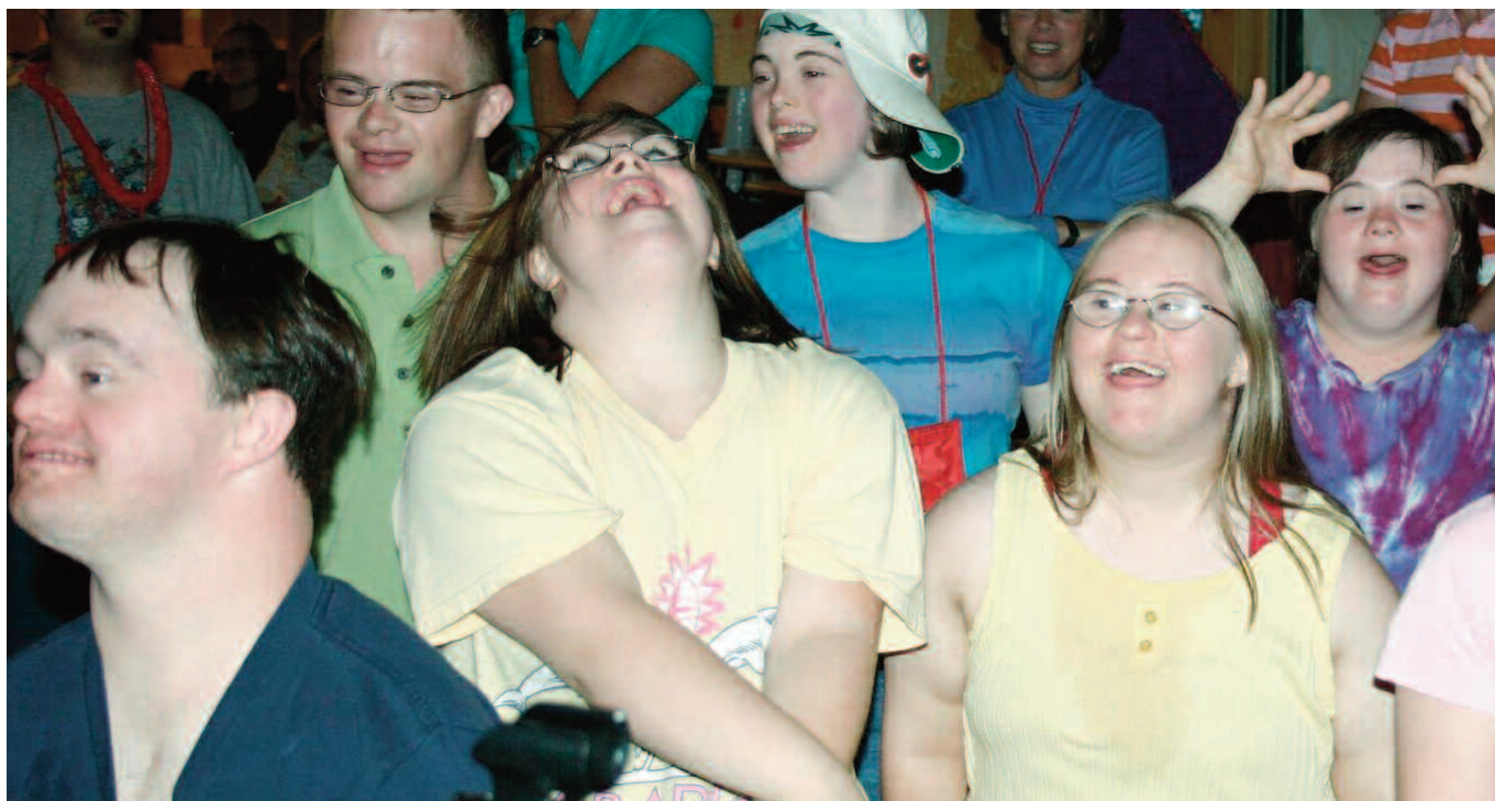
Todos aprendem, mas é preciso saber como ensinar

vemos ter conhecimento de onde e de quem pode colaborar com nossas propostas, idéias e na resolução de nossas dúvidas, que são progressivas, partindo-se do princípio da necessidade do conhecimento.