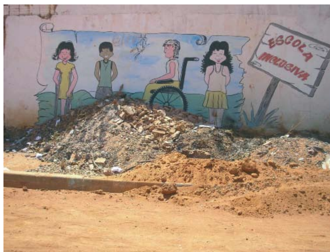
“Inclusão sim, entulho não!”

Especial cuidado se deve ter com a correta destinação do lixo produzido na escola. O ideal é a coleta seletiva, diária no caso dos “orgânicos”. O entorno da escola deve ser conservado limpo, como exemplo para a comunidade. “Xô mato, xô entulho!”