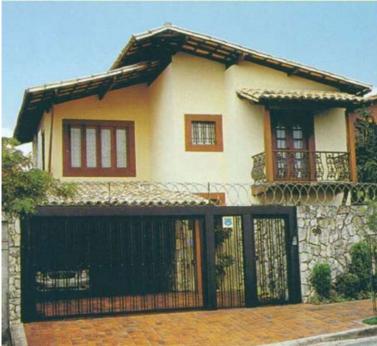
“Extremo 1: quanto mais proteção, mais segurança. Será?”

Ainda hoje, milhões de brasileiros, na zona rural, não têm a propriedade de terras para trabalhar e, nas cidades, não possuem casa para morar, obrigados que são a pagar aluguéis desproporcionais a seus ganhos ou a morar em barracos improvisados em favelas. Em contrapartida, muitos outros possuem extensos latifúndios, com milhares de hectares de terra, cultivados ou não. E outros muitos moram em amplas mansões ou apartamentos, ostentando luxo e riqueza desnecessária ao gozo dos direitos humanos.