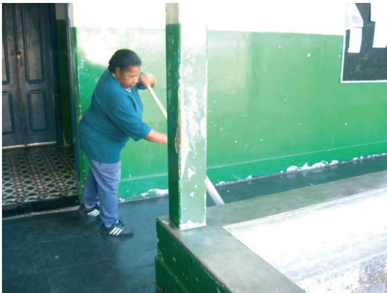
“Higiene: ato individual ou ato coletivo?”

OIT – http://www.oitbrasil.org.br/ OMS – http://www.opas.org.br/