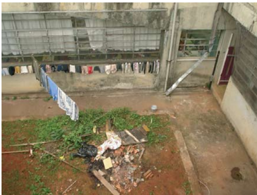
“O espaço escolar, sem higiene, não é espaço educativo.”

E se as enfermidades são a violência à saúde, e a higiene uma das armas para combatê-la, quais serão nossas armas para vencer a violência e a insegurança que assola nosso espaço de trabalho, nosso espaço educativo?