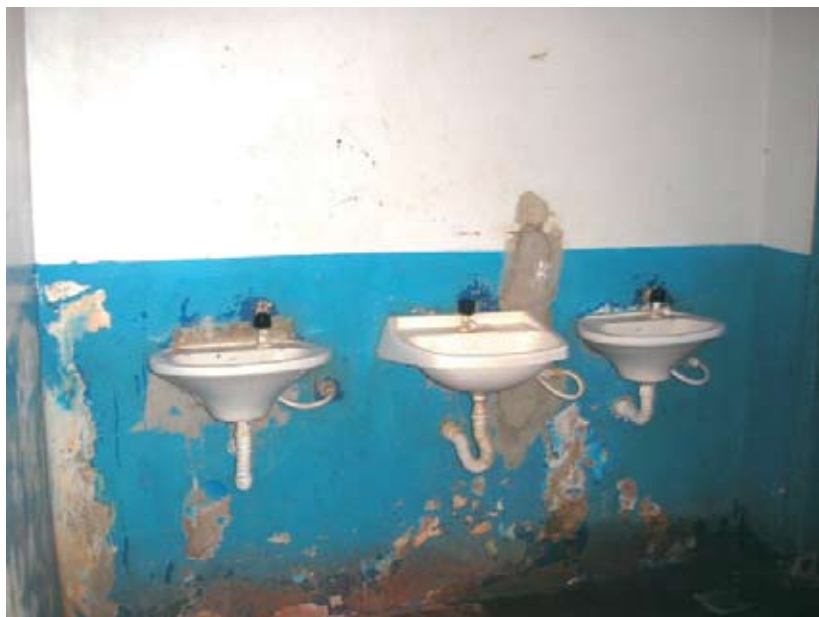
“Faltando a estética, a higiene é inviável!”

Lavar as mãos após ir ao banheiro é um hábito que muita gente não tem. No Brasil, com tanta abundância de água, até nos hospitais e nos postos de saúde existe uma deficiência na higiene. Algumas pesquisas estimam que apenas de 10 a 15 por cento dos funcionários desses locais lavam as mãos adequadamente antes de executar suas tarefas. O brasileiro, em geral, ao lavar as mãos com água e sabão, tem pressa, mesmo depois de ir ao banheiro.