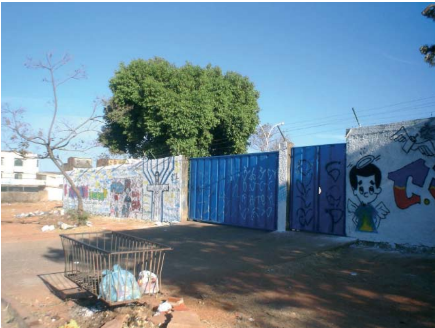
“Ontem, um ingênuo alambrado. Hoje, muro alto, portão de aço e arame farpado. Amanhã, as cores do mural irão frutificar?”

Não podemos simplesmente abominar o vandalismo e tomar providências de fora para dentro, como intervenções externas e autoritárias.