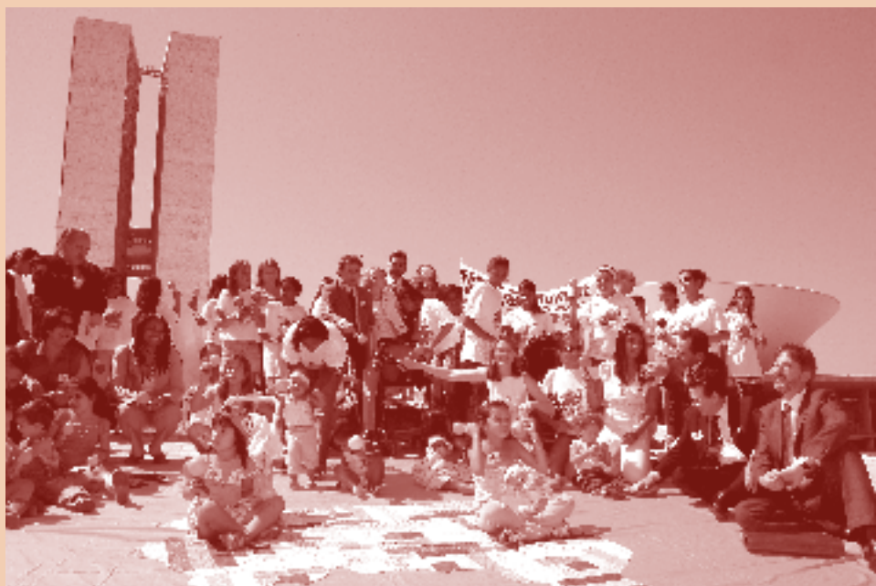
“Carrinhaço” conquista apoio de parlamentares em Brasília