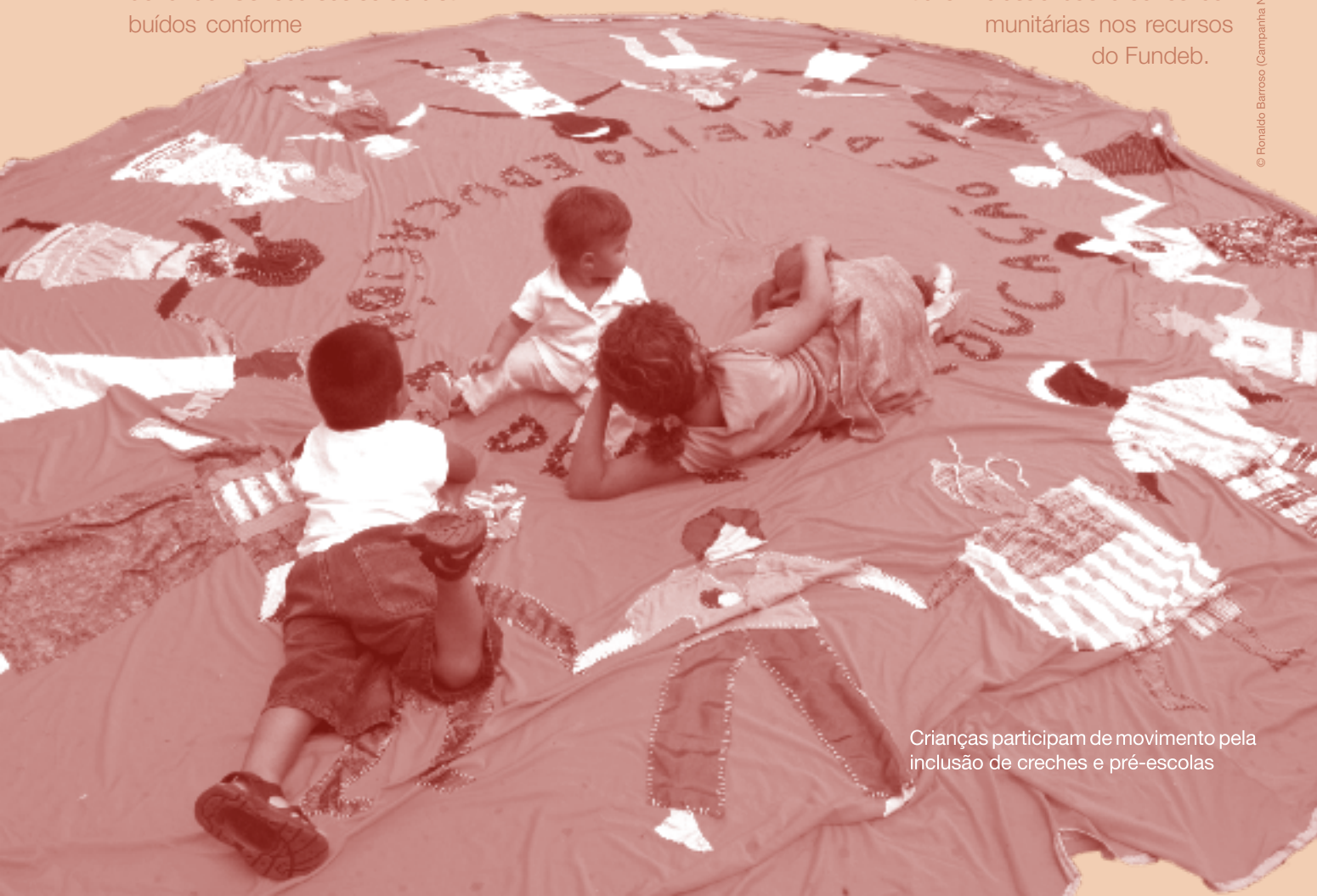
Crianças participam de movimento pela inclusão de creches e pré-escolas

Fátima Bezerra afirma que, na condição de relatora, teve o privilégio de participar de ricas discussões e acirrados debates voltados à formulação de um projeto educacional que atendessem às diversas modalidades da educação básica. “A construção do Fundeb contou com a participação de gestores públicos, parlamentares, comunidade educacional e diversas entidades da sociedade civil organizada. A amplitude do debate se expressa nas 231 emendas apresentadas, das quais acatamos 150”, lembra a deputada. Uma foi de especial importância para a educação infantil, pois permitiu a inclusão das creches comunitárias nos recursos do Fundeb.