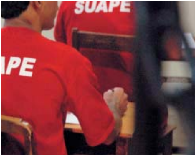
Presos durante una clase en la Prisión Doutor Pio Canedo, en Pará de Minas (Estado de Minas Gerais)