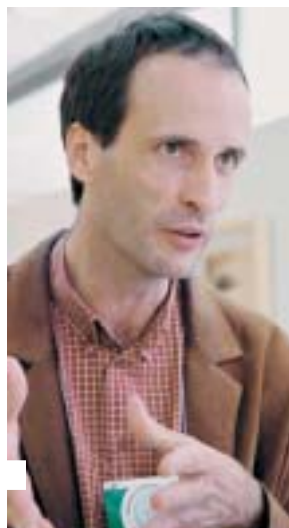
Demelene, de Paraguay, defiende la articulación de las familias en la misión de educar