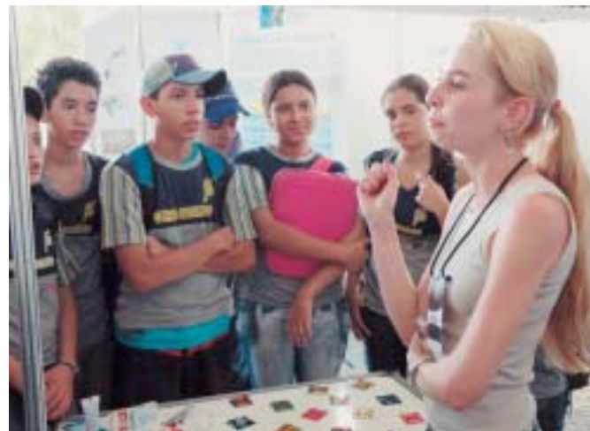
Visitantes de escuelas públicas escuchan explicaciones sobre uso de métodos anticonceptivos

También involucrados en los problemas locales, estudiantes del estado de Acre, de la capital Rio Branco, presentaron un proyecto de análisis del porcentaje de alcohol presente en la gasolina vendida en las estaciones de servicio de la ciudad. “En 2001, oímos muchas noticias sobre los problemas existentes en los motores de los automóviles y se decía que el motivo podría ser la cantidad de alco-