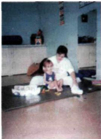
Fig. 6. Sessão individual de atendimento.

Essa formação multidisciplinar do professor não significa que a criança tenha de ser vista "por partes" ou ficar sujeita a atendimentos variados com profissionais das diferentes áreas. Implica o professor possuir tais conhecimentos, o que não elimina a possibilidade de, para melhor qualidade do trabalho, vir a receber orientação direta dos profissionais dessas áreas. (Fig. 6)