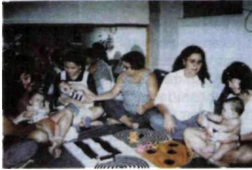
Fig. 3. Sessão de atendimento a crianças com deficiência múltipla (visual e física).

As crianças com deficiência mental e visual associadas enfrentam dificuldades conceituais, de compreensão, de processamento dos fatos da realidade e do