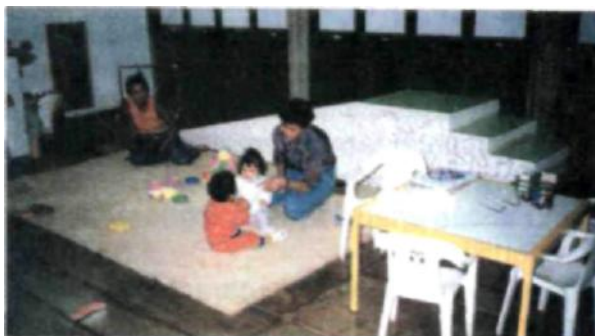
Fig.8. Materiais e equipamentos tornam o ambiente mais lúdico, com a participação da professora e da mãe.

Dentre os equipamentos e mobiliários destacam-se alguns como indicados para atender às especificidades das crianças com múltipla deficiência, a exemplo dos aparelhos auditivos, mesas e cadeiras adaptadas, lupas manuais e de mesa. O espaço amplo e bem adaptado é necessário para favorecer a mobilidade das crianças (Fig. 7) e a instalação de barras, rampas, brinquedos fixos no teto ou na parede, cantinhos, tablado, cenário, dentre outros, como se vê na Fig. 8.