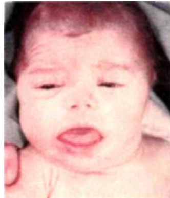
Fig.1. Criança afetada pelo funcionamento deficiente da tireóide.

Nessa concepção, uma deficiência inicial é geradora de outras deficiências secundárias , vindo a caracterizar a múltipla deficiência .