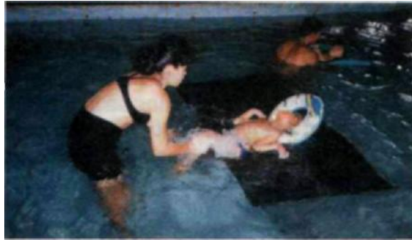
Fig. 9. Atendimento em hidroestimulação.

As condições da criança definem o ponto de partida e a finalidade de cada sessão, bem como o ritmo e a expectativa de finalização do programa, como indicado pela avaliação processual.