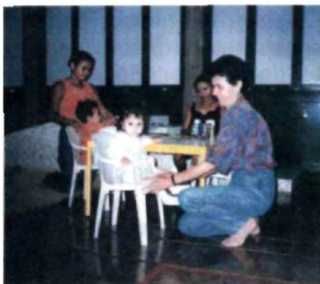
Fig. 5. Sessão grupal do Programa de Intervenção Precoce, realizada com as mães e a professora.