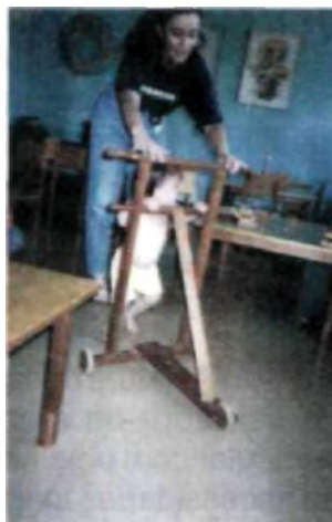
Fig.7. Professor apoiando a marcha

sensações tátil-cinestésicas e estimular movimentos variados no tempo e no espaço (lentos, rápidos, simples, longe, perto, etc).