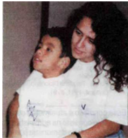
Fig.2. Criança com múltipla deficiência.

A criança retratada na Fig.2, é considerada portadora de múltipla deficiência, pela associação de perda visual e auditiva. As duas deficiências são ditas primárias , porque independem uma da outra, ou seja, não guardam uma relação de causalidade entre si.