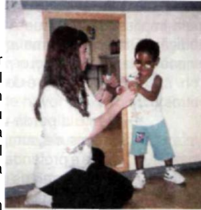
Fig. 4. Criança com deficiência visual e auditiva.

A atuação do educador assume uma importância essencial no atendimento às pessoas com deficiência visual e auditiva. Seu papel mediador nas relações da criança com o meio é essencial para o desenvolvimento e a aprendizagem do aluno.