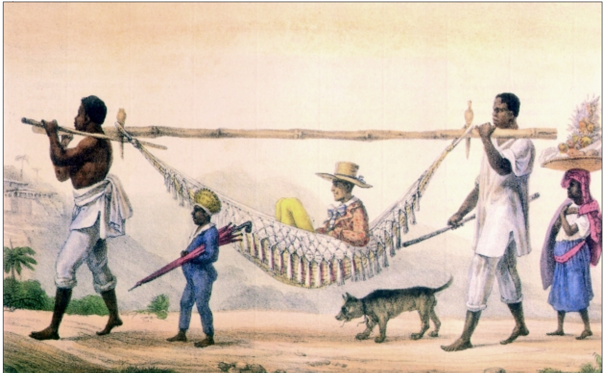
Figura 1 - O regresso de um proprietário , de Jean Baptiste Debret.