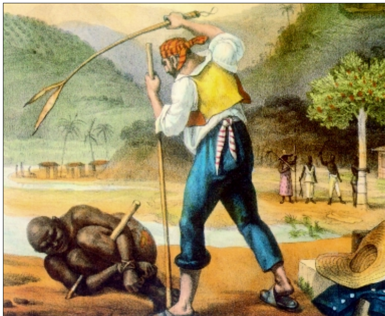
Figura 4 - Feitores castigando negros , de Jean-Baptiste Debret.