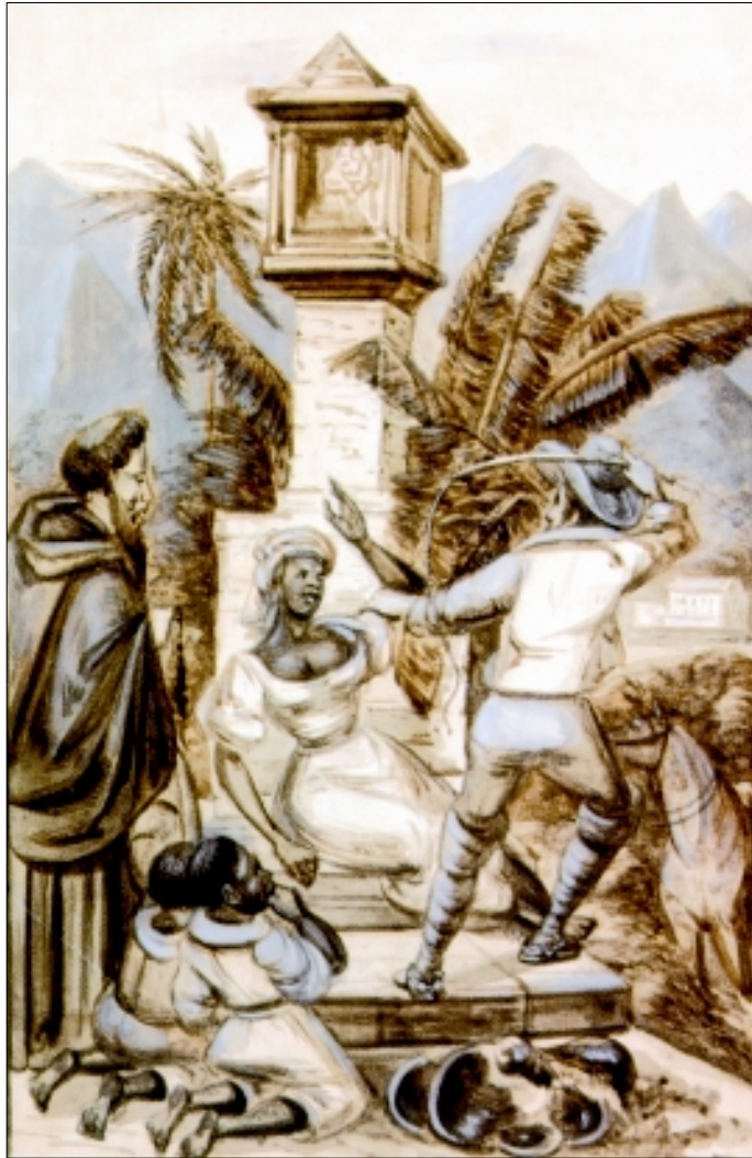
Figura 6 - Sem título , de Paul Harro-Harring