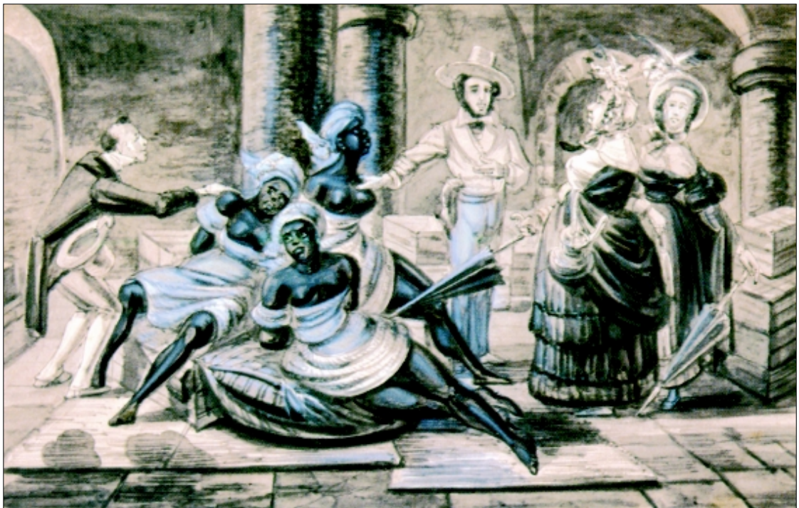
Figura 3 - Inspecção de negras recém-chegadas da África , de Paul Harro-Harring.