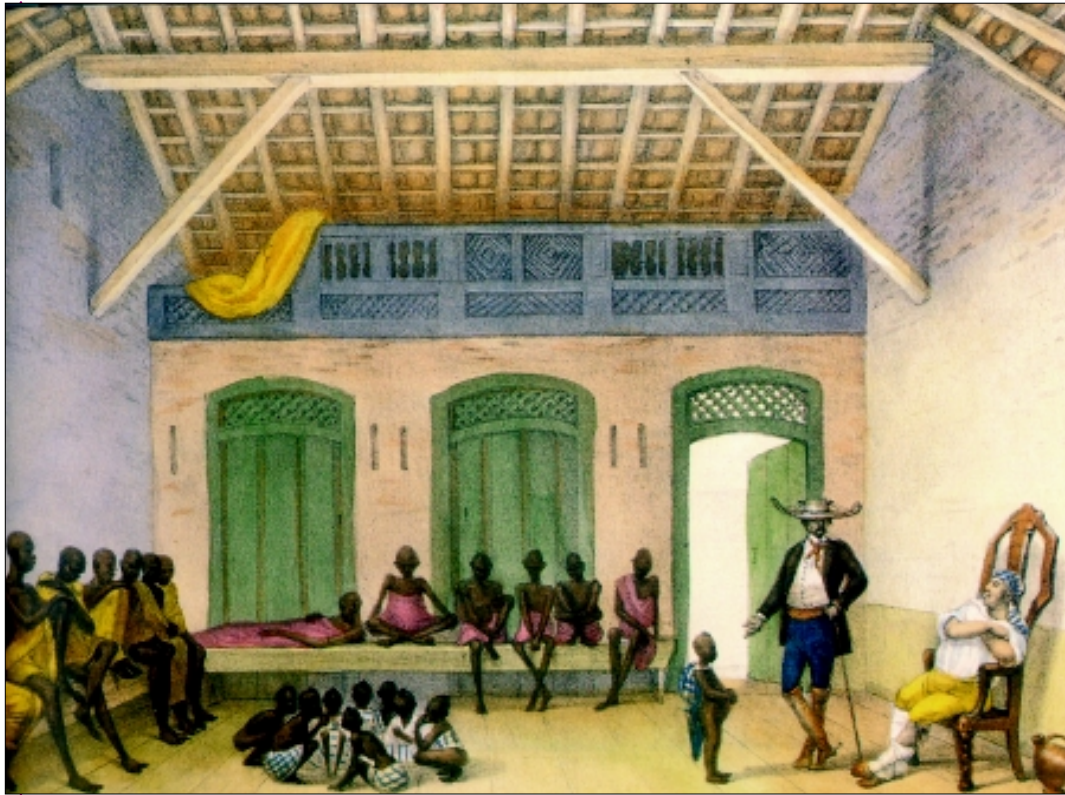
Figura 2 - O mercado da Rua do Valongo , de Jean Baptiste Debret.