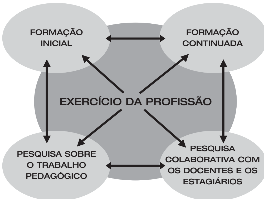
Figura 1: Adaptada de Tardif et al. S/d., p. 26.

Não há nenhum modelo a ser seguido, nem perfil ou estereótipo profissional a ser buscado. Entretanto, como analisa Ilma Passos Alencastro Veiga 9 , “o projeto pedagógico da formação, alicerçado na concepção do professor como agente social, deixa claro que é o exercício da profissão do magistério que constitui verdadeiramente a referência central tanto da formação inicial e continuada como da pesquisa em educação. Por isso, não há formação e prática pedagógica definitivas: há um processo de criação constante e infindável, necessariamente refletido e questionado, reconfigurado. A figura 1, a seguir, ilustra essa proposição: