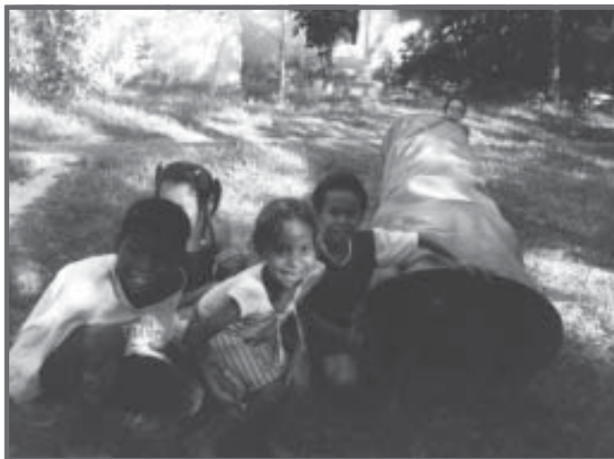
Crianças deficientes auditivas e visuais incluídas na Escola Municipal Caminho, Lagoinha, Bahia.

Assim, o processo de avaliação na perspectiva da educação inclusiva e da aprendizagem significativa não está centrado apenas no desenvolvimento de habilidades e competências, nem na capacidade de assimilar conteúdos e acumular informações, mas sim na possibilidade de pensar, fazer escolhas, agir com autonomia, relacionar-se com o outro e com o objeto de conhecimento, de comunicar-se, expressar sentimentos, idéias, resolver problemas, criar soluções, desenvolver a imaginação e participar criticamente da cultura para transformação de sua comunidade.