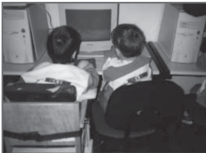
Inclusão em C.E.I em Campo Grande (MS)

Oferecer espaço adequado à movimentação das crianças, mobiliários interativos, brinquedos e mobiliário adaptados, quando necessários, são organizações essenciais para o desenvolvimento e aprendizagem de todas as crianças. E são providências e medidas indispensáveis para a inclusão escolar e social.