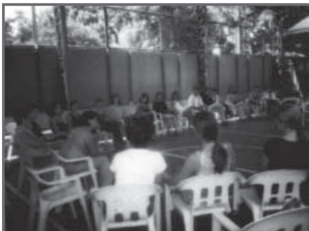
Pais e professores: discussão e decisão coletiva

Nessa perspectiva, tendo como ponto de partida e de chegada a relação dialógica, os conflitos vividos no interior da sala de aula e o potencial da escola para criação de rede de apoio e ajuda mútua envolvendo os pais e os recursos disponíveis na comunidade, e tendo em vista o sucesso no processo de aprendizagem de todos os alunos, é que gostaríamos de compartilhar com vocês alguns desafios e experiências exitosas.