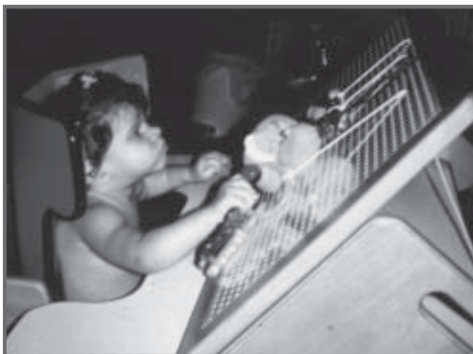
Inclusão em C.E.I. Rio de Janeiro no nível maternal.

É importante ressaltar que a inclusão de alunos com deficiência não depende do grau de severidade da deficiência ou do nível de desempenho intelectual mas, principalmente, da possibilidade de interação, socialização e adaptação do sujeito ao grupo, na escola comum. E esse é o maior desafio para a escola hoje – modificar-se e aprender a conviver com dificuldades de adaptação, gostos, interesses e níveis diferentes de desempenho escolar.