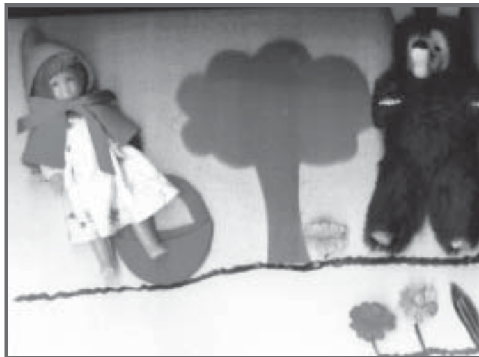
História infantil adaptada pela mãe e professoras- Jacobina, Bahia

Faz-se necessário selecionar as atividades, diminuindo o grau de dificuldade ou nível de abstração, e partir sempre do que é conhecido, dos significados já adquiridos pelo aluno. Oferecer apoio ou ajuda para realização de atividades nas quais o aluno mostre maior dificuldade, modificar a seqüência ou a maneira de realizar determinadas atividades são também estratégias válidas.