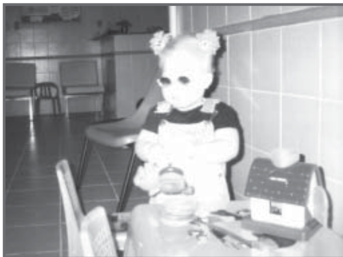
Centro de Intervenção Precoce (CIP) - Salvador, BA.

O trabalho integrado com as áreas da saúde e ação social é prioritário para a aquisição de órteses, próteses e equipamentos específicos.