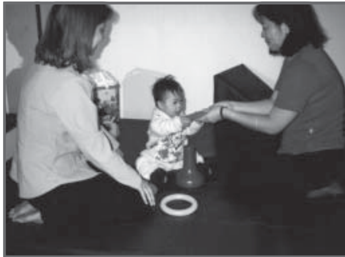
Programa de intervenção precoce. (CEES – Centro de Estudos da Ciência e da Saúde, UNESP - MARÍLIA, SP)

Os programas de intervenção precoce do nascimento aos três anos de idade são imprescindíveis para a promoção das potencialidades e aquisição de habilidades e competências. Eles devem ser, portanto, desenvolvidos em interface com os serviços de saúde, tendo em vista que essas crianças necessitam, algumas vezes, de orientação ou atendimento complementar nas áreas de fisioterapia, fonoaudiologia, terapia ocupacional e psicologia.