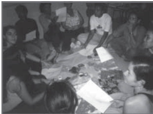
Professores trabalhando juntos

As questões aqui levantadas apontam para a necessidade de se criar uma rede de trocas de informações, experiências, saberes e reflexões sobre o fazer pedagógico, confrontados com os referenciais teóricos que fundamentam a aprendizagem significativa e a construção do conhecimento de forma coletiva.