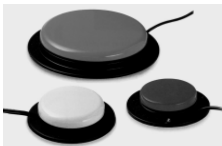
Ilustrações mostram teclado especial, mouse com adaptação e acionadores de pressão