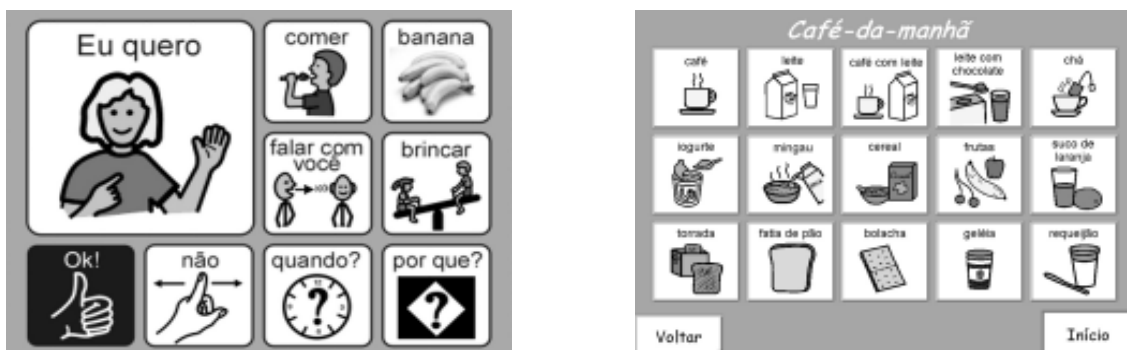
Exemplos de recursos de baixa tecnologia confeccionados com simbologia PCS – software Boardmaker

O acesso à mensagem poderá ser feito de forma direta, quando o aluno toca o símbolo que corresponde ao que deseja comunicar ou de forma indireta, através do olhar para o símbolo ou de algum sinal afirmativo, previamente combinado, que é emitido no momento que outra pessoa, ou um sistema de varredura automática, chega até a mensagem desejada.