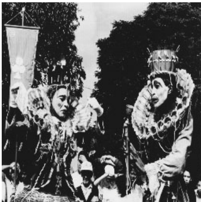
Figura 1: “A Farsa dos opostos”. Foto Memória 30 anos do Festival de Londrina 1997, p. 133.

significados sociais. Essa forma de compreensão da arte inclui modos de interação como a empatia e se concretiza em múltiplas sínteses.