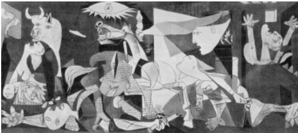
Figura 3: Picasso, “Guernica”, 1937, Museu Rainha Sofia, Madri.

“Guernica”, de Picasso, traz a idéia do repúdio aos horrores de uma guerra específica. Uma pessoa que não conheça as intenções conscientes de Picasso pode ver “Guernica” e sentir ou não impactos marcados pela intenção do artista; pode sentir outros gerados pela relação entre as imagens da obra de Picasso e os dados de sua experiência pessoal, como o adolescente que, vendo essa imagem, a relaciona a uma explosão nuclear.