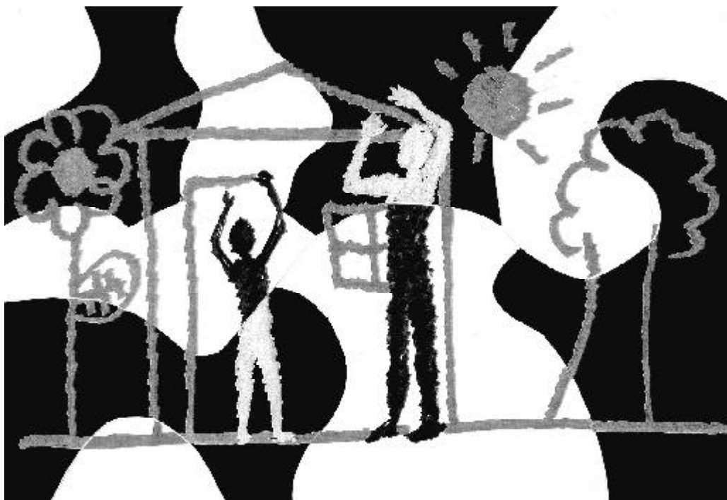
Ilustração: Helena Giordano Salgado

O conceito de totalidade na nação moderna não significa apenas o aproveitamento de todos os indivíduos no projeto coletivo, como também o aproveitamento de toda a sociedade em benefício de cada indivíduo, isto é, os mecanismos e estruturas sociais devem facilitar a inclusão dos indivíduos no projeto social. Já se vislumbra a superação do dualismo entre trabalho e educação, pois as técnicas sociais caminham para uma crescente conversibilidade mútua, as técnicas de trabalho