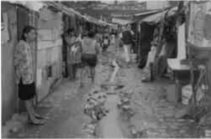
Ocupação na Favela da Água Fria Missão Recife/PE em 10/06/2004