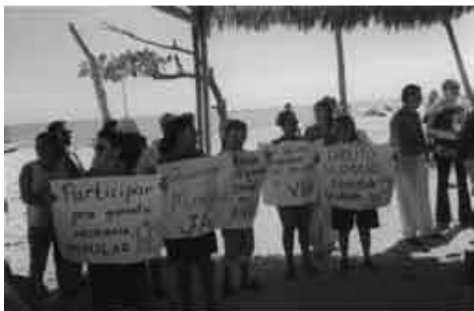
Reunião Goiabeiras em 08/06/2004 Missão a Fortaleza/CE