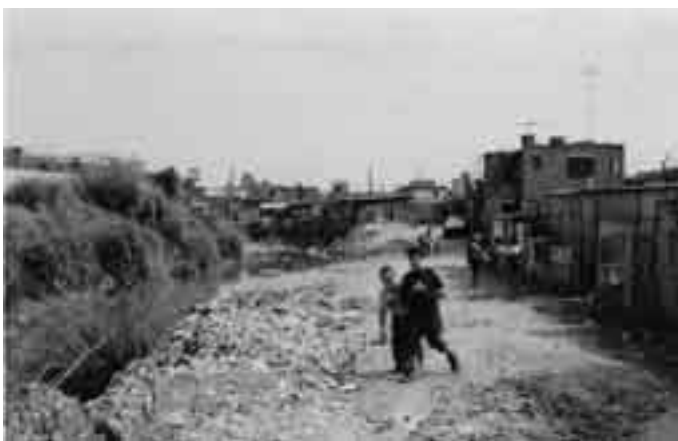
Comunidade Beira-Rio às margens do córrego do Oratório Fazenda da Juta - Missão a São Paulo/SP em 30/05/2004