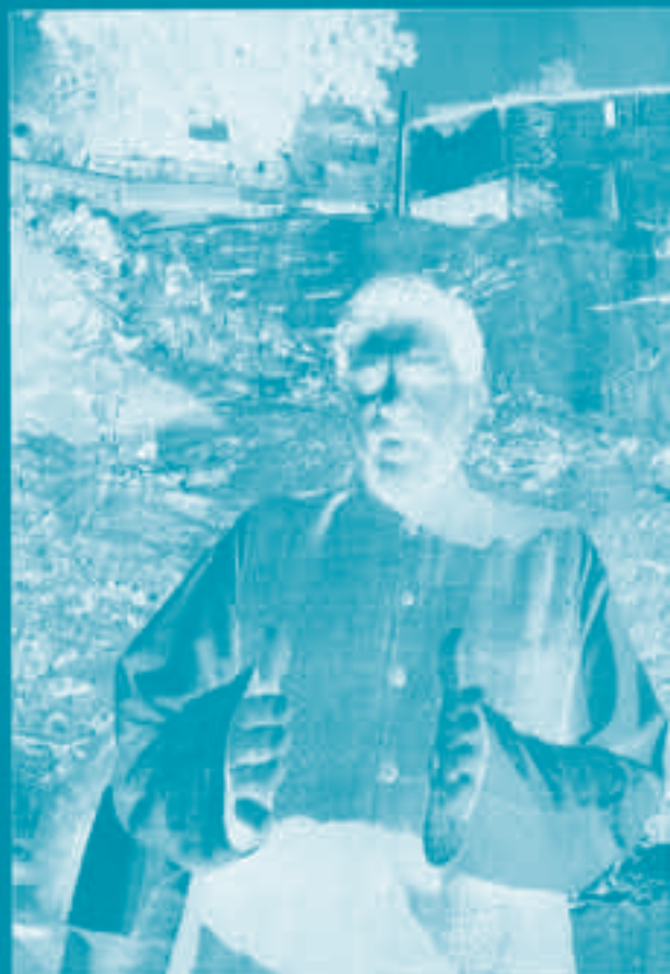
Kothari, no Morro da Providência (Rio): quem “mal consegue garantir

Conservador – O relator fez ainda ressalvas às restrições econômicas auto-impostas pelo governo brasileiro, especialmente em relação à contenção de investimentos. “O Brasil está seguindo uma política econômica muito conservadora. Um governo com a boa imagem e a credibilidade que o brasileiro tem no exterior