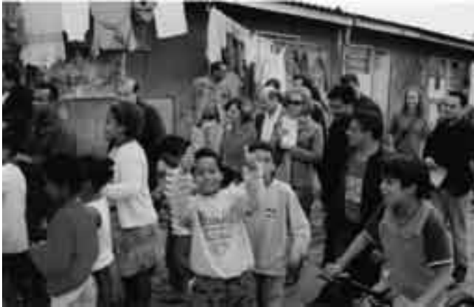
Alojamento-Favela de Heliópolis Missão a São Paulo/SP em 30/05/2004