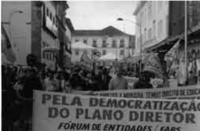
Passeata Pelourinho Missão a Salvador/BA em 09/06/2004