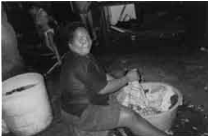
Favela Vila Imperial, ribeirinha e em área de risco Missão Recife/PE em 10/06/2004