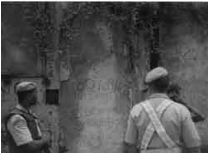
Patrimônio Histórico interditado e abandonado no Pelourinho Missão a Salvador/BA