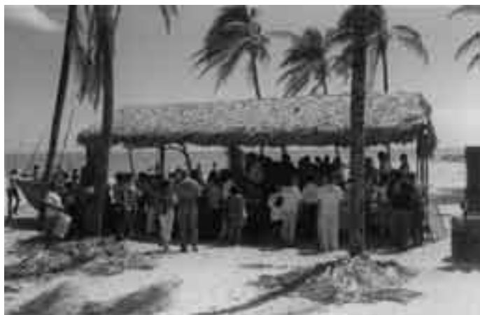
Reunião Goiabeiras em 08/06/2004 Missão a Fortaleza/CE