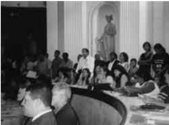
Audiência pública na Assembléia Legislativa Missão Recife/PE em 10/06/2004