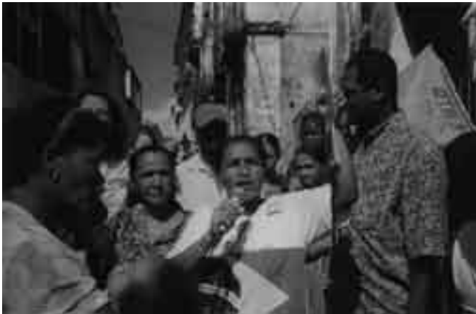
Moradora do Centro Histórico, denunciando despejos forçados no Pelourinho Missão a Salvador/BA