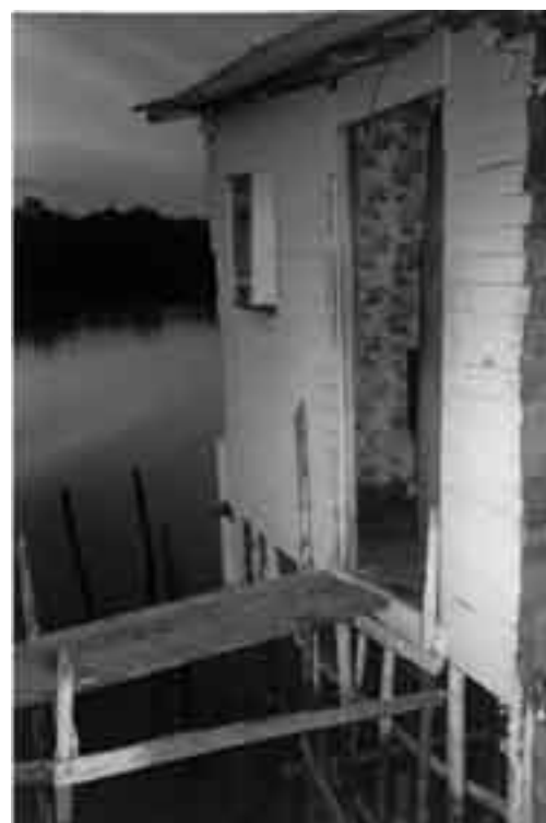
Palafitas de Gamboa – Periferia de São Luis/MA