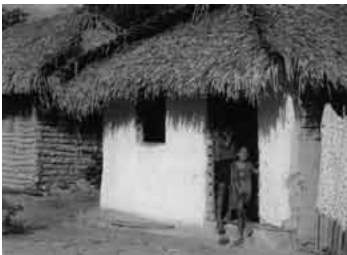
Comunidade Quilombola Missão a Alcântara/MA