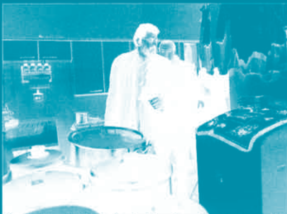
Ocupação na R. Maria Paula: situação será relatada em abril