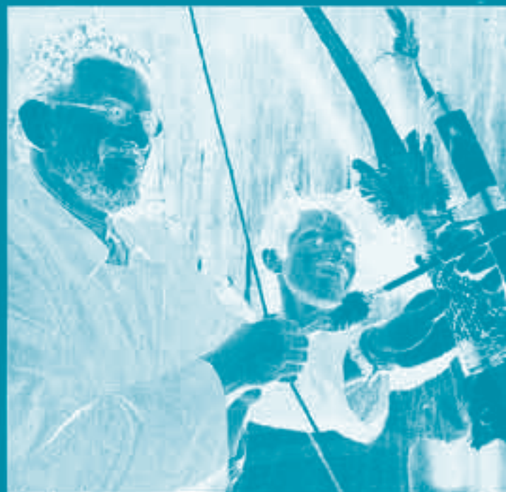
Kothari na reserva: preocupação com a situação

Depois da visita, disse que está claro que os índios têm sido negligenciados em seus direitos. Ressaltou a ne-