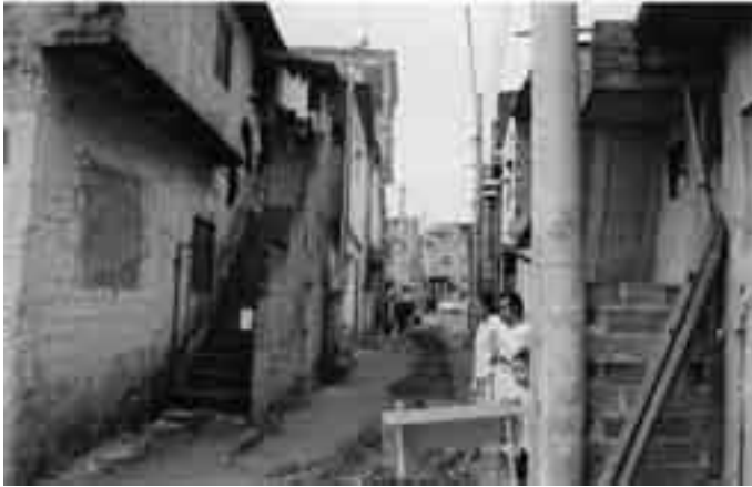
Favela de Heliópolis Missão a São Paulo/SP em 30/05/2004