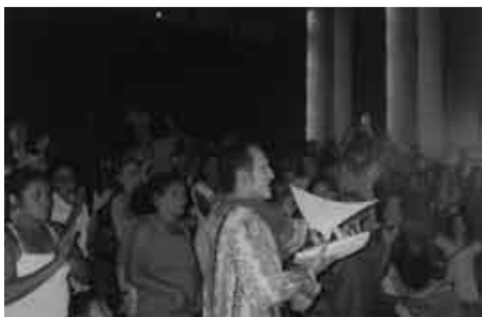
Audiência Pública Missão a Fortaleza/CE