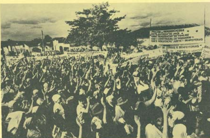
2ª Concentração dos Trabalhadores Rurais da Região de Itaparica - PE/BA