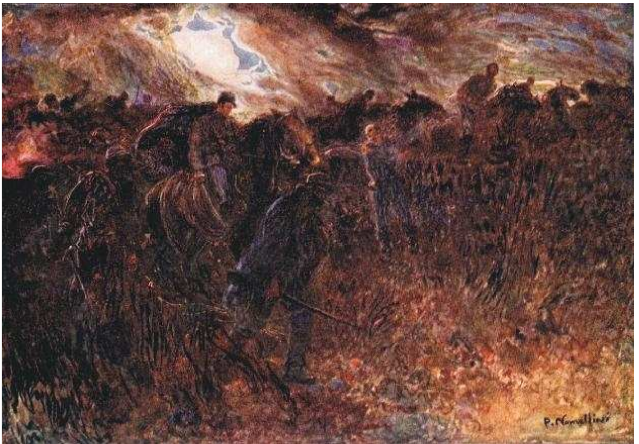
Immagine 2 Cavalcata notturna verso Novara