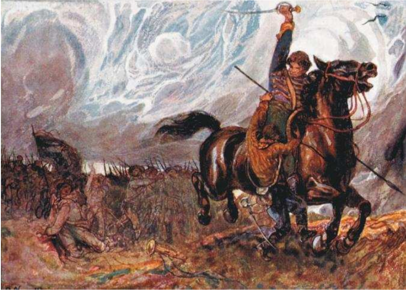
immagine 4 IL TROMBETTA DEL SALTO

Per boschi e campi passa il cavaliere tra uno svolar di code e di criniere, e groppe mosse su e giù come onde, e ringhi acuti ed ansie fremebonde, ed urli e calci al vento e salti a sghembo, e il subito ampio rotolar d'un nembo.