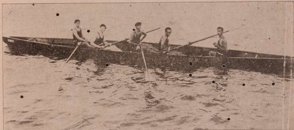
A guarnição do Sport Club do Recife, vencedora do páreo "Campeonato do Estado"

Para ainda mais reduzir as difficuldades com que lucta a dona de casa moderna