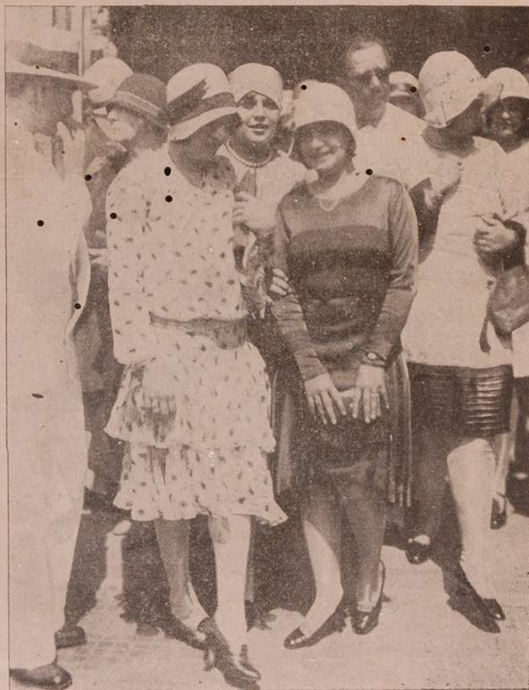
Porta da igreja. Sahida da missa, Sorrisos. Etc.