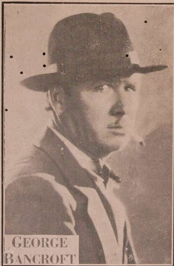
No film "Paixão e Sangue" que será exhibido nos cinemas "Royal" e "Helvetica" nesta semana

● film que acabamos de fazer, "Paixão e Sangue", é film que todos devem ver, — homens, mulheres e crianças. Elle pinta o crime, condições exactas em que elle campeia em tantas das grandes metropoles americanas. E fal-o com vigor, sim, mas sem descabidas exaltações, porque afinal, desnudado até a sua propria alma, o cri-