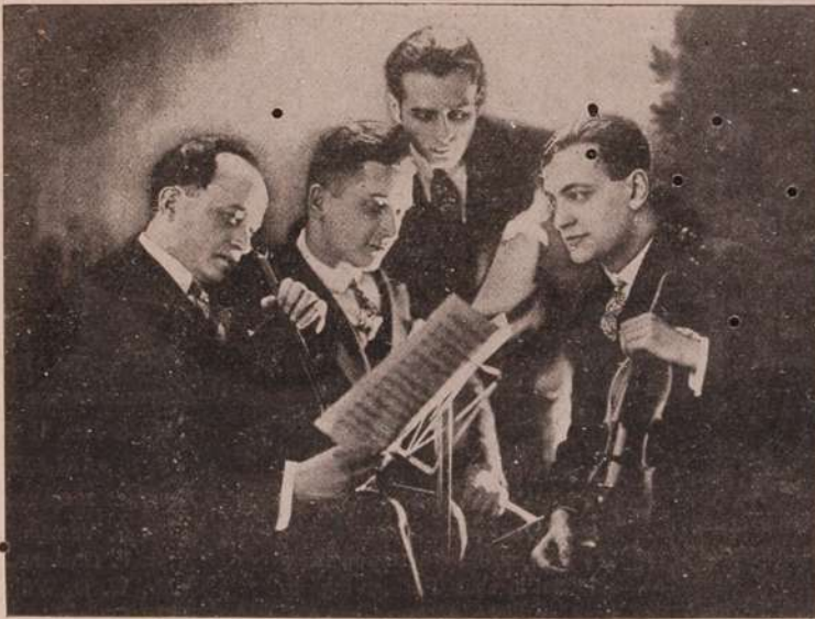
The "Guarneri Quartetto" contracted to give two concerts at the Theatro St. Izabel under the auspices of the Sociedade de Cultura Musical

The subscription is 10$000 per month for gentlemen, which in-