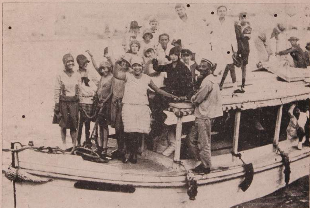
A S R E G A C A S D E D O M I N G O Pessoal que torceu pelo rubro-negro

E' possivel que a falta de serventes habilitados não seja tão grande n'outros paizes, mas cremos que em toda a parte ha donas de casa que gostam de preparar um jantar delicioso com todos os pratos bem servidos mas que não o fazem tantas vezes como desejariam por causa do tempo e do trabalho que exige. Não ha duvida para que essas senhoras, assim como para outras que por necessidade passam muito na cozinha, a criação desse novo servente é uma boa noticia.