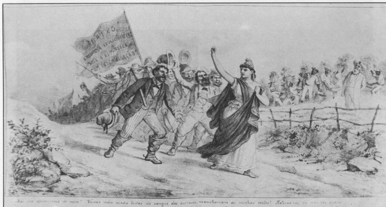
15. “Senhores de escravos pedem indenização à República”, Angelo Agostini, Revista Ilustrada, 9/6/1888.

Dentre as contradições no momento do estabelecimento da República cabe notar o desenho seguinte, retirado da Revista Ilustrada (1888). A charge representa a cobrança de senhores de escravos pedindo indenização à República pelas perdas que acabavam de sofrer com a abolição da escravatura. Observando a figura, publicada pouco antes da proclamação do novo regime, verifica-se que a figura feminina, clássica representação da República, encontrava-se numa posição nada nobre, pelo contrário, seria aquela encarregada de resolver todos os problemas que o império não conseguia dirimir. Outro aspecto a ser evidenciado é o de que a elite aristocrática brasileira, base produtiva do país, não colocou a República num altar , pelo contrário, ela ocupava o mesmo lugar que qualquer mortal comum. O mais significativo é que essas elites já pressionavam a pobre República antes mesmo de ela nascer , uma vez que esta charge é de 09/06/1888.