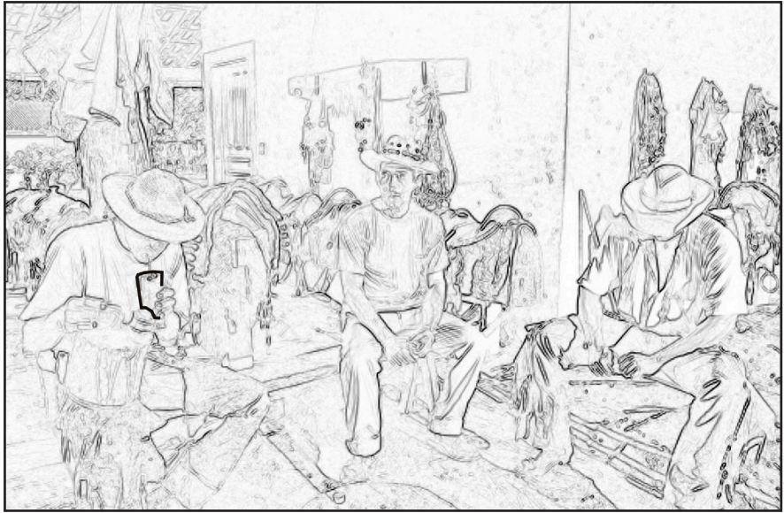
Roda de tereré.

“O tereré refresca el sangre e abranda el corazón.”