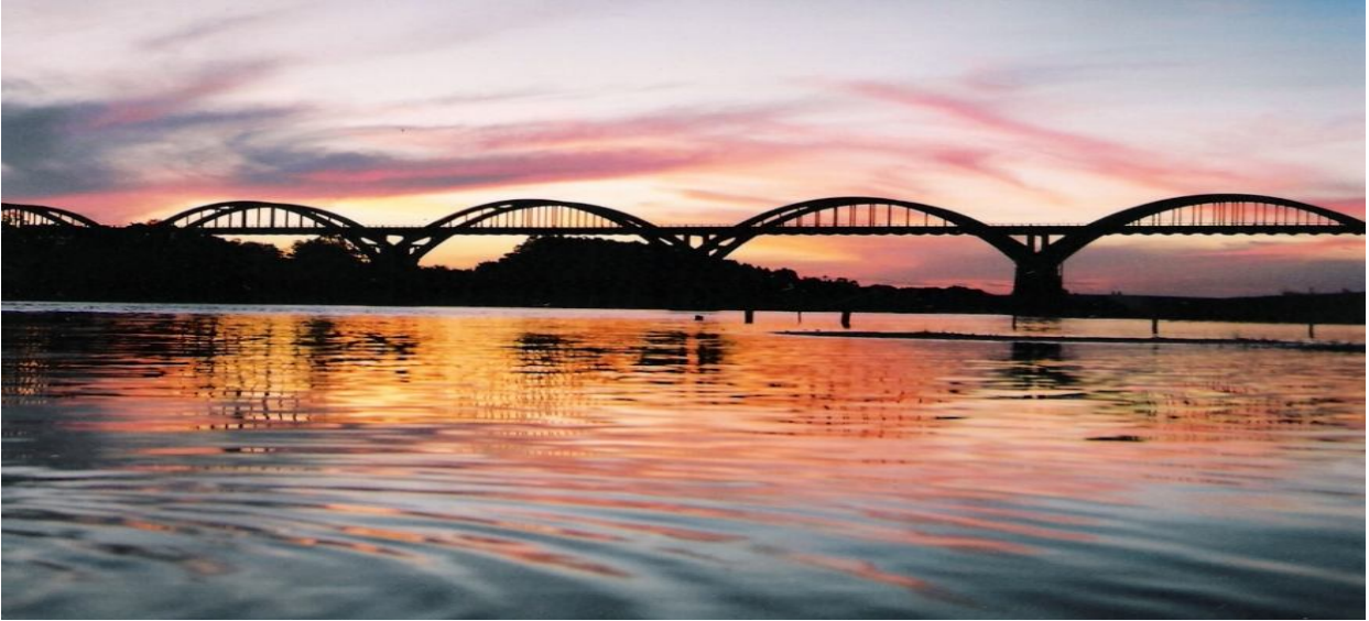
Vista da Ponte General Osório – Rio Ibicuí – Município de Manoel Viana. Maiores informações em: www.manoelviana.rs.gov.br

O município encontra-se vinculado à 10ª. Coordenadoria Regional de Saúde (10ª. CRS), localizada no município de Alegrete, sendo referência em saúde mental para o município de Manoel Viana, que encaminha usuários para sua rede de serviços psicossociais, além de utilizar os leitos psiquiátricos do Hospital Santa Casa, quando necessário.