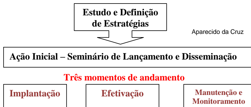
Figura 2. Organograma de implantação do programa.

Procurando adequar o plano aos ideais defendidos na Política Nacional de Segurança e Saúde no Trabalho, bem como nossas necessidades particulares, desenvolvemos o plano na seguinte ordem: