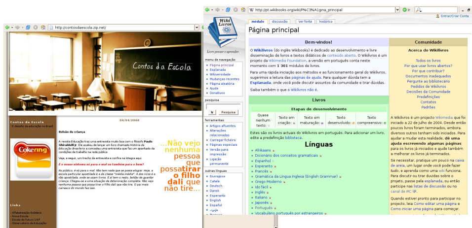
Figura 3 - Blog Conto da Escola e Wikibooks

Em países submetidos a ditaduras, os “ Blogs ” transformaram-se numa trincheira da liberdade de expressão. Na China, a Internet é vista como uma ameaça à ditadura comunista e os “ Blogs ” são a principal artilharia nessa guerra.