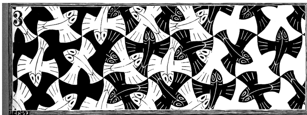
Figura 2- Escher, Woodcut II , strip 3.

Hofstadter (2007) utiliza uma definição para figuras cursivas e recursivas que é esclarecedora quanto aos limites tipográficos de tais sistemas. Essa definição se refere a possibilidade de que o fundo de uma figura possa ou não ser visualizado também como figura. Assim, quando só podemos ver figura na figura, ou seja, seu fundo não forma também uma figura, trata-se de uma figura cursiva. Mas se podemos também visualizar uma figura no que seria o fundo inicial da figura, como nos exemplos clássicos de figura-fundo estudado em aulas de gestalt , podemos chamá-la, seguindo Hofstadter, de figura recursiva, na qual abre-se a possibilidade de um movimento infinito de intercalar nossa atenção entre as figuras-fundo em cada momento de emergência. A figura 2 é um exemplo de figura recursiva.