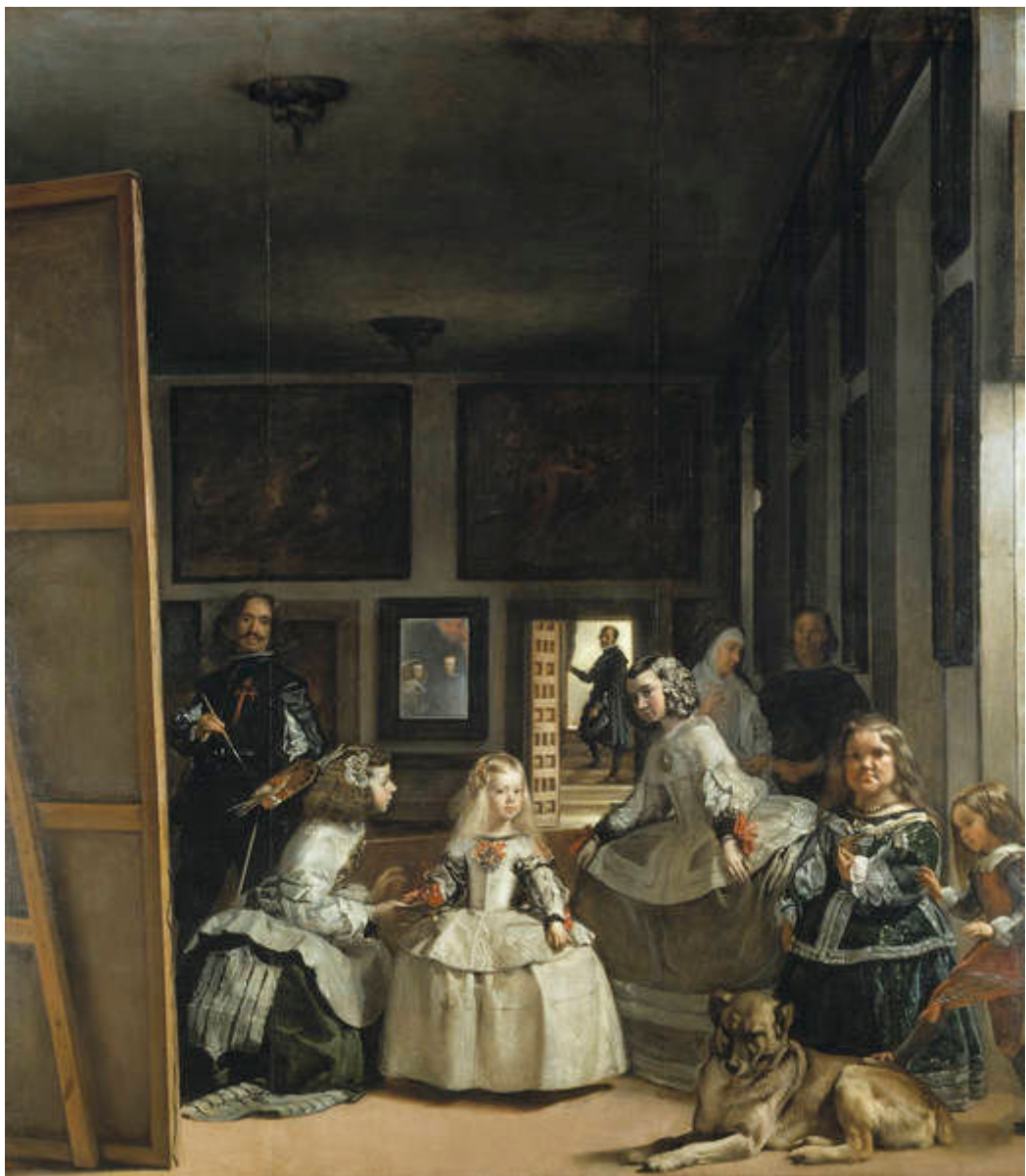
Figura 1: Las meninas , de Velázquez.

seus quadros explicativos tomou o centro da cena. Foucault (2007) analisa essa questão relacionada ao surgimento das ciências humanas, e toma o quadro Las meninas de Velázquez (figura 1) como paradigmático de uma mudança na maneira de conceber o conhecimento, que pode ser exemplificada pela posição do pintor no quadro, ou seja, o próprio Velázquez se encontra dentro do quadro e olha para a posição, fora do quadro, onde se encontra aquele que observa o quadro diante de si.