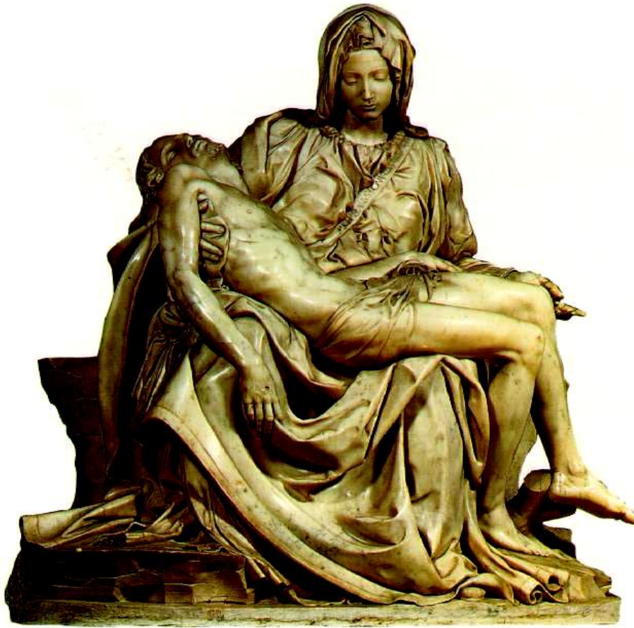
Figura 2 - Pietá de Michelangelo 5

No Direito romano, o herdeiro direto de toda a tradição judaico-cristã, o paterfamilias , que eram as leis que determinavam o estatuto jurídico do pai. Dá-se a este a autoridade e o poder absoluto. O pai próximo ou distante tem o direito de vida e de morte sobre o filho, seja criança, jovem ou adulto, isto é, no decorrer de toda a vida independentemente de quaisquer outras condições o pai é a autoridade a ser considerada. (HURSTEL,1999; MARKY,1995)