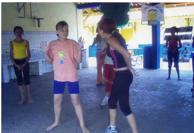
Figura: 10 – Ensaio – Construção dos gestos

Além do pato, vários alunos tinham outros personagens: o camaleão, a onça, a borboleta, o jabuti, as árvores encantadas e as flores encantadas. Então o trabalho se concentrou nos gestos que caracterizavam esses personagens, o que exigiu um trabalho muito intenso de pesquisa corporal (figura:10).