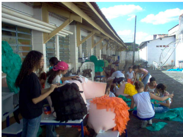
Figura: 6 – Confeção de cenário