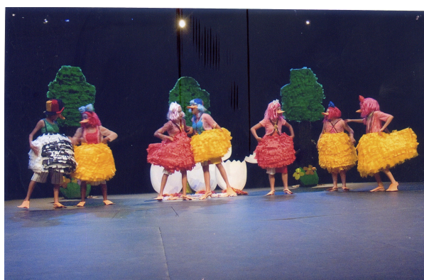
Figura: 3 – A História de Fruck