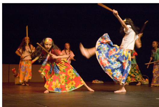
Figura: 5 – Quem te contava histórias?

Nos anos posteriores o grupo, também, participou de outras mostras e festivais que construíram o caminho percorrido. O grupo realiza apresentações na própria escola e em outras quando convidado.