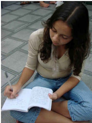
Figura: 12 – Escrita do protocolo

Os registros feitos pelos alunos nos protocolos eram comentados e debatidos no início de cada encontro do grupo, não sendo obrigatória a sua leitura. Os alunos destacavam, daquilo que haviam escrito (figura:12), um ou mais temas para um comentário oral no grupo (figura:13), e todos podiam comentar o tema abordado e expressar sua reflexão. Os debates ocorriam no início de cada ensaio, quando todos os integrantes do grupo, orientados pela professora, se sentavam em círculo no chão e conversavam sobre esses assuntos, além de outros como compromissos, conflitos e projetos do grupo.