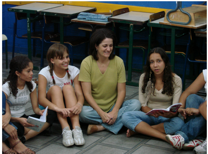
Figura: 13 – Destaque oral do protocolo escrito

Como já explicitado, a leitura dos protocolos não é obrigatória, cada um pode sentir-se à vontade para selecionar daquilo que escreveu o que gostaria de comentar (figura:14 e figura:15). Caso alguém não quisesse ler ou tecer comentários não era obrigado a fazê-lo. Dos alunos participantes da pesquisa 15 sempre liam os protocolos e 3 não o fizeram em nenhuma oportunidade, abstando-se sempre, apesar de ter escrito o protocolo. Nenhum aluno que lia o protocolo deixou de fazê-lo durante o processo. Dentre os alunos, 14 escreviam regularmente os protocolos e 4 o faziam com uma frequência menor.