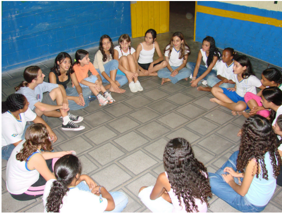
Figura: 14 – Debate dos protocolos