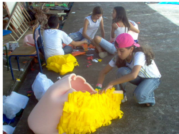
Figura: 7 – Confeção do figurino