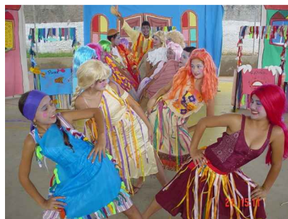
Figura: 2 – Meu Cordel Estradeiro