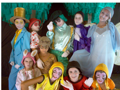
Figura: 4 – Quem casa quer casa ou não?