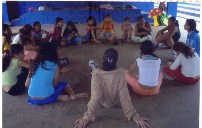
Figura: 15 – Debate dos protocolos

Assim, os protocolos apresentados no decorrer do processo de trabalho proporcionavam aos integrantes do grupo, além da recuperação dos processos desenvolvidos no encontro anterior, também momentos de reflexão coletiva, pois todos tomavam conhecimento dos relatos das experiências estéticas vividas, dos pensamentos e dos movimentos internos de cada um, afetando uns aos outros com suas análises e descobertas. É pois, nos protocolos de cada aluno que colheremos os escritos que serão analisados para a compreensão dos processos que concorrem na constituição de si de cada aluno. Para isso, é antes imprescindível a compreensão das questões ligadas à Ética.