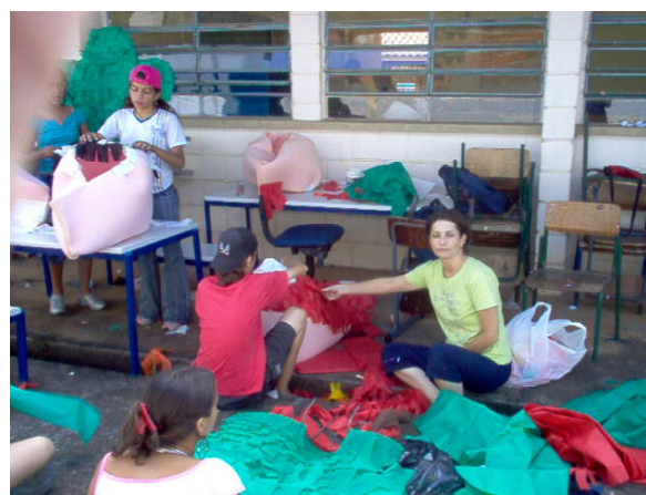
Figura: 9 – Confeção dos objetos de cena

Os custos da confecção do cenário, figurinos, objetos de cena e maquiagem é mantido pela escola, permitindo que todos os alunos possam participar sem ônus para suas respectivas famílias. Em 2003, a escola custeou a montagem e a partir de 2004 e nos anos subsequentes, o grupo entrou para os projetos da Secretaria de Educação do Estado de São Paulo e assim tem recebido uma verba destinada à continuidade do projeto, valores que ficam entre 5 a 8 mil reais.