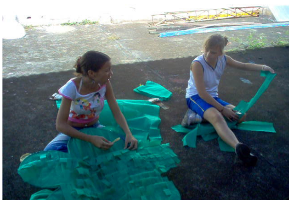
Figura: 8 – Confeção das árvores encantadas