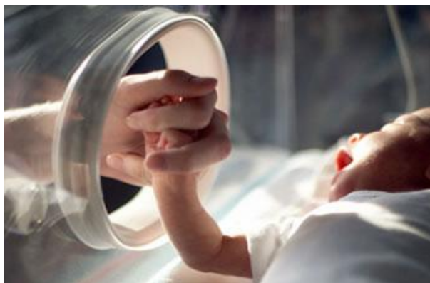
Figura 1: Ilustração mãe e bebê

Para além das questões que instigaram esta pesquisa, espero contribuir com a interlocução entre a psicanálise e o campo da enfermagem, cada vez mais técnica e correndo o risco de perder a sensibilidade para as questões subjetivas dos sujeitos que necessitam de seus cuidados.