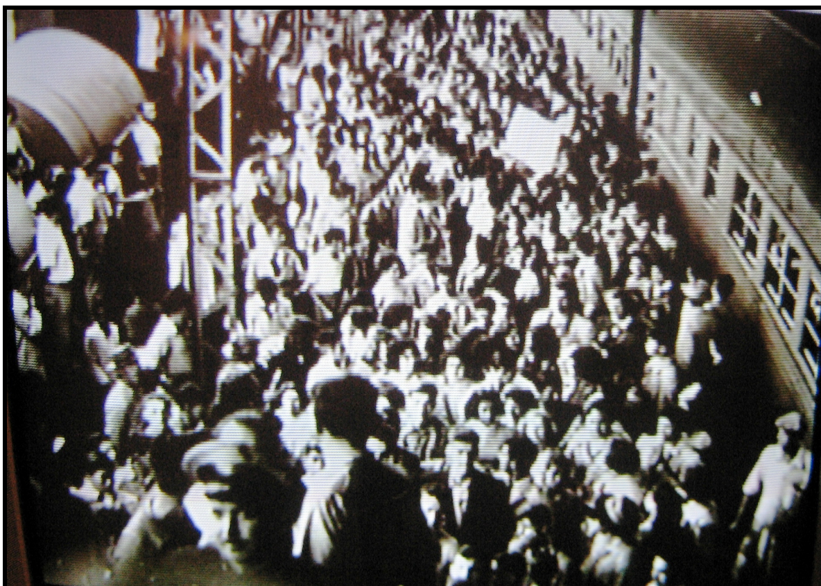
Festa de recepção na Estação Rodoviária, na chegada de delegação que havia retornado dos Jogos Abertos do Interior em Ribeirão Preto em 1952. (Acervo Projeto História do Esporte de Sorocaba).

A equipe de basquetebol de Sorocaba era uma das favoritas ao título, mas no confronto entre Sorocaba e Ribeirão Preto, cidade sede, houve um grande tumulto e a equipe de Sorocaba teve que fugir do Ginásio Cava do Bosque e ir embora de caminhão. Os membros da Delegação se reuniram e decidiram que Sorocaba deveria se retirar dos jogos em todas modalidades. Apesar disso e para grande surpresa foram recebidos com uma grande festa em Sorocaba, na volta da delegação.