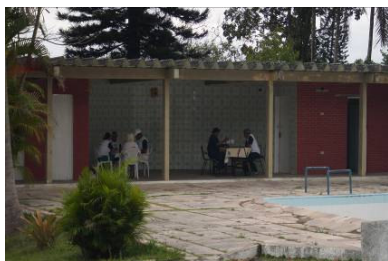
FIGURA 9 Idosos jogando cartas nas imediações do Centro de Convivência.