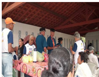
FIGURA 3 Venda de lanches pelos idosos