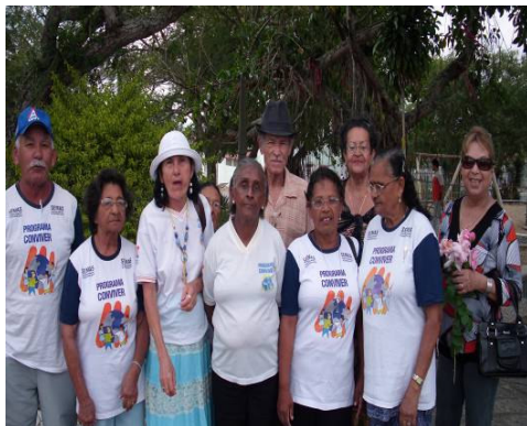
FIGURA 1 Imagem dos idosos na Praça do Trabalho

A imagem acima marca um desses momentos de encontro na Praça do Trabalho, os idosos começam a chegar a partir das 07 horas da manhã para esperar o ônibus, que sai rumo ao Centro de Convivência às 08 horas. Durante esse intervalo de espera as (re)apropriações e a produção de sentidos acontecem. Os idosos que chegam cedo se sentam nos bancos da Praça e as conversas começam a fluir, na maioria das vezes são conversas sobre o cotidiano e sobre os problemas da vida.