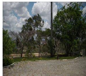
FIGURA 6 Jardim

As figuras acima são imagens dos espaços do Centro de Convivência e dos múltiplos usos e suas (re)significações, cartografias da cotidianidade reveladas por gestos, práticas,