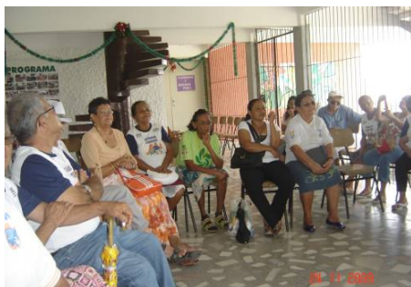
FIGURA 19 Idosos na oficina de memórias

As experiências infantis trazidas por meio das memórias afetivas dos idosos nos possibilitam investigar esse cenário cambiante e plural. Adentremos imaginariamente o cenário de rememoração constituído durante a realização das oficinas de memórias desenvolvidas por nós no Centro de Convivência. Forma-se um círculo, os idosos ajeitam-se timidamente nas cadeiras, alguns sobressaltos e hesitações se instalam no ambiente, a ânsia de começar a narração das experiências infantis invade os corpos inquietos, uma inquietude refletida nos cochichos e nos silêncios provocados pelo instante que espreita as histórias reveladoras de sentidos e cores. Um dos participantes pede para começar, inicia-se, portanto, a partilha das representações de infância tecidas pelas narrativas desses sujeitos idosos.