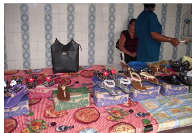
FIGURA 11 Comercialização de calçados

Tomando como ponto de análise os discursos desses idosos, inferimos que a maioria deles teve uma vida difícil durante as outras etapas da vida, a infância fora marcada pelo trabalho pesado, na maioria dos casos na roça, a idade adulta fora o momento das responsabilidades com a família, filhos, casa, um tempo específico para as práticas de lazer inexistia, sucumbia ao mundo das obrigações, o qual ainda se revela para muitos idosos, que têm no ambiente doméstico uma rotina de responsabilidades. As obrigações da vida adulta acompanham alguns desses idosos participantes do Centro de Convivência, sejam os que