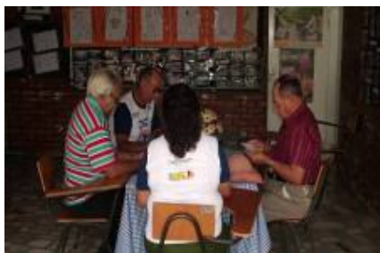
FIGURA 8 Idosos jogando “pif paf”

A reunião desse grupo de idosos jogadores começa bem antes da chegada no Centro de Convivência, começa quando os membros desse grupo vão chegando à Praça do Trabalho para esperar o ônibus. Eles esperam jogando, se afastam dos outros idosos e começam a jogar. O jogo de cartas, nesse cenário, se configura em uma prática de lazer bastante apreciada por esses idosos, o favoritismo pelas cartas é latente, não é à toa que esses idosos começam seus jogos antes da chegada ao Centro de Convivência e só terminam quando as atividades se encerram, são grupos que partilham dos mesmos interesses na prática do tempo livre, o “prazer do jogo”, configurado enquanto um sentimento que é coletivamente compartilhado. Os sentimentos de prazer que vêm à tona durante os momentos que os idosos se encontram com a finalidade de jogar cartas oferecem aos participantes inúmeras possibilidades de vivenciarem emoções perdidas ao longo de suas vidas, as quais emergem no instante em que a mesa se compõe e as cartas são distribuídas; nesses instantes o espaço é tomado pelo divertimento e pela alegria de estarem juntos compartilhando os signos da liberdade e da autonomia presentes nas suas escolhas.