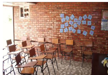
FIGURA 4 Espaço escolar