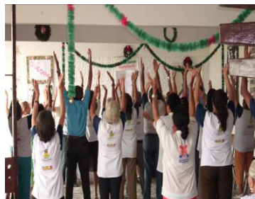
FIGURA 13 Idosos na Educação Física

Sua atuação no Centro de Convivência acontece em conjunto com os médicos geriatras, e enfatiza que seu trabalho é realizado no sentido de adaptar as atividades físicas à realidade dos idosos, com o objetivo de não prejudicar a saúde e assim poder contribuir de forma salutar.