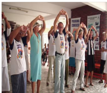
FIGURA 12 Idosos na Educação Física

pelo profissional que está conduzindo a atividade “trabalhar com idosos na Educação Física precisa ter um conhecimento das patologias [...], sempre trabalhei com crianças e adolescentes, mas eu sempre quis trabalhar com idosos e para isso fiz cursos de Geriatria e Gerontologia.” 30