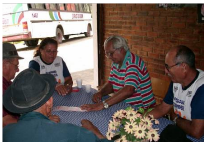
FIGURA 7 Idosos Jogando “pif paf”