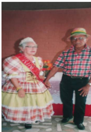
FIGURA 16 Grupo de dança das festas juninas

Enquanto existir o marmeleiro Xique-xique e juazeiro Vou ficando por aqui Enquanto existir a rapadura E uma cachaça pura Vou ficando por aqui Enquanto tiver a carne de bode A água fria do pote Vou ficando por aqui E a sombra de uma baraúna E o canto de um craúna Vou ficando por aqui