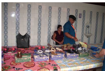
FIGURA 5 Venda de calçados pelos idosos