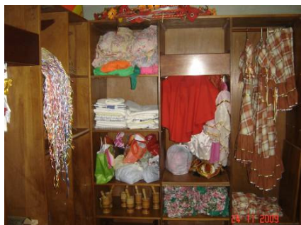
FIGURA 15 Roupas dos grupos de danças

Essa preparação para as festividades também atinge os homens, que vivenciam intensamente os momentos da dança, e se produzem fisicamente para as apresentações. O grupo de dança preferido da maioria dos homens é o grupo das festas juninas, os ensaios são