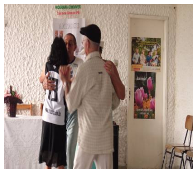
FIGURA 17 Idosos dançando Forró