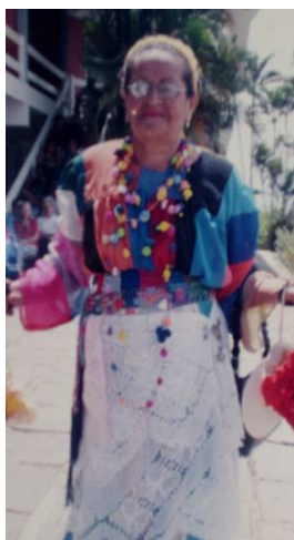
FIGURA 14 Idosa em momento festivo

Os corpos se produzem para a dança. Em dias anteriores às apresentações dos grupos de danças, essas mulheres se investem de uma preparação física e simbólica, as roupas são confeccionadas para esses momentos singulares, maquiagem e bijuterias também fazem parte desse cenário de arrumação. São mulheres que descobrem o prazer no cuidado de si, no cuidado do próprio corpo para vivenciarem essas experiências festivas.