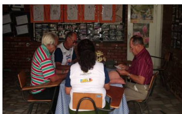
FIGURA 2 Idosos jogando cartas

cozinha e um espaço onde funciona um refeitório. Esses espaços são ocupados pelos idosos de diversas maneiras, muitos utilizam o refeitório quando esse não está sendo usado para as refeições, para vender artefatos, calçados, lanches, usam também para conversar, cantar e tocar, bem como para jogar cartas. Outros idosos usam o espaço da escola quando não estão em horários de aula, para conversar e jogar, enfim, os espaços ganham novas funcionalidades através das (re)significações que são feitas de acordo com os interesses momentâneos dos idosos.