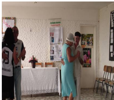
FIGURA 18 Idosos dançando Forró

A cartografia delineada pelas subjetividades dançantes não se restringe apenas aos momentos de atividades institucionais pensados pela equipe responsável do Centro de Convivência, há ainda os momentos de dança criados pelos próprios idosos, que experienciam e compartilham o mesmo gosto pelo estilo musical: forró, o dançar a dois, agarradinhos, em passos determinados pelos ritmos das músicas. Na configuração desse cenário não há uma preocupação por parte dos sujeitos idosos na demonstração de performances 35 , os passos que são executados para a realização das danças não seguem um ritmo formal, não há regras sistematizadas que determinem uma singularidade na forma de dançar o estilo forró no Centro de Convivência, são os passos aleatórios que moldam os ritmos desses sujeitos.