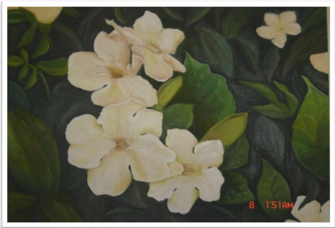
Produção pictórica 6: “Os primeiros Hibiscos” (2008)