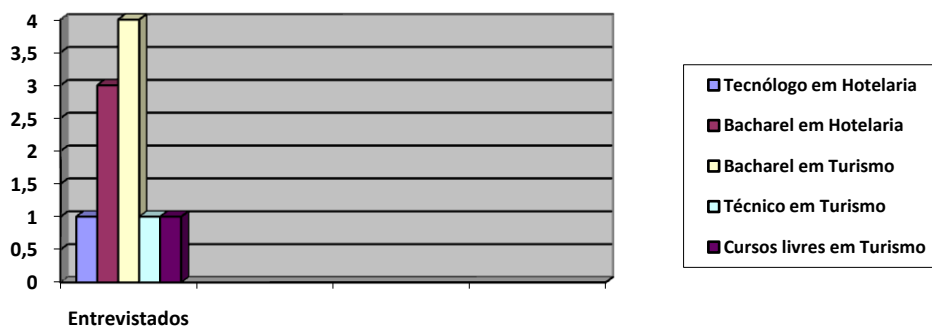
Gráfico 3: Número de entrevistados quanto a Formação Acadêmica