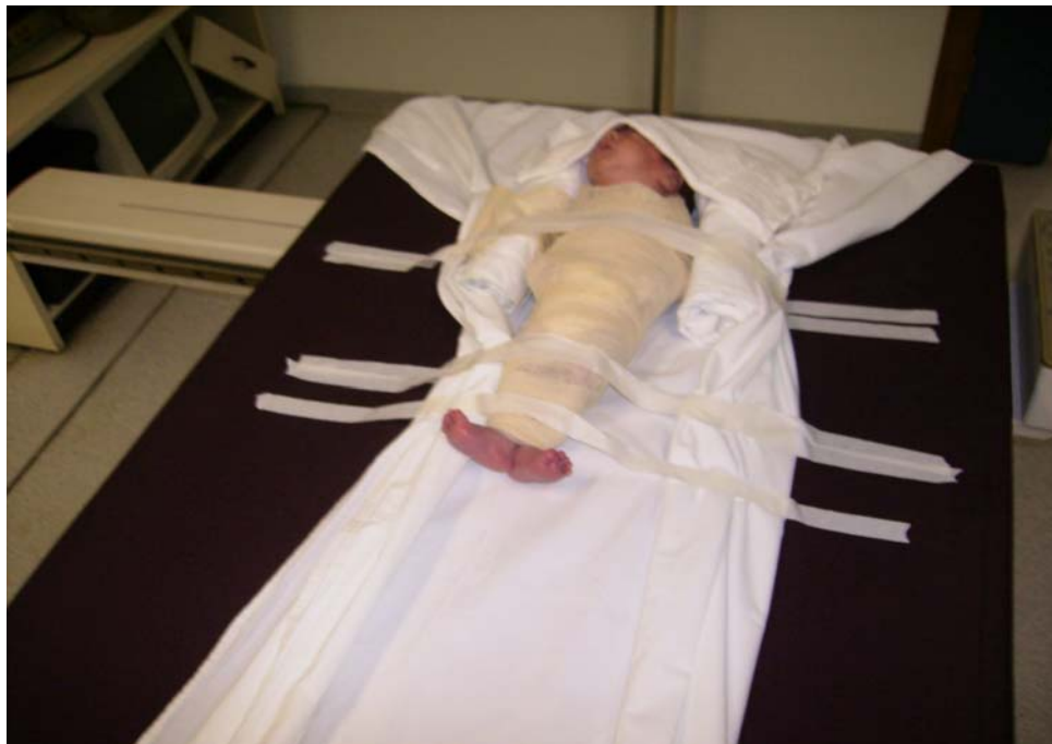
Figura 1 - Recém-nascido pré-termo posicionado durante a densitometria óssea

recém-nascidos pré-termos envolvidos na própria UTI Neonatal com ataduras de crepe, de maneira a cobrir todo o corpo (figura 1), sem comprometer a expansibilidade torácica, com o cuidado de manter o saturômetro de transporte ligado no pé, para controle da frequência cardíaca e saturação desde a saída até o seu retorno para a UTI Neonatal. Os pré-termos foram acompanhados pela técnica de enfermagem e pelo médico pesquisador durante todo o tempo.