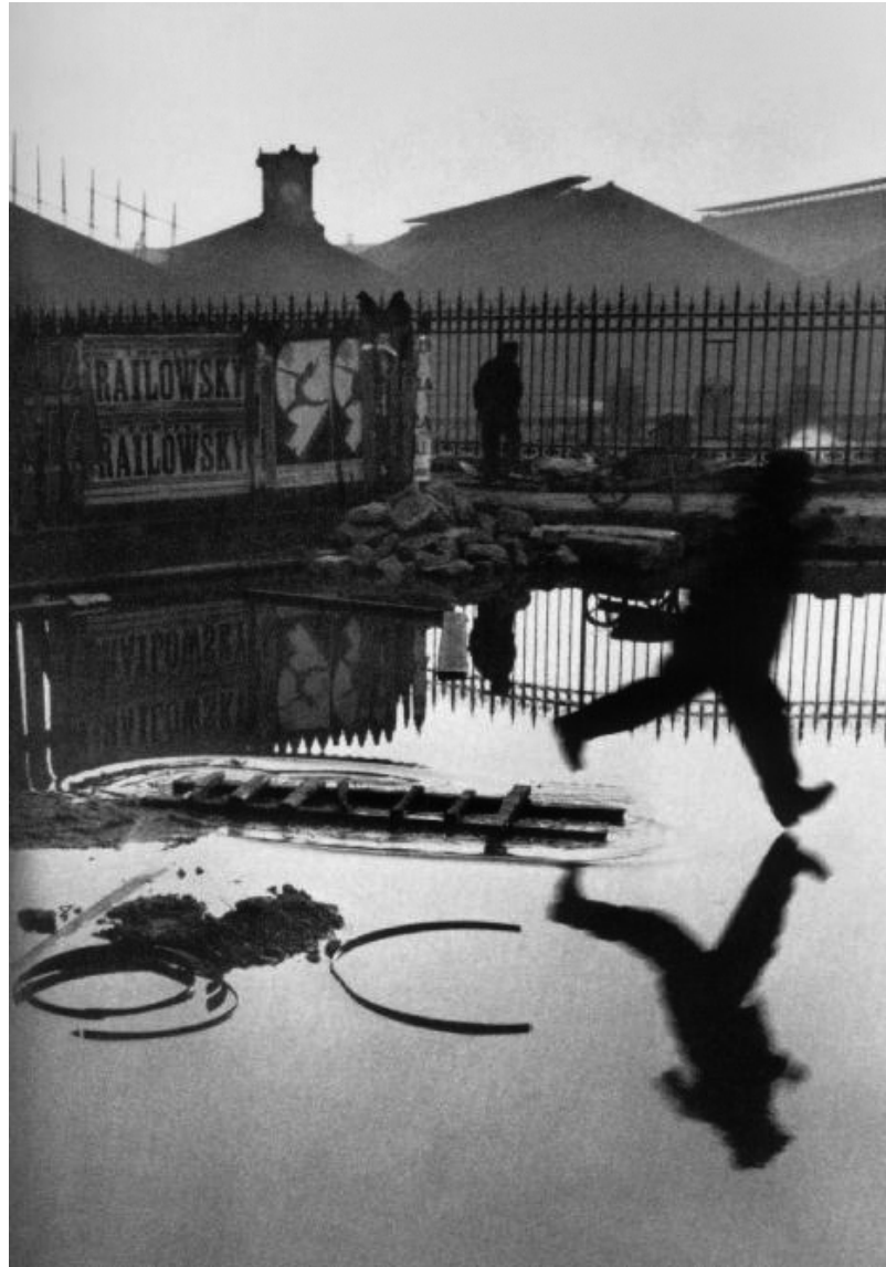
Figura 2 2

A foto tem uma composição harmoniosa, mas o que fica muito evidente é que quando se olha o homem, vê-se claramente que está se deslocando, enquanto toda a cena parece estática.