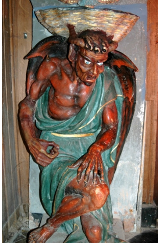
Figura 4 4

signe tu le vaincras " – Por este sinal você o derrotará/conquistará/superará (PUTNAM; WOOD, 2005, p. 115). A frase denota todo o poder de salvação do batismo: ao tornar-se filho de Deus, a mancha do pecado original é apagada e a presença do demônio é recusada.