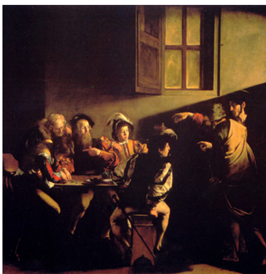
Figura 1 1

Uma cena qualquer pode apresentar vários pontos de luz de diferentes intensidades. Isso é perceptível nas pinturas de Caravaggio (Figura 1).