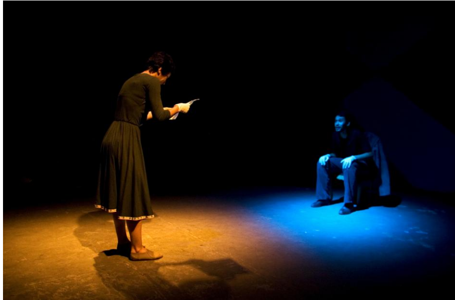
Figura 03 – Cena “Falsa Ocorrência”