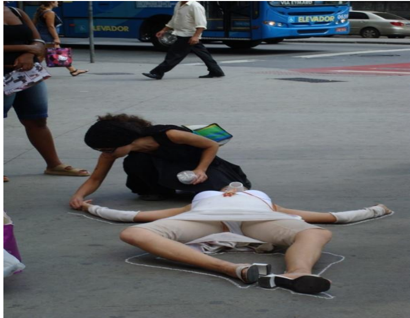
FIGURA 09: “A Cidade das Mortas”