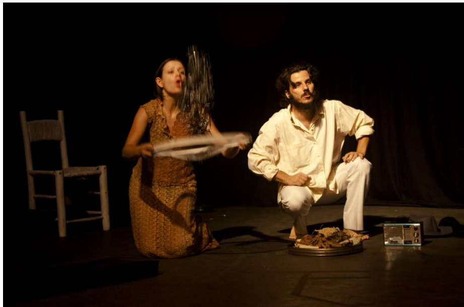
Figura 02 – Cena “Essência”