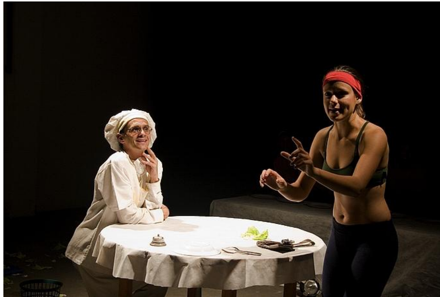
Figura 04 – Cena “Estado de Coma”