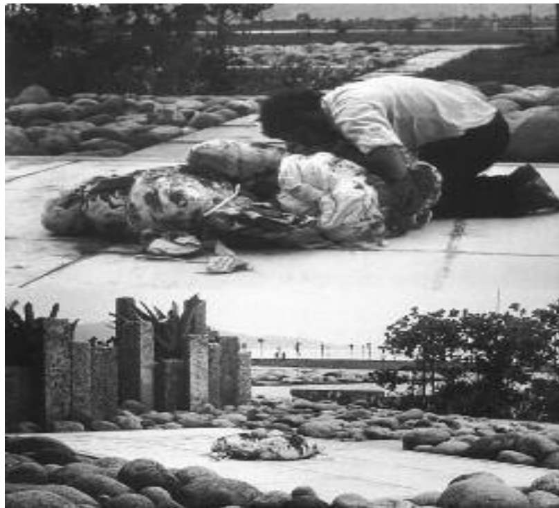
FIGURA 06 – Troupas ensanguentadas