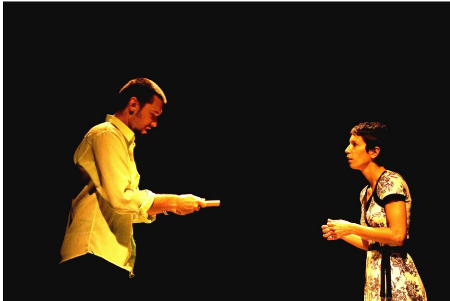
Figura 01 – Cena “Diálogo Interrompido”