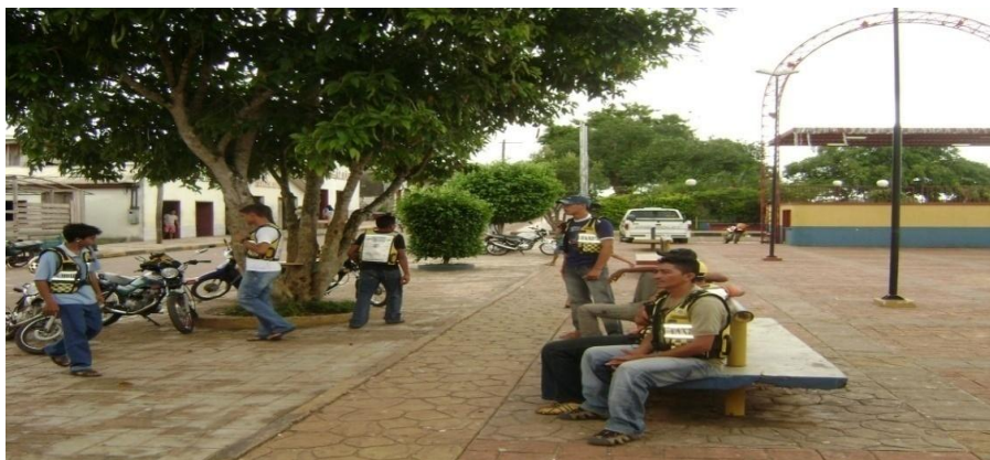
Fonte: Jordeanes Arajo, 2009. Figura 2, Praa Edilson Herculano em Ipixuna-Am.

Semelhante espao de socialidade encontramos em Ipixuna.  interessante perceber que em cidades de pequeno porte as praas funcionam como o principal ambiente de socialidade da populao, em grande medida pela ausncia de outros espaos. Assim, em Ipixuna encontramos tambm uma praa, localizada s margens do rio Juru. Porm, como ali existe uma praa de alimentao, situada nas proximidades do centro comercial da cidade, a ateno dos moradores se divide em ambos os espaos (figura 2).