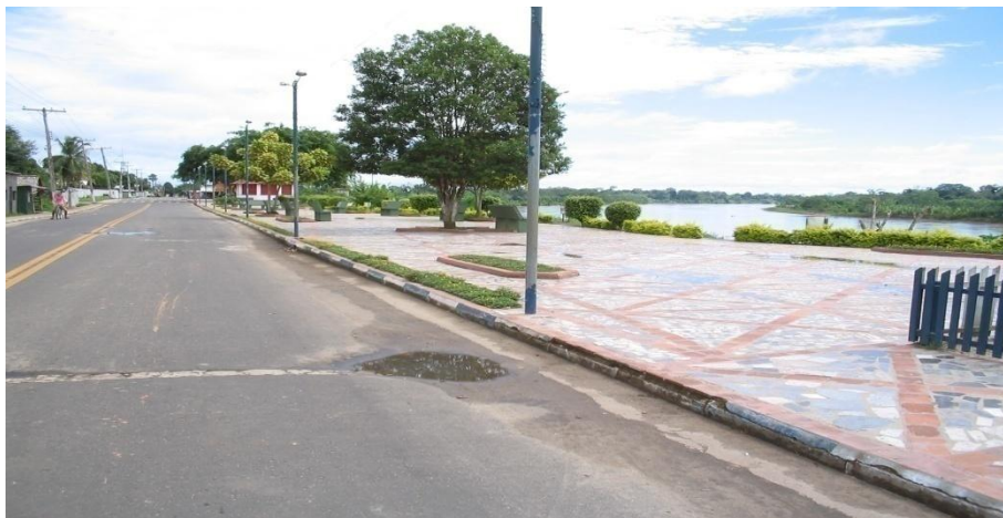
Fonte: Jordeanes Araújo, 2006, Figura 1, Praça da Saudade em Guajar-Am.

Semelhante espao de socialidade encontramos em Ipixuna.  interessante perceber que em cidades de pequeno porte as praas funcionam como o principal ambiente de socialidade da populao, em grande medida pela ausncia de outros espaos. Assim, em Ipixuna encontramos tambm uma praa, localizada s margens do rio Juru. Porm, como ali existe uma praa de alimentao, situada nas proximidades do centro comercial da cidade, a ateno dos moradores se divide em ambos os espaos (figura 2).