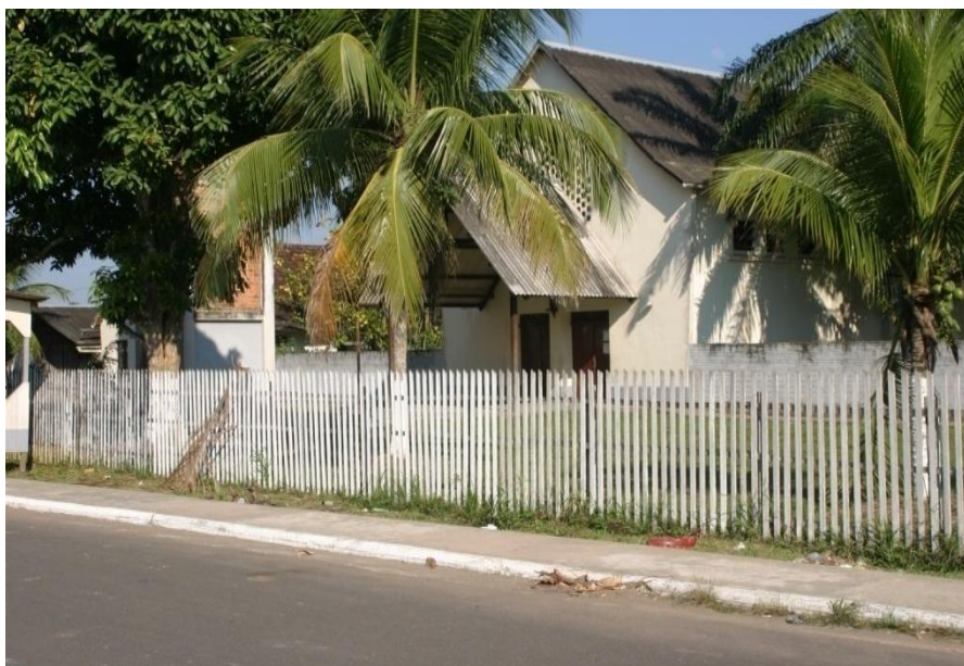
Figura 3, Igreja de São Francisco de Assis.