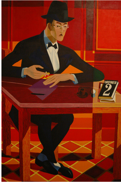
Pessoa, em pintura de Almada Negreiros

É isto a poesia, cantar sem música. Fernando Pessoa