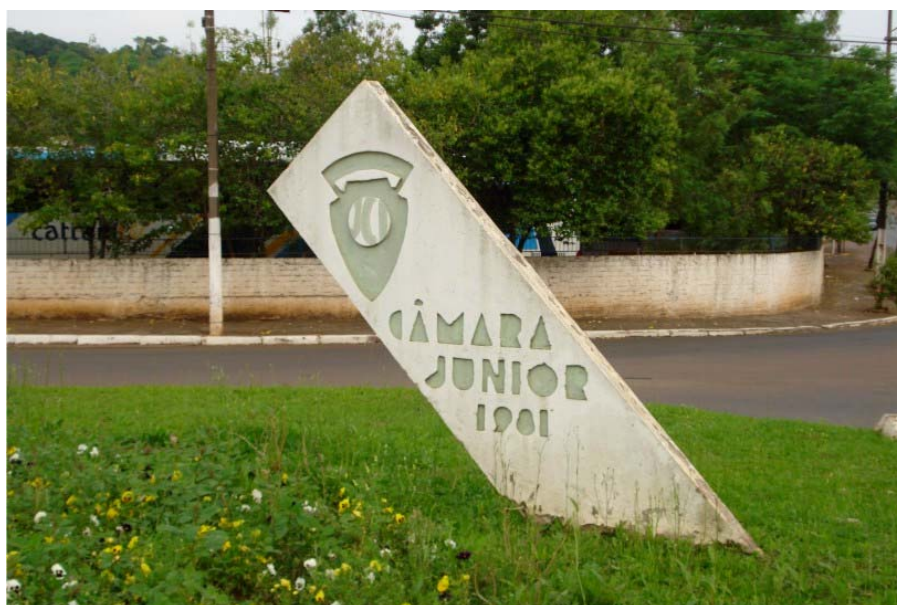
FOTO A.1.13 - PLACA DA CÂMARA JUNIOR