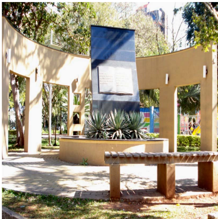
FOTO A..12 - MONUMENTO À BÍBLIA