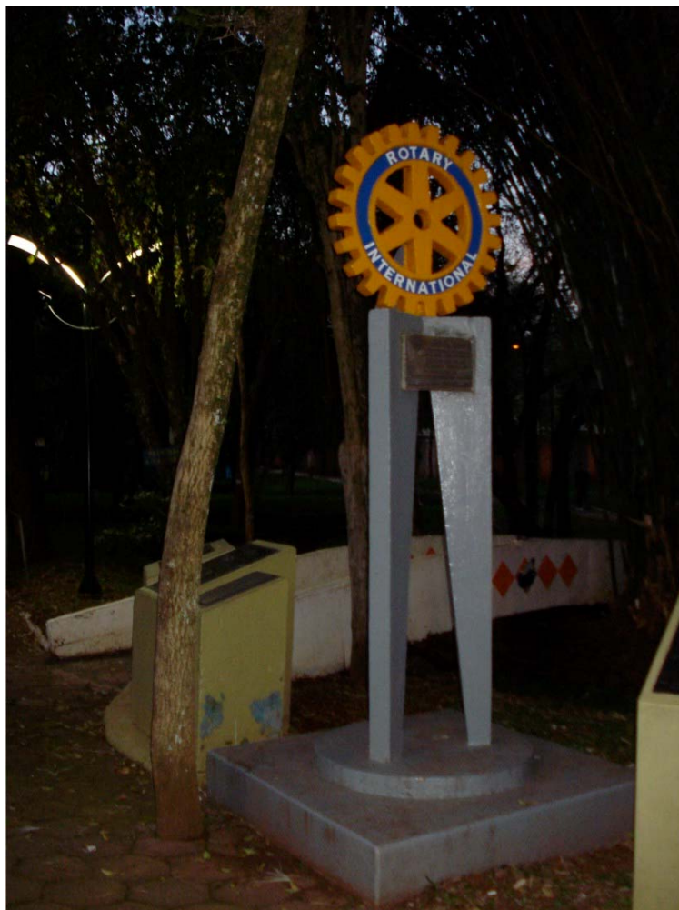
FOTO A.1.7 - MONUMENTO DO ROTARY EM HOMENAGEM AOS PROMOTORES E COLABORADORES DA I FESTA NACIONAL DO FEIJÃO (FENAFE) E I EXPOSIÇÃO REGIONAL AGROPECUÁRIA