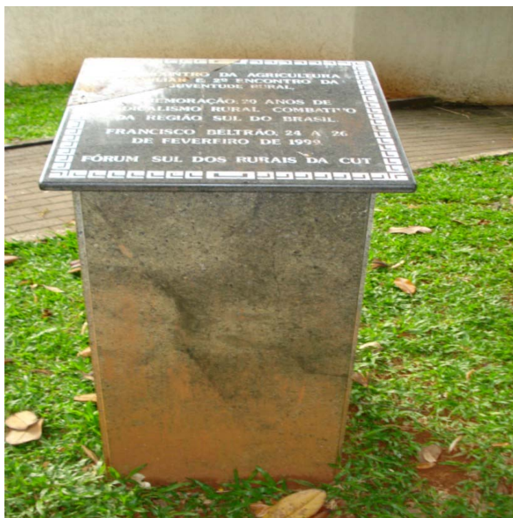
FOTO A.1.3 - MARCO DO 3.º ENCONTRO DA AGRICULTURA FAMILIAR E SEGUNDO ENCONTRO DA JUVENTUDE RURAL