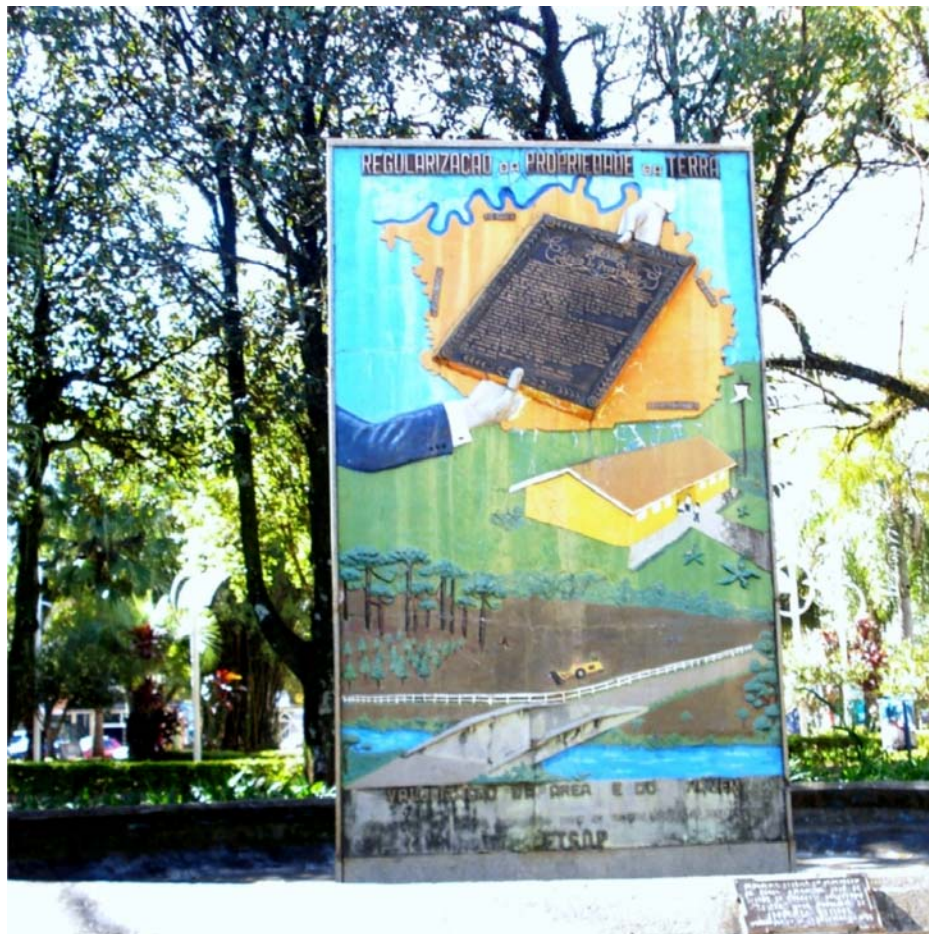
FOTO 3 - MONUMENTO AO GETSOP - FACE 01 FONTE: A autora, 17 jul. 2008

Este segundo monumento da nossa análise, reporta-se ao trabalho realizado pelo órgão específico, de regularização da posse em Francisco Beltrão e região. É denominado monumento ao GETSOP.