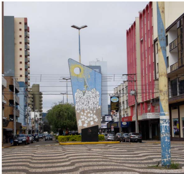
FOTO 6 - MONUMENTO "REVOLTA DOS POSSEIROS - 50 ANOS"

Neste monumento podem ser lidas as representações que traduzem a importância histórica, tanto pelo texto que apresenta em seu corpo, como pelo local que foi construído estrategicamente. O local marcado é onde os revoltosos se concentraram no ano de 1957, e se localiza em frente a antiga Rádio Colmeia, que transmitia o cotidiano da revolta e a atenção, a importância dos sujeitos envolvidos. O painel mede 7,83 metros de altura e pesa, aproximadamente, cinco mil quilos. Confeccionados, numa das faces, mosaico em pastilhas de vidro de 2x2cm, nas duas faces totalizando 32,40m 2 de pastilha sobre a placa de concreto armado, com base de 1,50m x 1,30m x 0,45m com revestimento em granito preto polido. 101 O monumento foi a IX atividade da programação em comemoração ao cinquentenário do levante dos posseiros, desenvolvidas de outubro de 2006 a dezembro de 2007. O evento movimentou segmentos artísticos e culturais da região, gerando atividades como palestras, escolha da logomarca cinquentenário da revolta; concurso de literatura; peças teatrais; produção de vídeo de depoimentos, entrevistas de pioneiros beltronenses que participaram ou presenciaram o levante de 1957 e exposição fotográfica no calçadão central da cidade.