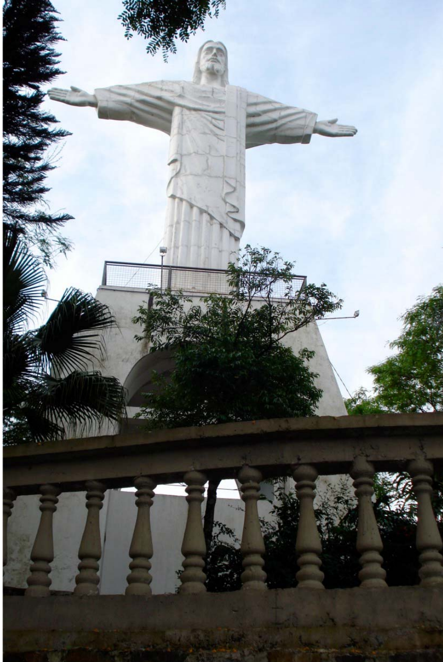
FOTO A.1.9 - CRISTO REDENTOR