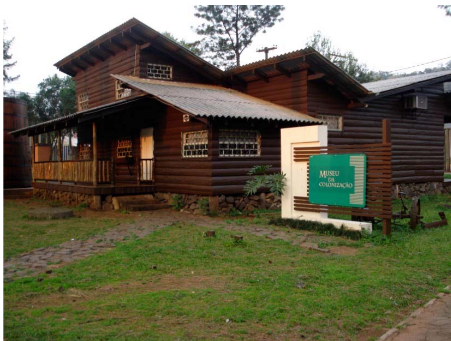
FOTO A.1.12 - MUSEU DA COLONIZAÇÃO