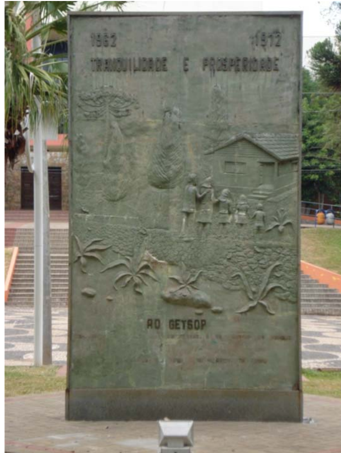
FOTO 4 - MONUMENTO AO GETSOP- FACE 2

Do lado oposto, foto 4, que fica com a imagem para o interior da Praça Suplicy, é possível ver claramente o homem do campo, sua família e a tão sonhada casa. Ao lado novamente as araucárias, forte símbolo paranaense. Destacam-se nesta imagem, segundo a visão do GETSOP, três caracterizações: uma delas é o simbolismo da casa, a mensagem de prosperidade e tranquilidade como uma forma de acalmar os ânimos frente a qualquer incitação sobre questionamento da ordem vigente. A segunda descrição da imagem que chama a atenção é a homenagem ao GETSOP, órgão de conjugação do governo federal com o estadual. O GETSOP, que era um grupo com o compromisso de tentar regularizar a terra, não deixa de ser um braço do estado, representando os interesses governamentais. O surgimento dele somente foi possível devido ao fato da disputa pela terra, da inoperância do governo em resolver antecipadamente uma disputa entre os posseiros e as companhias, que acabou saindo do controle. Fato esse, diga-se, provocado pelo descaso que em