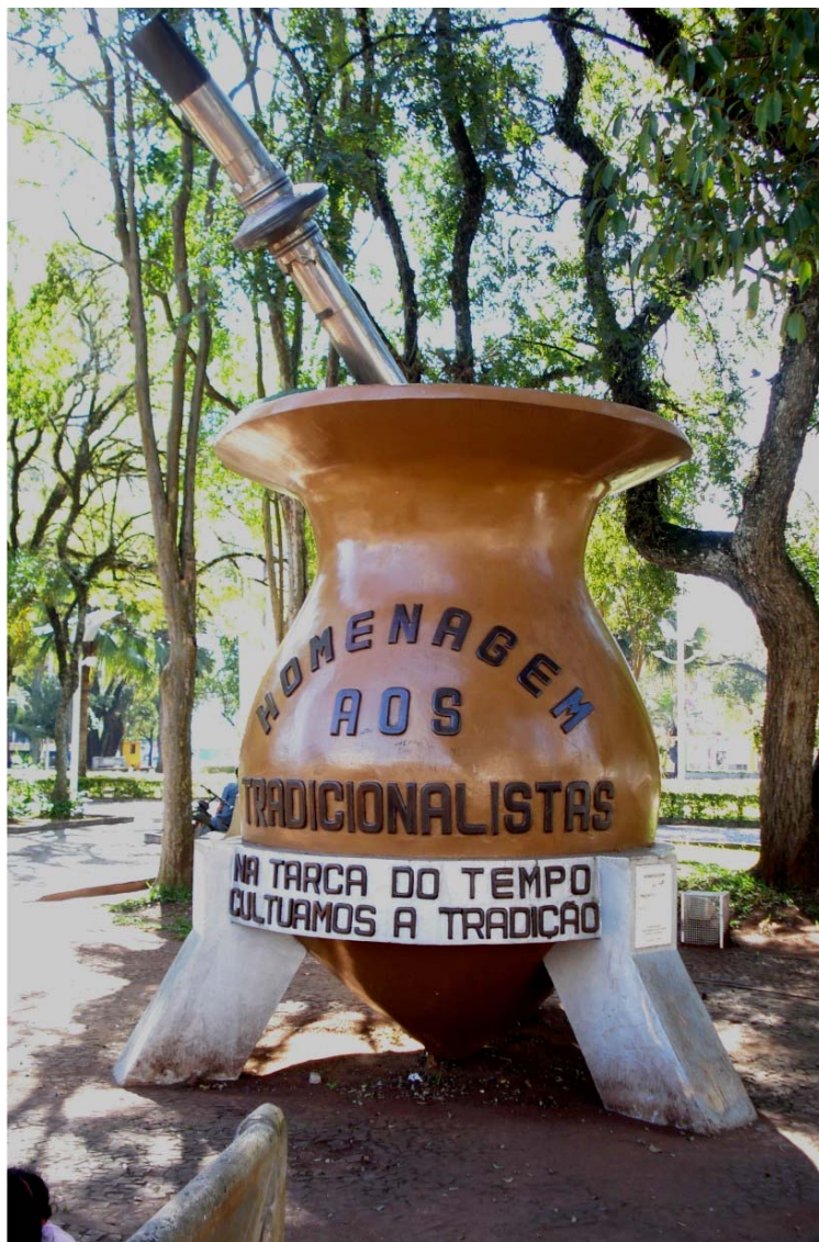
FOTO A.1.1 - CUIA DE CHIMARRÃO GIGANTE