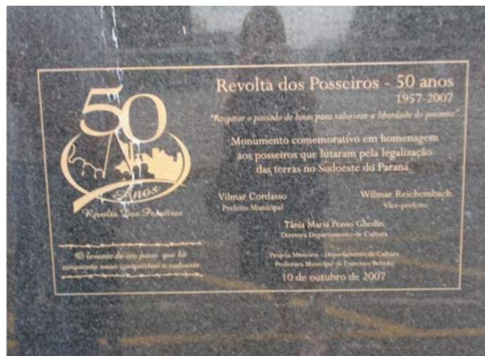
FOTO 7 - PLACA QUE COMPÕE A BASE DO MONUMENTO

É a luta pela terra e o aparentemente desfecho vitorioso dos agricultores e comerciantes que está impregnando e constituindo a memória que se quer perpetuar no primeiro monumento analisado, Monumento do Cinquentenário da Revolta.