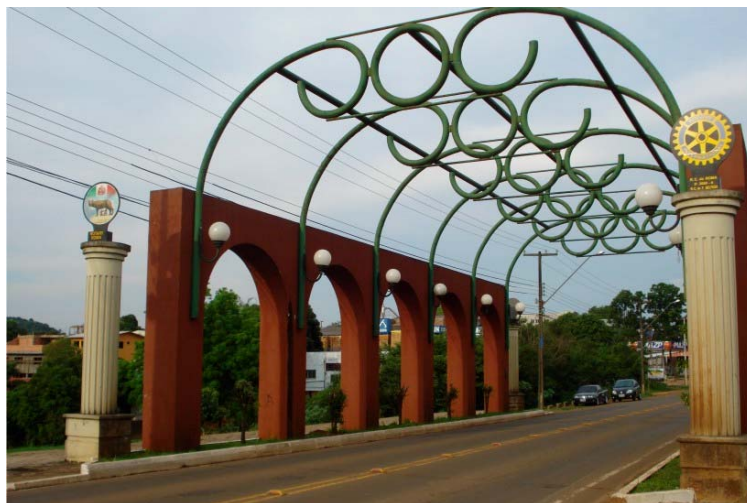
FOTO A.1.8 - PORTAL ITALIANO