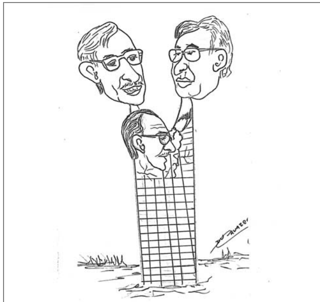
FIGURA 1 - CHARGE REFERENTE AO OBELISCO 1969 (Autor desconhecido)

A obra arquitetônica, representada na foto 2, página 76, nem de longe lembra a saga dos primeiros colonos, que desbravaram a região, e que deram origem a diversas cidades no sudoeste do Paraná. A intencionalidade aparece em uma placa fixada em sua estrutura onde diz que homenageia os colonos pioneiros das terras do sudoeste.