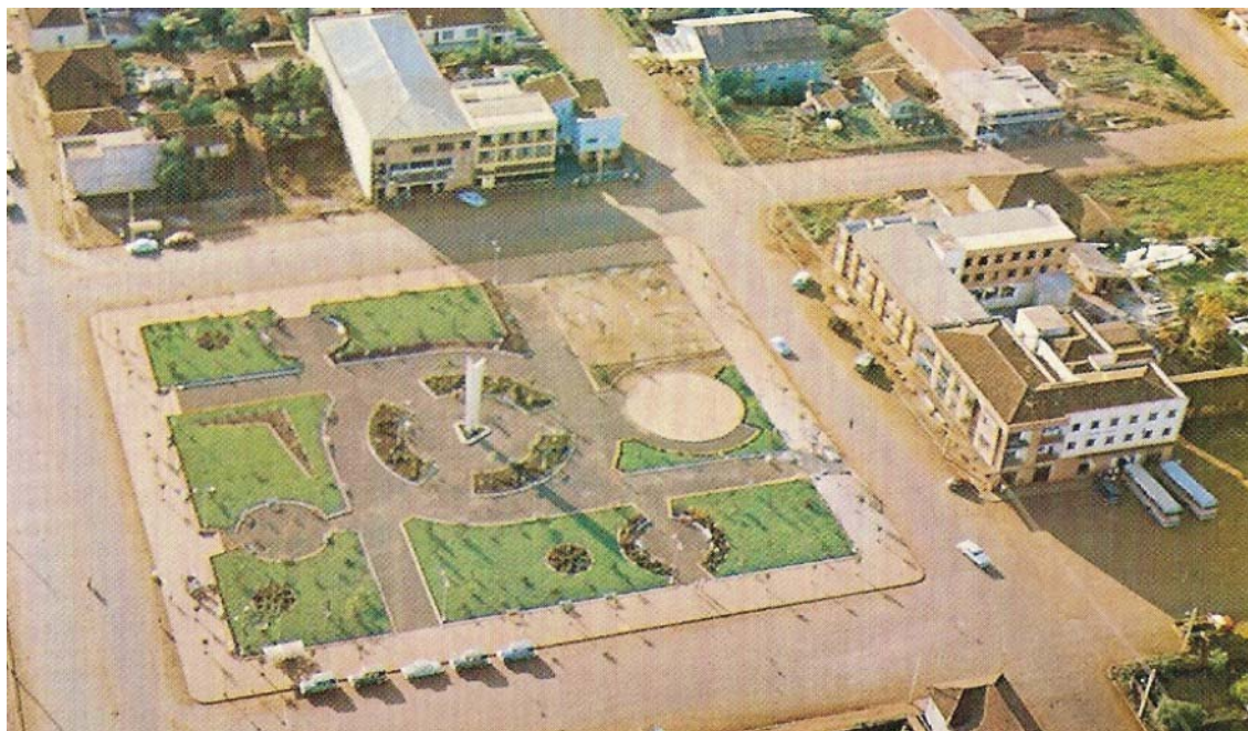
FOTO A.2.1 - PRAÇA DR. EDUARDO VIRMOND SUPLICY - 1970