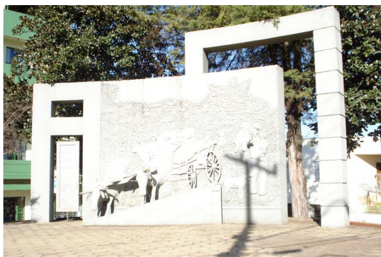
FOTO A.1.5 - O MONUMENTO AO PIONEIRO