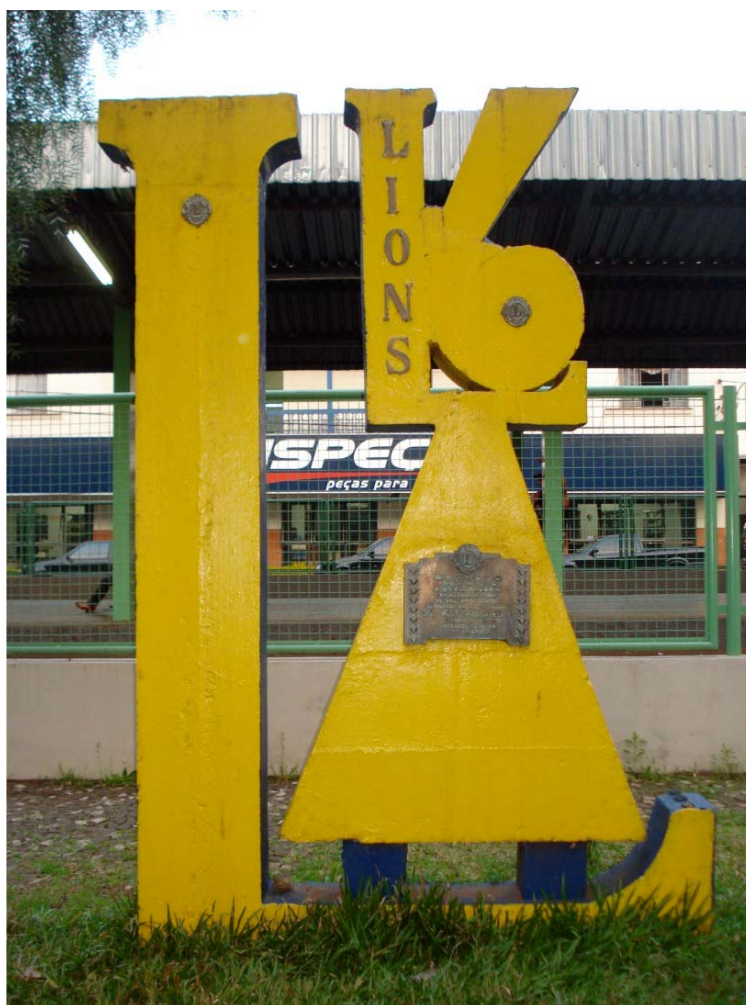
FOTO A.1.15 - MONUMENTO DO LIONS