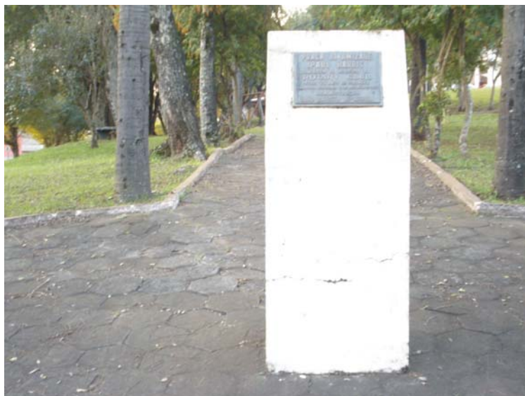
FOTO A.1.14 - PLACA DA PRAÇA DA AMIZADE