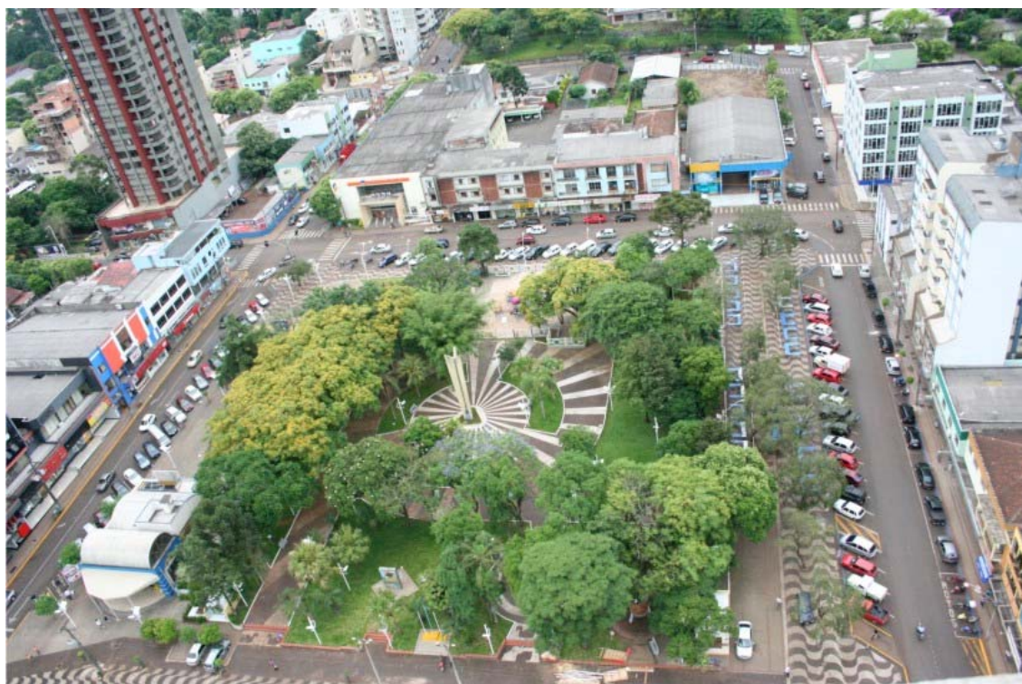
FOTO A.2.2 - PRAÇA DR. EDUARDO VIRMOND SUPLICY - 2009