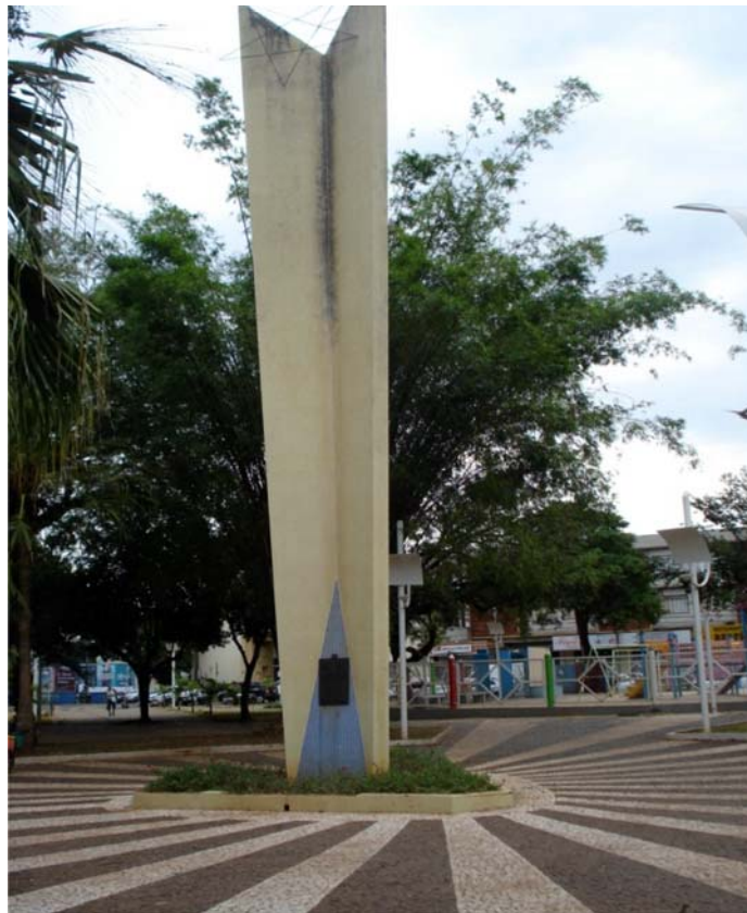
FOTO 2 - OBELISCO INAUGURADO EM 1969 FONTE: A autora, 13 mar. 2010

O primeiro monumento – o Obelisco - que integra nossa análise foi inaugurado em 1969. O motivo que levou a sua inserção no espaço público central da cidade foi, além de marcar a inauguração da Praça Suplicy, fazer referência aos colonos pioneiros da região. Conforme registra na placa que o identifica, trata-se de lembrar aos colonos pioneiros da região "que com seu sacrifício, dedicação e patriotismo construíram a grandeza desta região" .