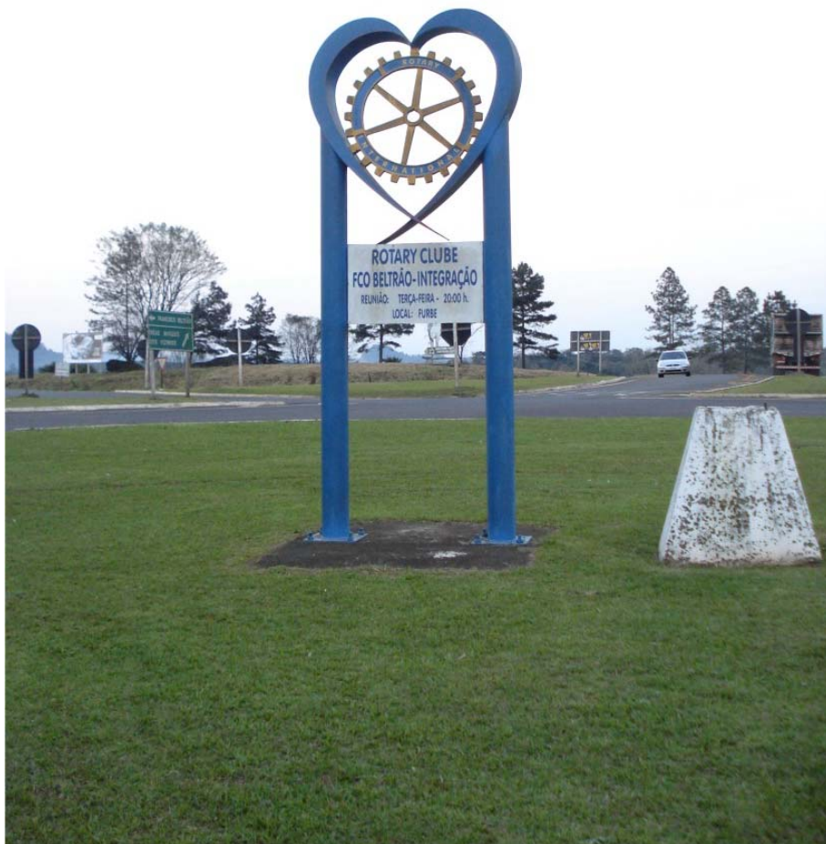
FOTO A.1.6 - MONUMENTOS SÍMBOLOS DOS CLUBES DE SERVIÇO - LIONS E ROTARY