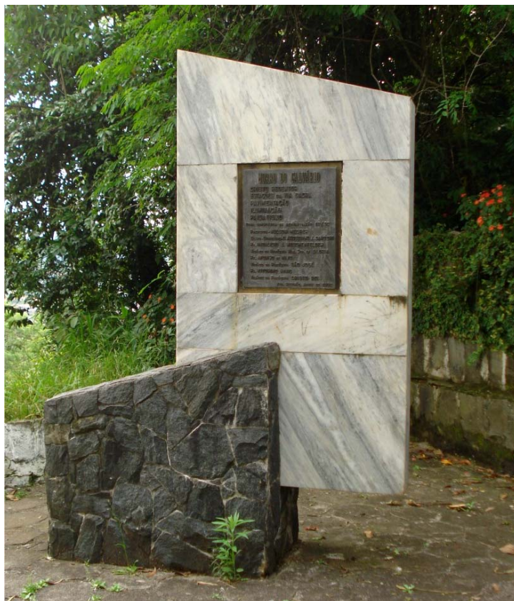
FOTO A.1.10 - MONUMENTO DO MORRO DO CALVÁRIO