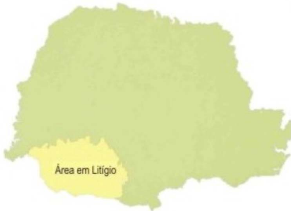
MAPA 1 - ÁREA EM LITÍGIO: GLEBA MISSÕES E CHOPIM

O processo histórico de ocupação das terras no sudoeste do Paraná, primeiramente, foi caracterizado pela população indígena e cabocla, voltada para a economia de subsistência, e posteriormente, pela chegada à região dos migrantes gaúchos e catarinenses que desenvolveram uma agricultura mais intensiva. Os primeiros moradores que adentraram nesta região do sudoeste paranaense, a partir de 1920, eram homens simples, desalojados do Rio Grande do Sul, foragidos da justiça do Paraná e de Santa Catarina e posseiros expulsos de terras da Brasil Railway Company , empresa envolvida na revolta do Contestado.