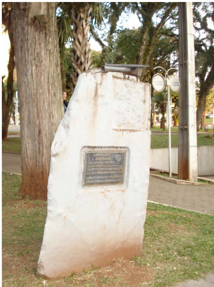
FOTO A.1.4 - PEDRA HOMENAGEM À MAÇONARIA