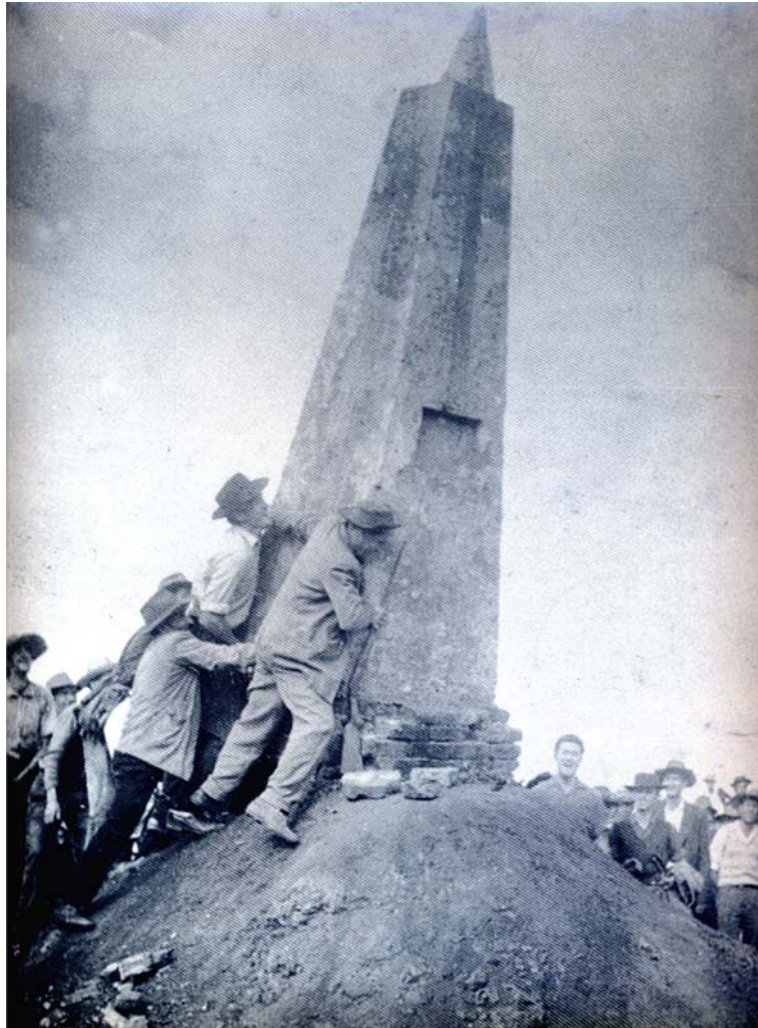
FOTO 1 - DERRUBADA DO OBELISCO, 10 OUT. 1957

Há monumentos que possuíam um significado no momento em que foram erigidos, mas com o passar do tempo, inverteram-se estes significados. A cultura da sociedade diferencia-se também, então o que era para ser uma homenagem passou a refletir uma mensagem de significado invertido para a sociedade daquele momento. Como exemplo, citamos o obelisco construído em homenagem a Júlio Assis Cavalheiro que foi destruído pelos posseiros após a expulsão dos jagunços e das companhias na Revolta de 57. Não há uma nitidez dos fatos para concluir o motivo que levou os posseiros a derrubar a estrutura. As imagens sugerem que possa ter sido uma forma de apagar da memória os fatos ocorridos na época.