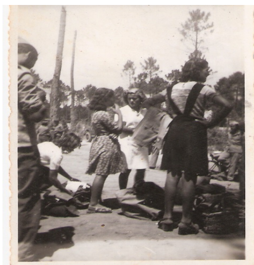
Foto 01: Presença de Mulheres italianas no depósito de pessoal da FEB 82 .

As relações que acabavam acontecendo, não tinham somente o cunho da exploração sexual. Muitos foram os militares brasileiros que acabaram, algum tempo depois, do fim da guerra, trazendo suas mulheres italianas para o Brasil. Porém, no caso do depósito de pessoal, acaba se tornando um centro de negociação. Por mais que não se pudesse consumir “os favores sexuais” dentro dessa organização militar de campanha, era ali que se marcavam os encontros e se estabeleciam os valores. Nesse local deslocavam-se mulheres de todas as idades, gerando um tipo de comércio não declarado, tendo como artifício para usar de “cortina de fumaça” e não deixar tão perceptíveis as evidências, a apanha de roupas sujas e entrega das limpas.