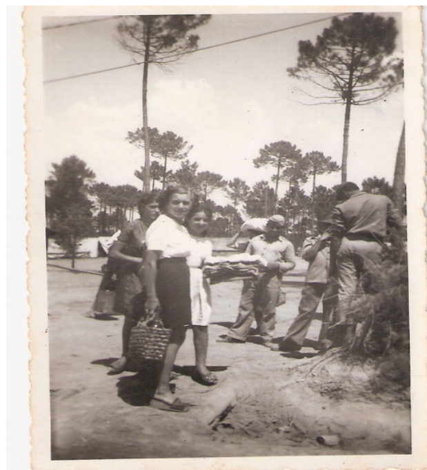
Foto 02: Mais um flagrante da presença das lavadeiras no depósito de pessoal. 83

A imagem acima contextualiza o depósito de pessoal. Esse cenário serviu, não somente como um lugar onde as lavadeiras pegavam as roupas sujas e deixavam roupas limpas. Oferecia como possibilidade, ainda, um ponto onde eram efetivados contatos e se marcavam os encontros. Encontros esses que iriam ocorrer nos arredores de onde estavam concentrados esses militares, porém não era permitido qualquer tipo de envolvimento dentro da unidade militar.