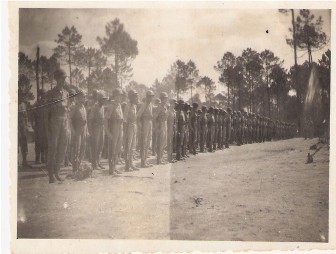
Foto 04: Flagrante de uma formatura no Depósito de Pessoal da FEB 85 .

A imagem acima possibilita a confirmação de umas das poucas atividades desenvolvidas por esse contingente, isto é, as formaturas e conferências dos efetivos, como abordado anteriormente. Esses militares aguardavam os resultados da frente de combate, pois tinham como objetivo completar os claros abertos, que poderiam ocorrer por morte, ferimentos ou ainda distúrbios daqueles que estavam combatendo os alemães nos Apeninos.