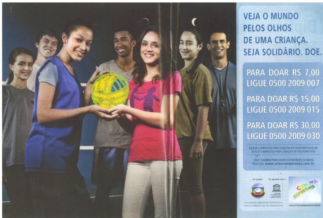
Figura 06: Anúncio Criança Esperança