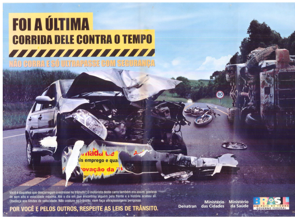
Figura 09: Anúncio DETRAN 2