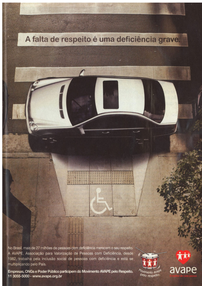
Figura 15: Anúncio AVAPE, pelo respeito aos direitos dos deficientes