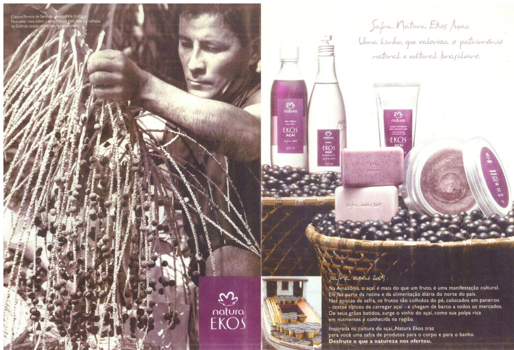
Figura 07: Anúncio empresa de cosméticos Natura