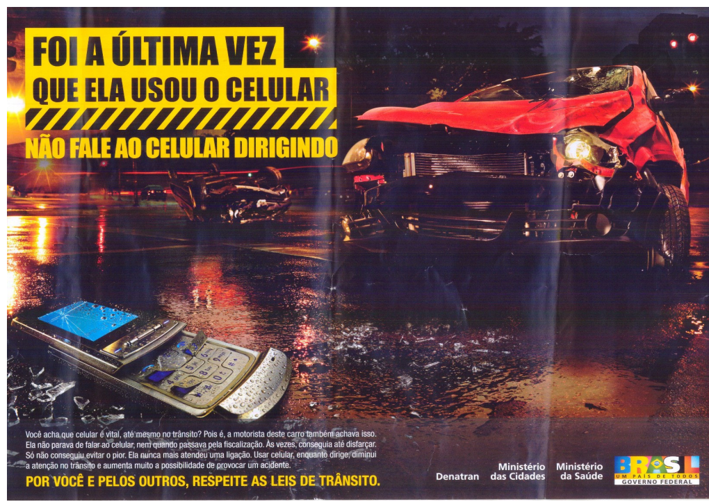
Figura 08: Anúncio DETRAN 1