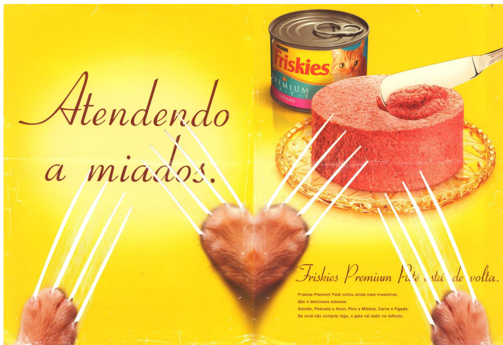
Figura 03: Anúncio ração para gatos Friskies