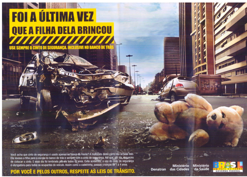
Figura 10: Anúncio DETRAN 3