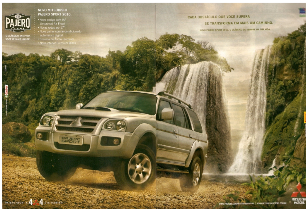
Figura 02: Anúncio Pajero Sport