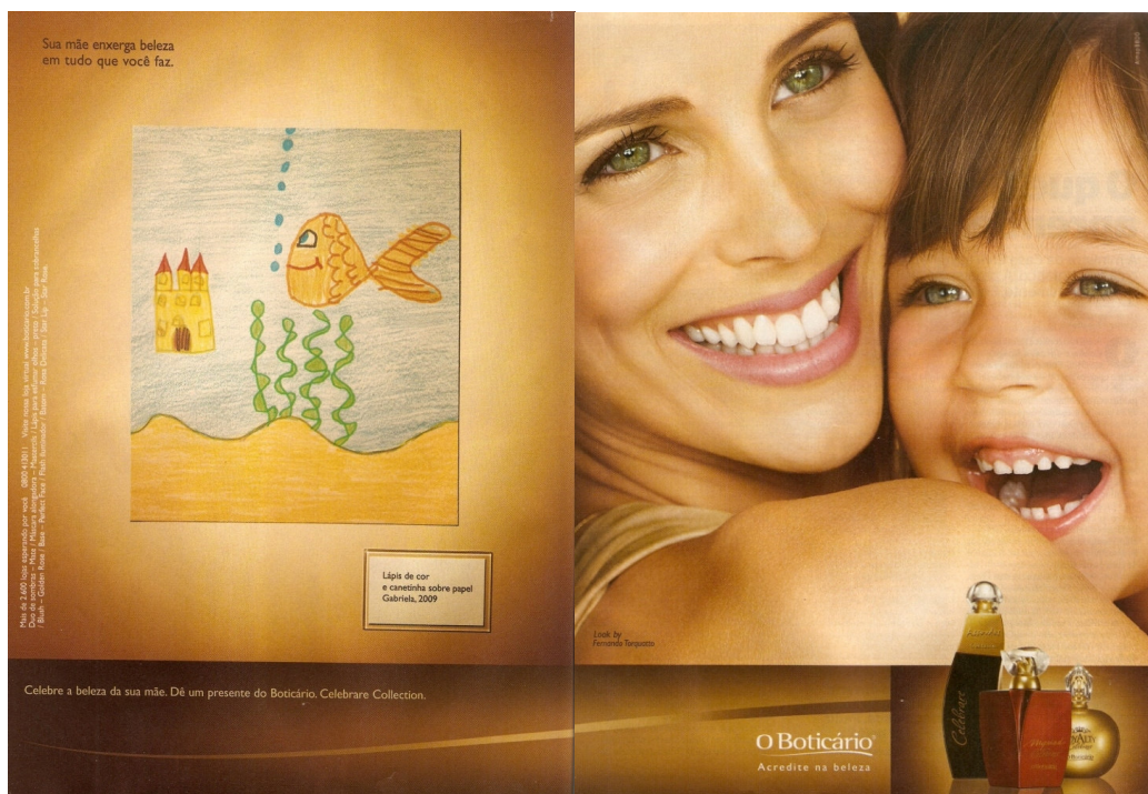
Figura 01: Anúncio O Boticário