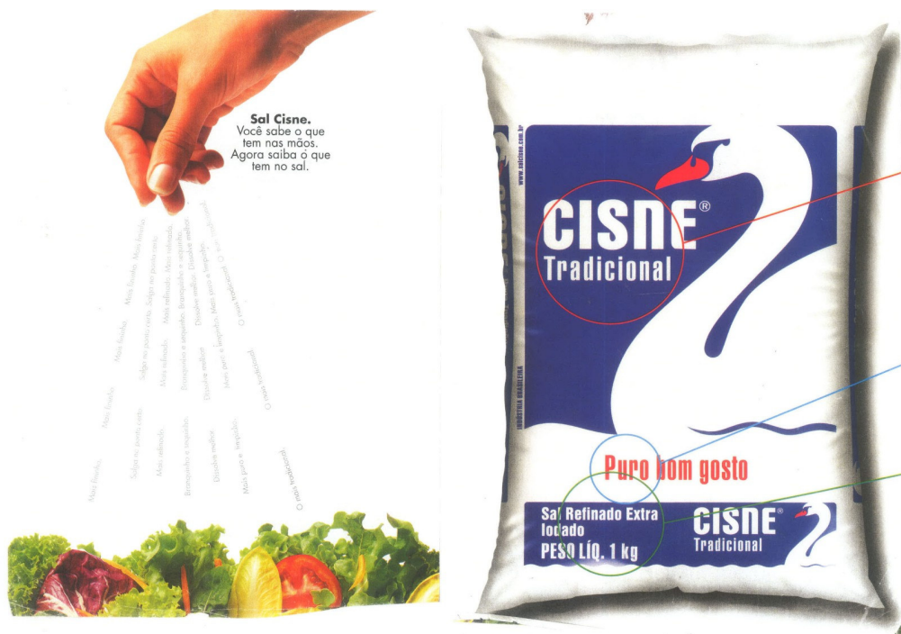
Figura 12: Anúncio Sal Cisne