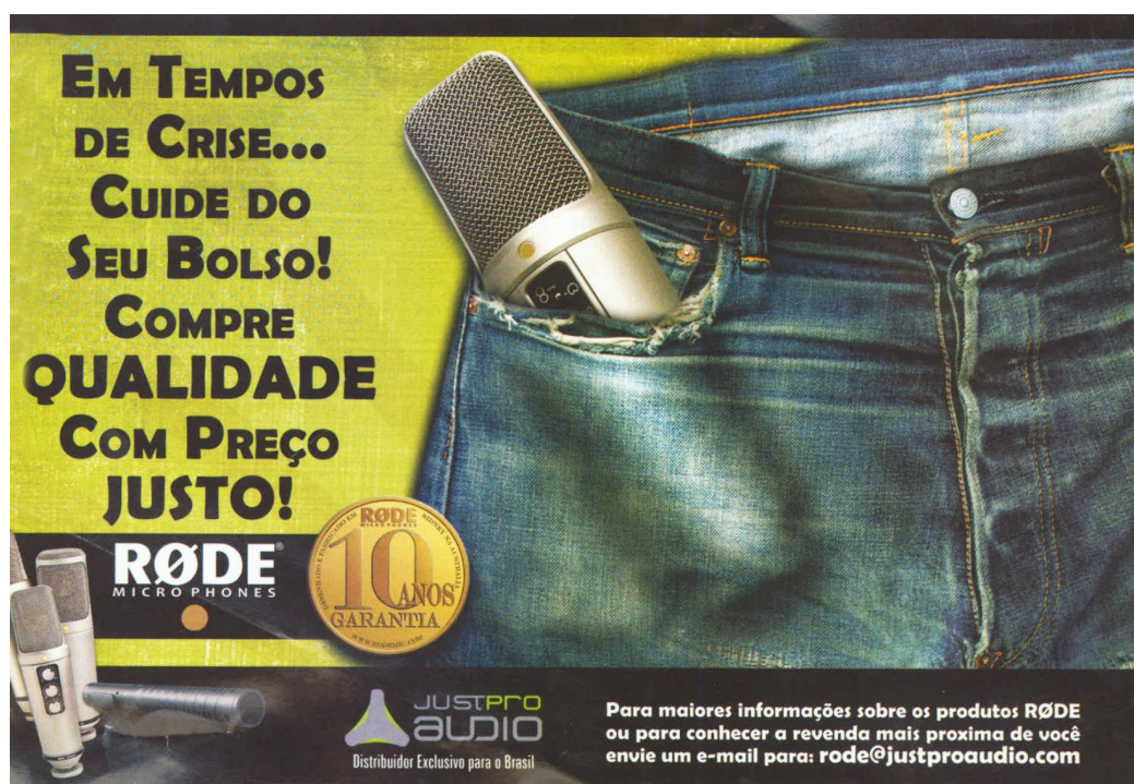
Figura 04: Anúncio microfone RODE