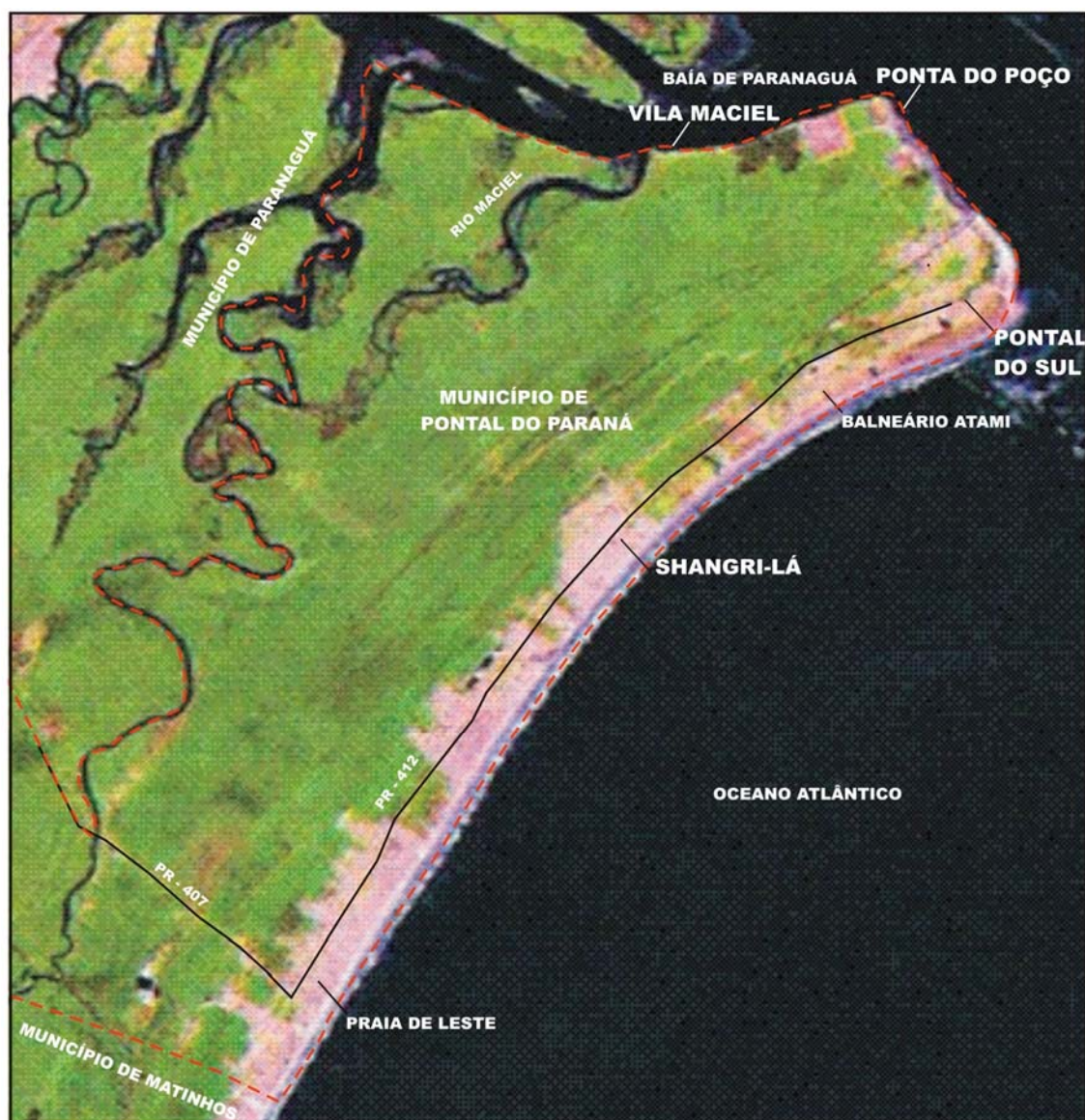
FIGURA 2 - LOCALIZAÇÃO DAS COMUNIDADES PESQUISADAS