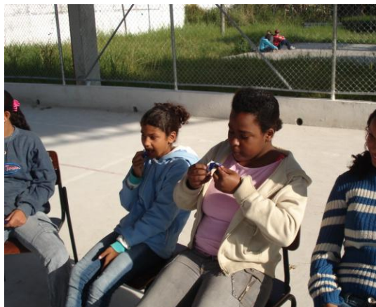
Figura 8 – Ambrosia.

A PP contou a história, porque estavam entusiasmados demais, o lugar (quadra) era aberto, por isso leu somente algumas partes que tinha marcado como a definição de quem era o rei, assim intercalou, leitura e contação. O S8 não se continha, queria contar que agora estava entendendo melhor o que tinha lido e que ele conseguiu entender aquele capítulo. Encerrado esse capítulo que foi mais contado que lido, devido à euforia dos sujeitos da pesquisa após experimentarem a ambrosia do século XXI, foram orientados para que lessem o capítulo VI em casa usando os recursos aprendidos para a interpretação e nas aulas seguintes poderiam discutir juntos o que entenderam. Terminado o capítulo, eles deveriam dividir-se em grupos de até 6 alunos, pois o livro Os doze trabalhos de Hércules do 7 ao 12 trabalho seria emprestado aos grupos. Os que quisessem deveriam ler o capítulo em casa, selecionar algumas partes para contar na sala de aula para os colegas, caso não entendessem algo poderiam pesquisar, consultar outras versões da mesma história como a que lhes foi entregue no início da sequência didática. Esta não era uma tarefa obrigatória, era somente para quem quisesse.