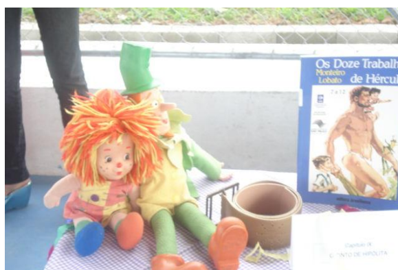
Figura 11 – Exposição dos capítulos.