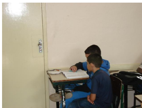
Figura 6. Alunos lendo.

Nesse capítulo há um trecho que fala sobre a ambrosia dos deuses; S2 interrompeu a leitura em voz alta para saber o que era ambrosia; releu-se o trecho e questionou-se: O que você acha que é?