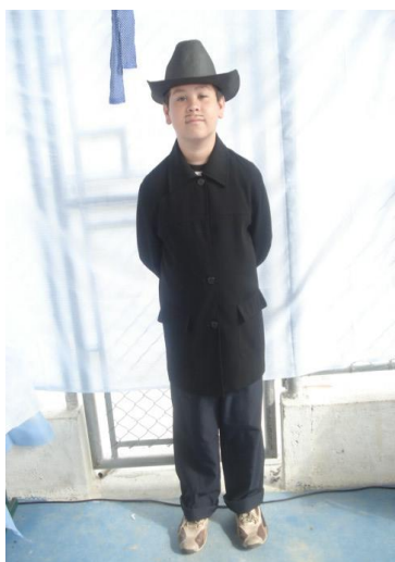
Figura 9 – Monteiro Lobato.

Após a entrada dos personagens e de seu posicionamento na linha do tempo, a narradora convidou os presentes para que visitassem as mesas e leu o nome dos doze trabalhos de Hércules. Os demais alunos ficaram nas mesas onde os trabalhos estavam expostos para contar aos visitantes cada um dos trabalhos realizados por Hércules.