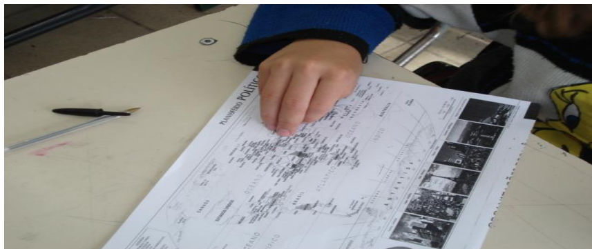
Figura 3. Entrega da cópia do mapa-múndi aos alunos.

Portuguesa. Visualizaram a Grécia, as ilhas, os países vizinhos, foram orientados que deveriam utilizar aquele material todas as vezes que precisassem localizar algo.