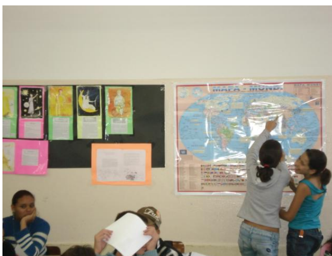
Figura 2. Painel com referências para auxiliar na interpretação da história.

os locais citados na narrativa; uma linha do tempo contendo os séculos, os anos correspondentes a eles; cópias coloridas e bem ilustradas de deuses e deusas gregas, juntamente com suas histórias. Todos os recursos interdisciplinares trouxeram informações e referências de naturezas diferentes; geografia, história, imagens e textos escritos como elementos de apoio a compreensão e a articulação dos saberes. Outro recurso utilizado foi o empréstimo de livros para atender a curiosidade dos sujeitos da pesquisa relacionados à narrativa ou a fatos narrados por ela; esta ação previa a compreensão do todo, tanto da localização do espaço onde se passava a história e do momento histórico onde se situavam os sujeitos da pesquisa, leitores obra.