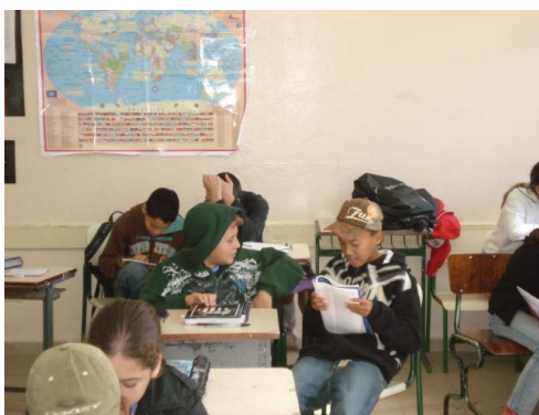
Figura 5. Alunos lendo.

S4 disse que tudo isso estava escrito no livro emprestado para eles, na página 70, em seguida leu o trecho que explicava para a turma.