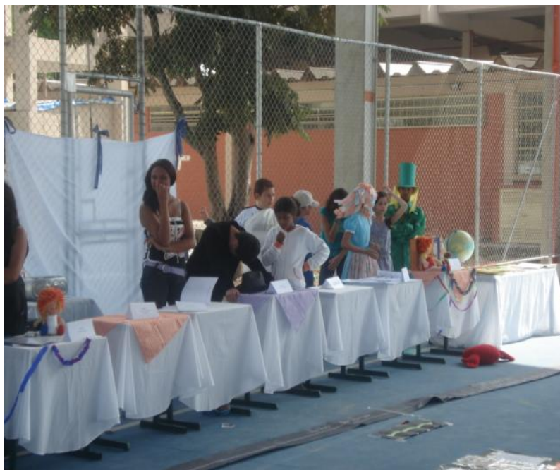
Figura 12 – Exposição dos capítulos.