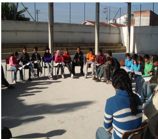
Figura 7 - Roda de leitura na quadra da escola.

transdisciplinar que, segundo Silva (2003, p.189), “abrigar, no seio da escola, a afetividade e a paixão significa conferir ao conhecimento um sentido existencial”.