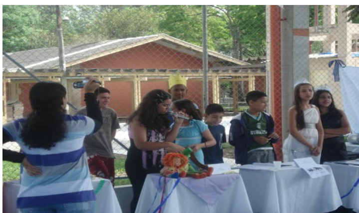
Figura 12- Narradora..