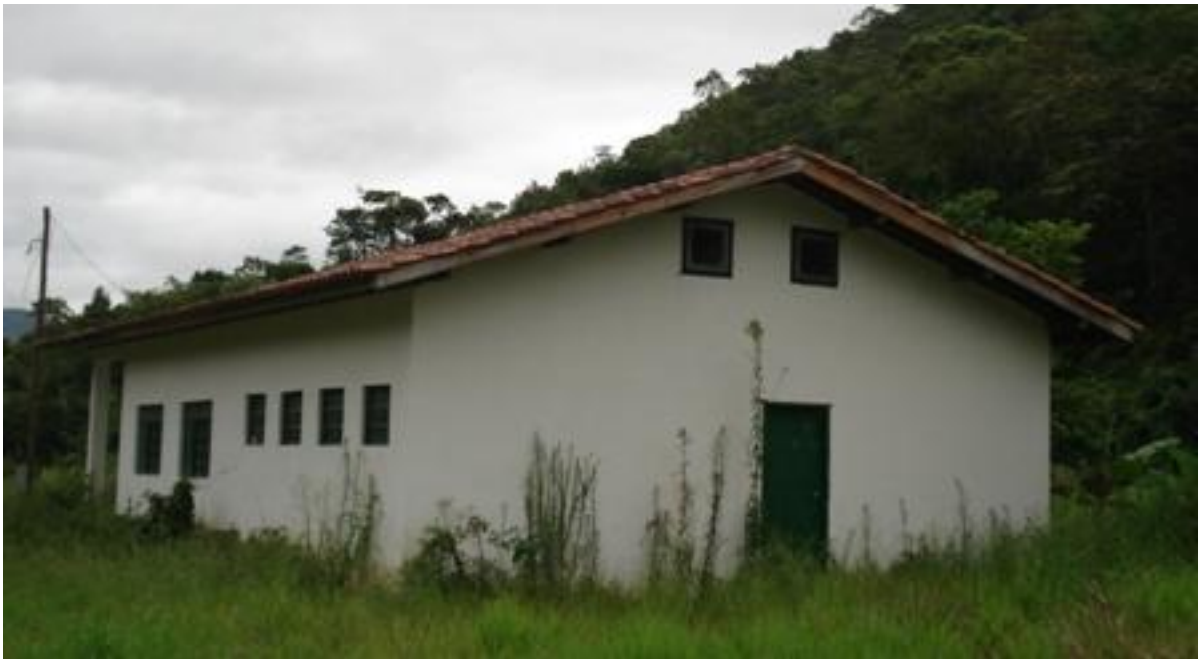
Edificação construída no âmbito do projeto, para processamento de plantas medicinais.