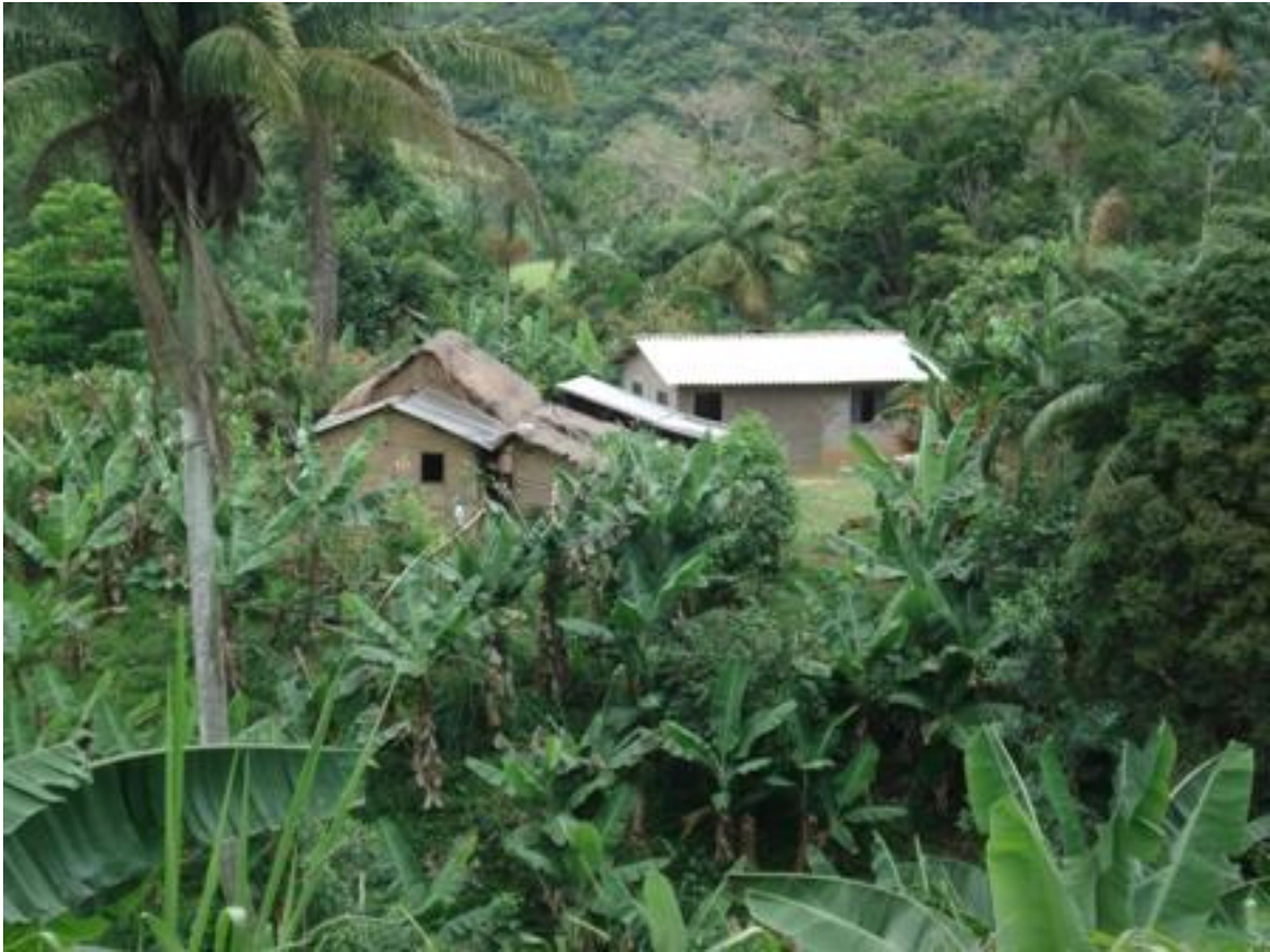
Bananal próximo à residência de uma família quilombola, na Cortesias.