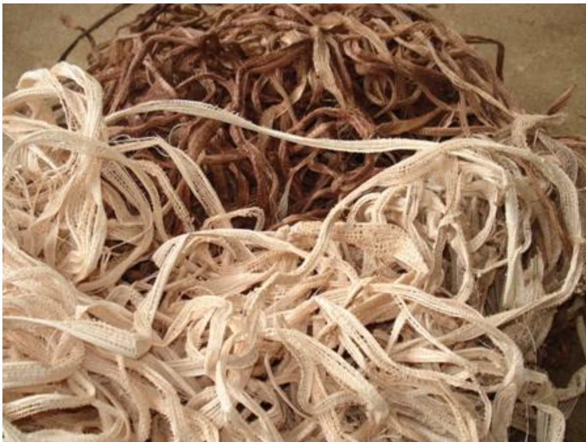
Palha da bananeira de diversos tons

Com vistas à retirada da massa de celulose, as tiras são raspadas, lavadas e penduradas em varais, ao sol, para secagem. O tratamento dado à palha, que objetiva ampliar seu tempo de duração, consiste em borrifar sobre ela um composto a base de óleo de eucalipto, canola e sabão de coco.