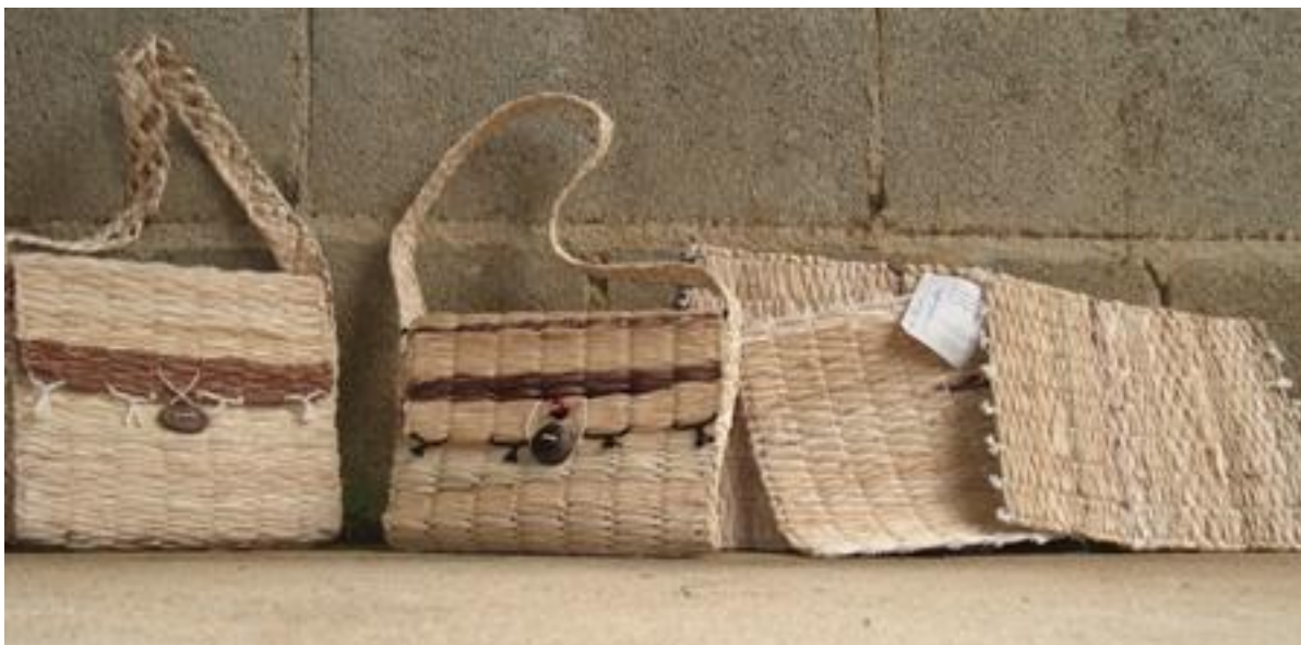
Bolsas e jogo de descanso de panela, em palha de bananeira