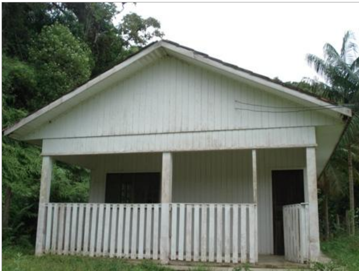
Casa do Artesanato, localizada entre a Vila e a localidade de Cortesias.