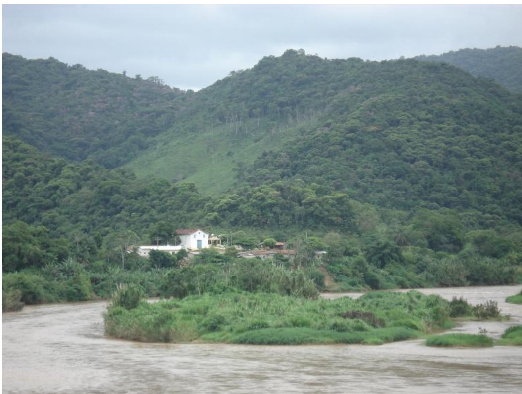
Igreja Nossa Senhora do Rosário dos Homens Pretos, incrustada na Mata Atlântica, localizada na Vila do Quilombo de Ivaporunduva, às margens do Rio Ribeira do Iguape