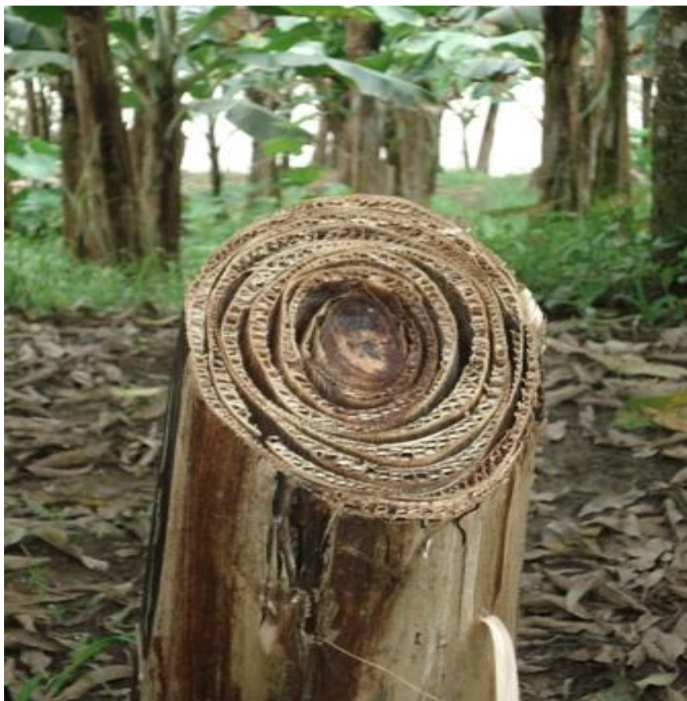
Pseudocaule cortado após aproveitamento dos frutos desta bananeira.

Mencionaremos brevemente o processo de confecção do artesanato com a palha de bananeira 120 . Para preparação da palha, corta-se o tronco da bananeira (pseudocaule), acerca de 50 cm do chão, que em seguida passa por um processo de limpeza.