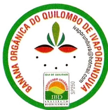
Logotipo da banana orgânica, que consta na produção comercializada.

produção. A certificação é o procedimento em que uma terceira parte – a certificadora – assegura as condições de produção daquele artigo, dentro de regras estabelecidas pela agricultura orgânica (Pedroso et al , 2007:27). No caso em questão, a certificadora é o Instituto Biodinâmico (IBD) e a Associação Quilombo de Ivaporunduva é a cessionária exclusiva, responsável pela qualidade orgânica dos produtos. Os produtores envolvidos na bananicultura orgânica assinam um termo de compromisso com a Associação. Há inspeções periódicas dos técnicos da certificadora nas unidades de produção (Pedroso, 2008:55). Atualmente há 38 produtores certificados. A área ocupada pela bananicultura orgânica corresponde a 56 hectares, 67% do total dos bananais, 2% do total do território quilombola (Pedroso, 2008:59-60).