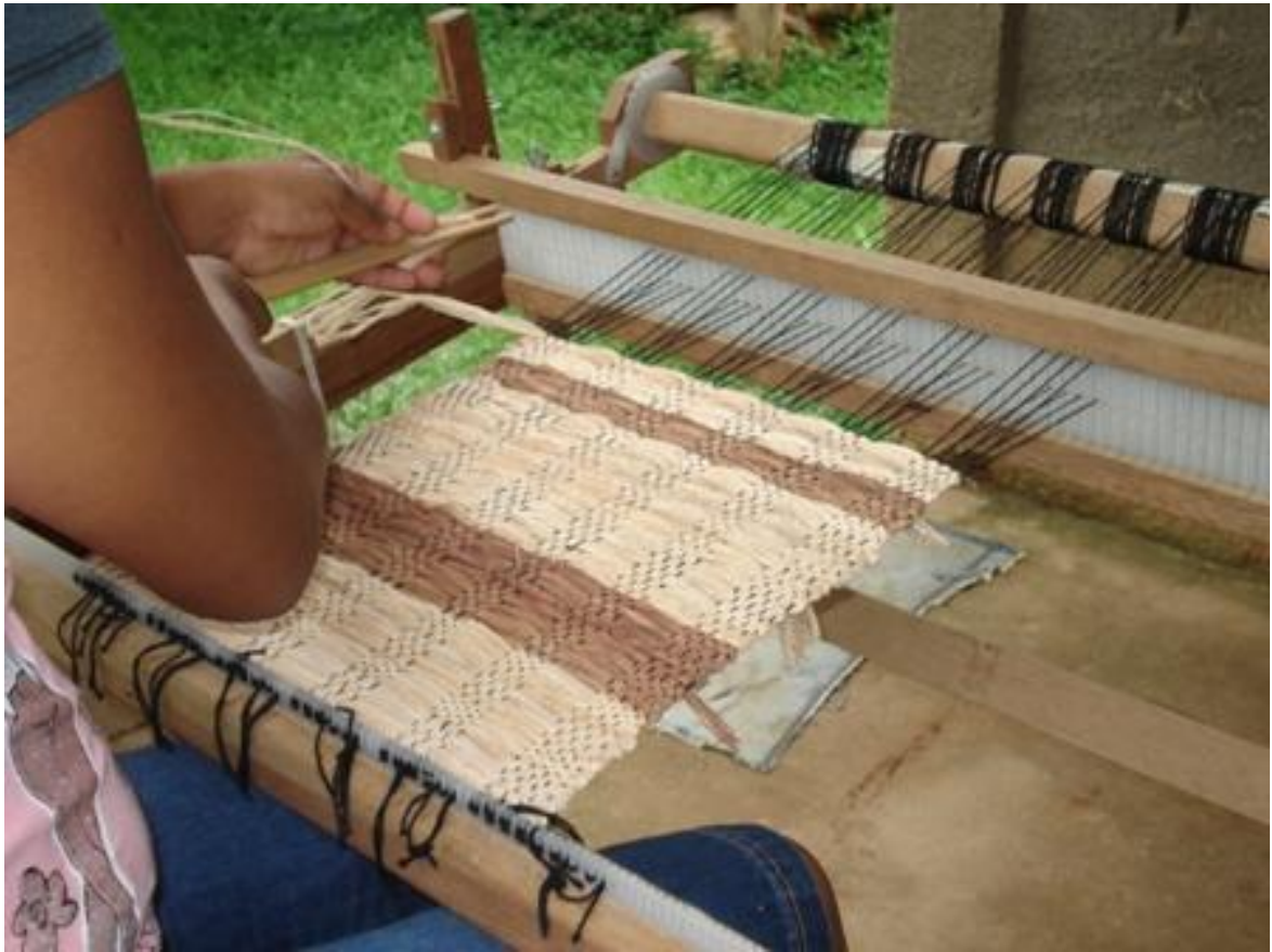
Artesã confeccionando caminho de mesa