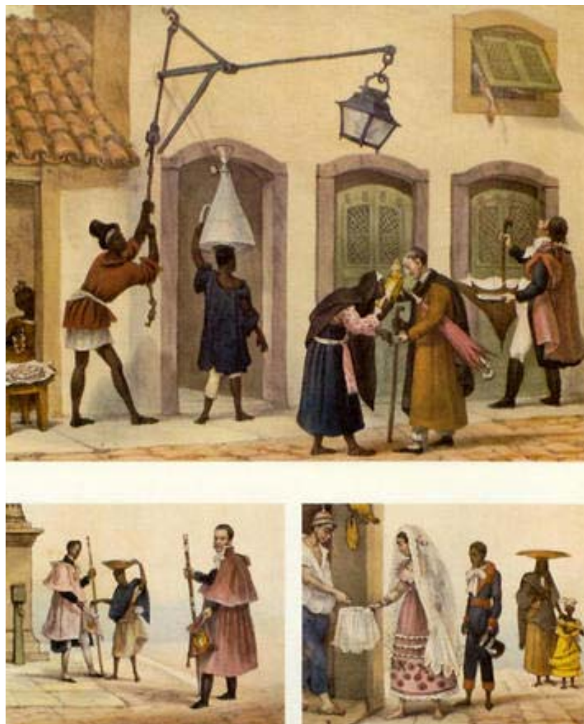
Figura 7. Coleta de esmolas para as irmandades. Irmãos pedintes. Debret. Tomo III.