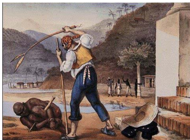
Figura 3. Feitores castigando negros. Debret. Tomo II.