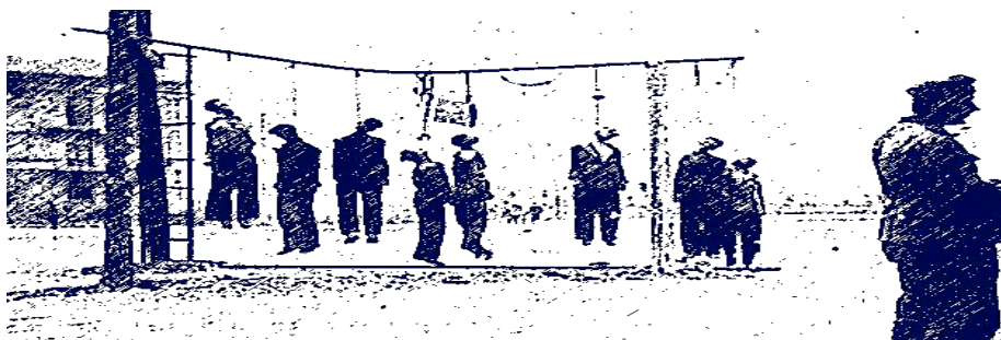
Figura modificada. Disponível em: < http://www.google.com.br/image ns>. Acesso em: 12 maio 2008.

Sinto no meu corpo A dor que angustia A lei ao meu redor A lei que eu não queria Estado violência Estado hipocrisia A lei que não é minha A lei que eu não queria Meu corpo não é meu [...].