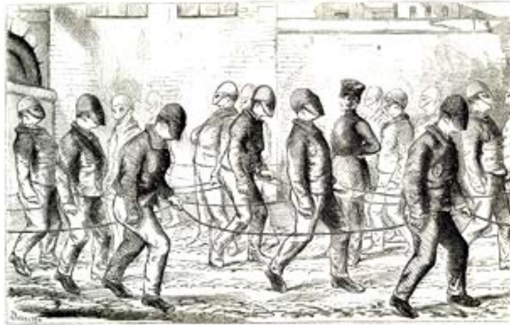
Figura modificada. Disponível em: < http://www.google.com.br/imgens >. Acesso em: 12 maio 2008, 16h42.