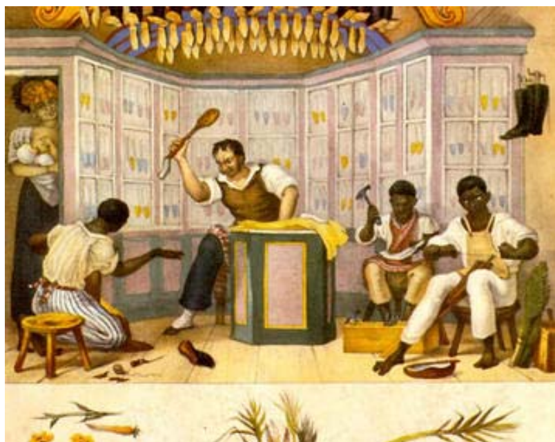
Figura 5. Sapataria. Debret. Tomo II.