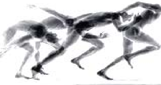
Figura modificada. Disponível em: http://www.google.com.br/imgens . Acesso em: 18 maio 2008, 14h20.

Um andarilho vai pela noite a passos largos; só curvo vale e longo desdém são seus encargos. A noite é linda – Mas ele avança e não se detém. Aonde vai seu caminho ainda? Nem sabe bem. (NIETZSCHE, 1999, p.457).