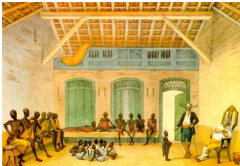
Figura 6. Mercado da Rua do Valongo. Debret. Tomo II.