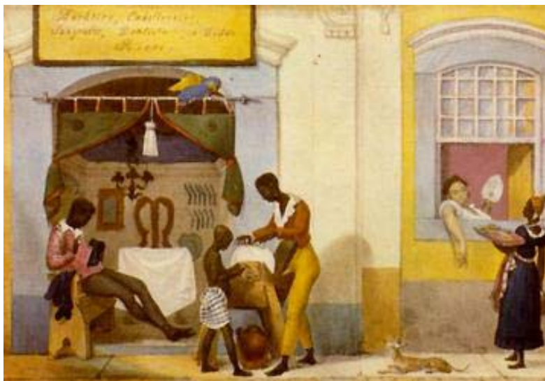
Figura 4. Indústria do trançado. Debret. Tomo II.

Essa situação gerou conflitos tanto entre senhores e Estado, como entre escravos e libertos. Eles disputavam a posse sobre a força de trabalho do escravo na conquista e glorificação de bens e recursos (Figuras 4 a 6).