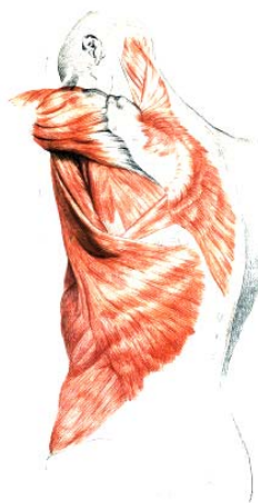
Figura modificada. Disponível em: http://www.google.com.br/imgens . Acesso em: 12 maio 2008, 16h30.

[...] de que algo existente, que de algum modo chegou a se realizar, é sempre reinterpretado para novos fins, requisitado de maneira nova [...] de que todo acontecimento do mundo orgânico é um subjugar e assenhorear-se, e todo subjugar e assenhorear-se é uma nova interpretação, um ajuste, no qual o ‘sentido’ e a ‘finalidade’ anteriores são necessariamente obscurecidos ou obliterados [...]. Logo, o ‘desenvolvimento’ de uma coisa, um uso, um órgão, é tudo menos o seu progressus em direção a uma meta. [...] Se a forma é ‘fluida’, o sentido é mais ainda... (NIETZSCHE, 1999, p. 12).