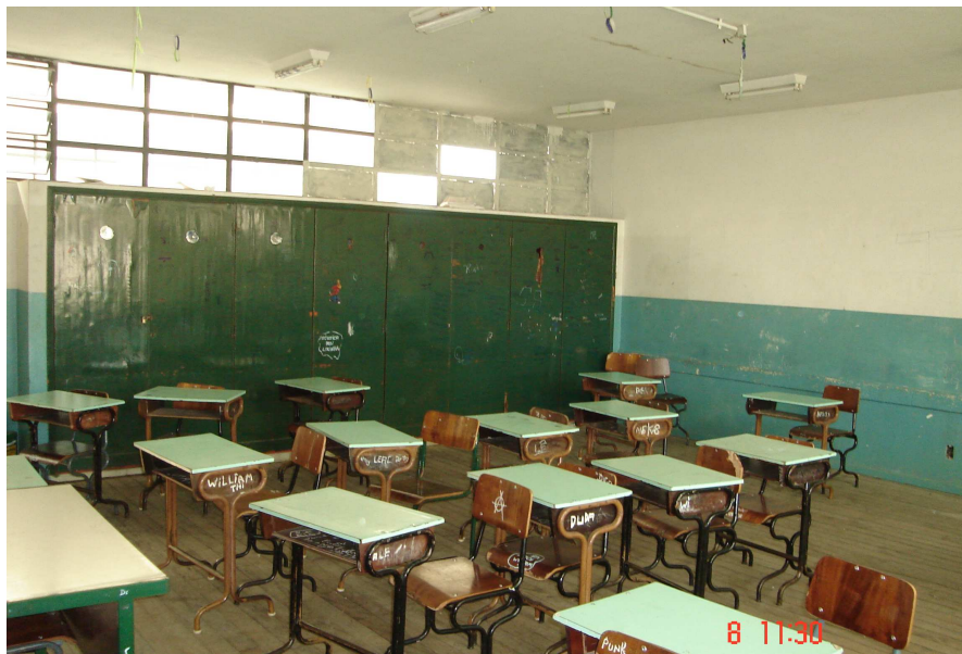
Figura 1 – Sala de aula

também para questões mais práticas como a reforma 3 do prédio da escola, conforme pode se ver nas fotos 4 abaixo.