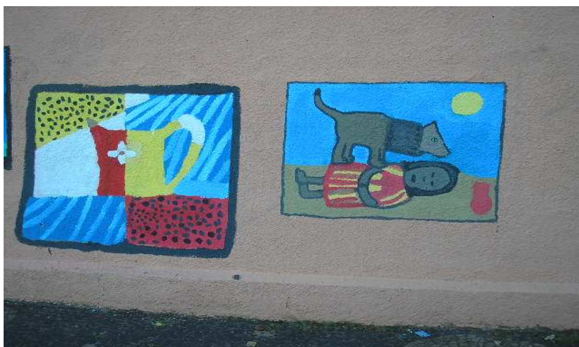
Figura 3 – Fotografia do trabalho realizado pelos alunos no muro da escola

Em relação ao projeto do muro da escola, uns dias antes das férias de julho, a Professora de Artes desenvolveu com os alunos e alunas um trabalho no muro da mesma que tinha como objetivo trabalhar valores atrelados a conservação do patrimônio, haja vista que a escola em 2006, conforme relatado anteriormente, encontrava-se com a sua pintura deteriorada. O muro da escola, que antes era todo pichado, estava agora coberto com algumas pinturas feitas pelos (as) alunos (as) da escola, não só o muro expunha a arte dos alunos, mas também o saguão de entrada do prédio trazia alguns quadros com suas pinturas. Seguem abaixo duas fotografias dos trabalhos realizados pelos alunos: