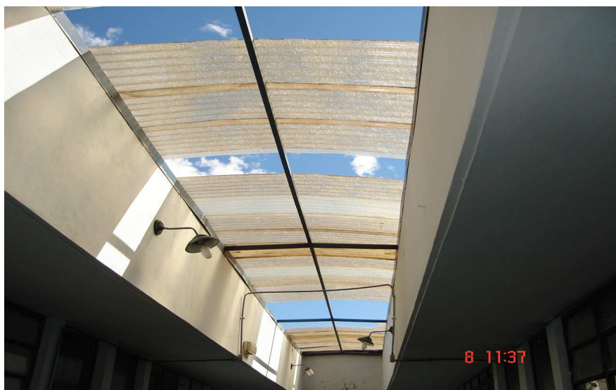
Figura 2 – Corredor da escola

Não se pretende discutir aqui o descuido ou a responsabilidade por tal situação em que a escola passou, mas ressaltar que tais dados assim como outros que foram demonstrados ao longo da pesquisa, só foram possíveis de coletar graças à abordagem metodológica (estudo de