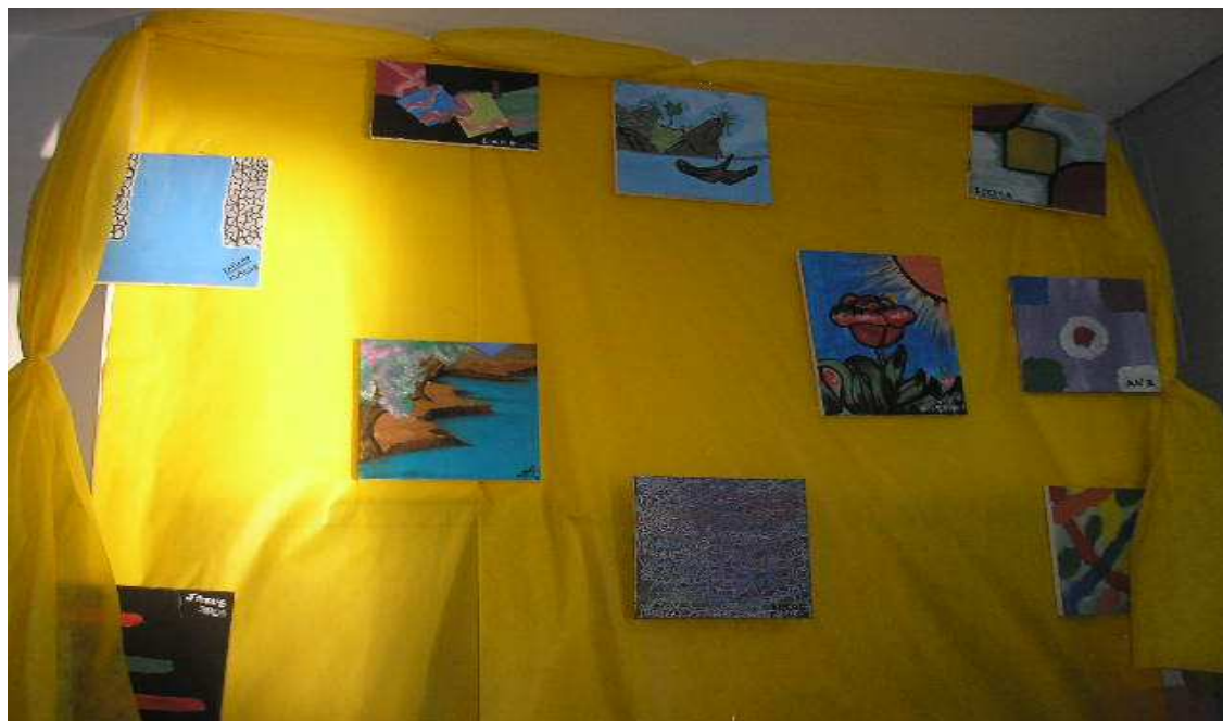
Figura 4 – Fotografia do trabalho realizado pelos alunos no saguão da escola

O que chamou a atenção é que, num primeiro momento, seria muito mais fácil e prático para a escola simplesmente mandar pintar o muro, no entanto, a escola optou por adotar uma medida mais bela, esteticamente, assim como mais educativa, ao tornar o muro uma grande tela e os seus (suas) alunos (as) em pequenos (as) pintores (as). Esta atitude da escola serve para demonstrar que o currículo oculto não é ruim por si só, já que esta atitude de convidar os alunos a pintarem o muro serviu para passar mensagens afetivas, tais como, conscientização em relação à conservação do patrimônio público, participação e trabalho em grupo.