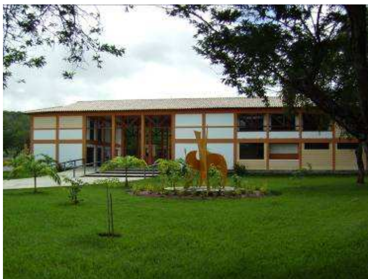
Figura 1 – Zoológico do Parque da Cidade Governador José Rollemberg Leite.

O presente estudo foi desenvolvido no Zoológico do Parque da Cidade Governador José Rollemberg Leite em Aracaju-SE (Figura 1). Este zoo foi inaugurado em 28 de maio de 1985 e atualmente possui em seu acervo cerca de 400 animais selvagens (répteis, aves e mamíferos) pertencentes a 46 espécies. Todos os animais selvagens são nativos da fauna brasileira, com exceção do casal de leões ( Panthera leo ). O Parque da Cidade está situado na zona norte de Aracaju, inserido na Área de Proteção Ambiental - APA Morro do Urubu, nas coordenadas 10°53'04 77''S / 37°03'23 32'' W (Figura 2), que é a única mata urbana da capital do Estado de Sergipe, constituindo-se numa mancha de Mata Atlântica.