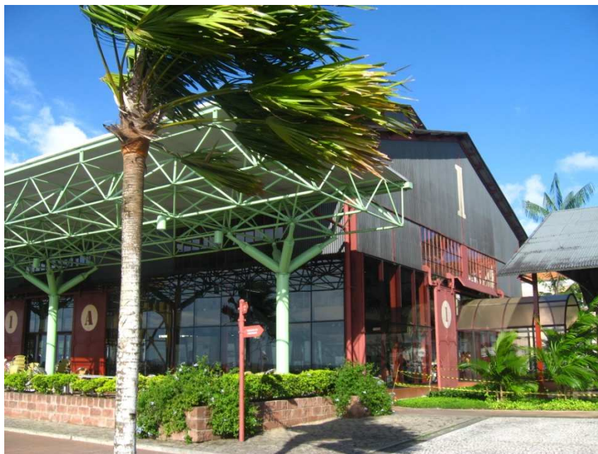
IMAGEM 3 VISÃO DO ARMAZÉM 01 DA ESTAÇÃO, COM SUAS PAREDES DE VIDRO. IMAGEM DA AUTORA

parcialmente a transparência e reflete a cena do Boulevard no seu jogo de luzes, formas e cores. (SECULT, 2000, p.03)