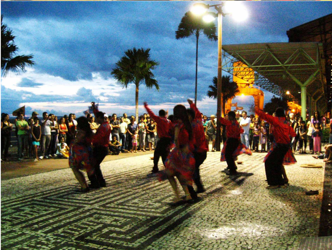
IMAGEM 8 PROJETO PÔR-DO-SOM SENDO APRESENTADO EM FRENTE AO TERMINAL FLUVIAL.