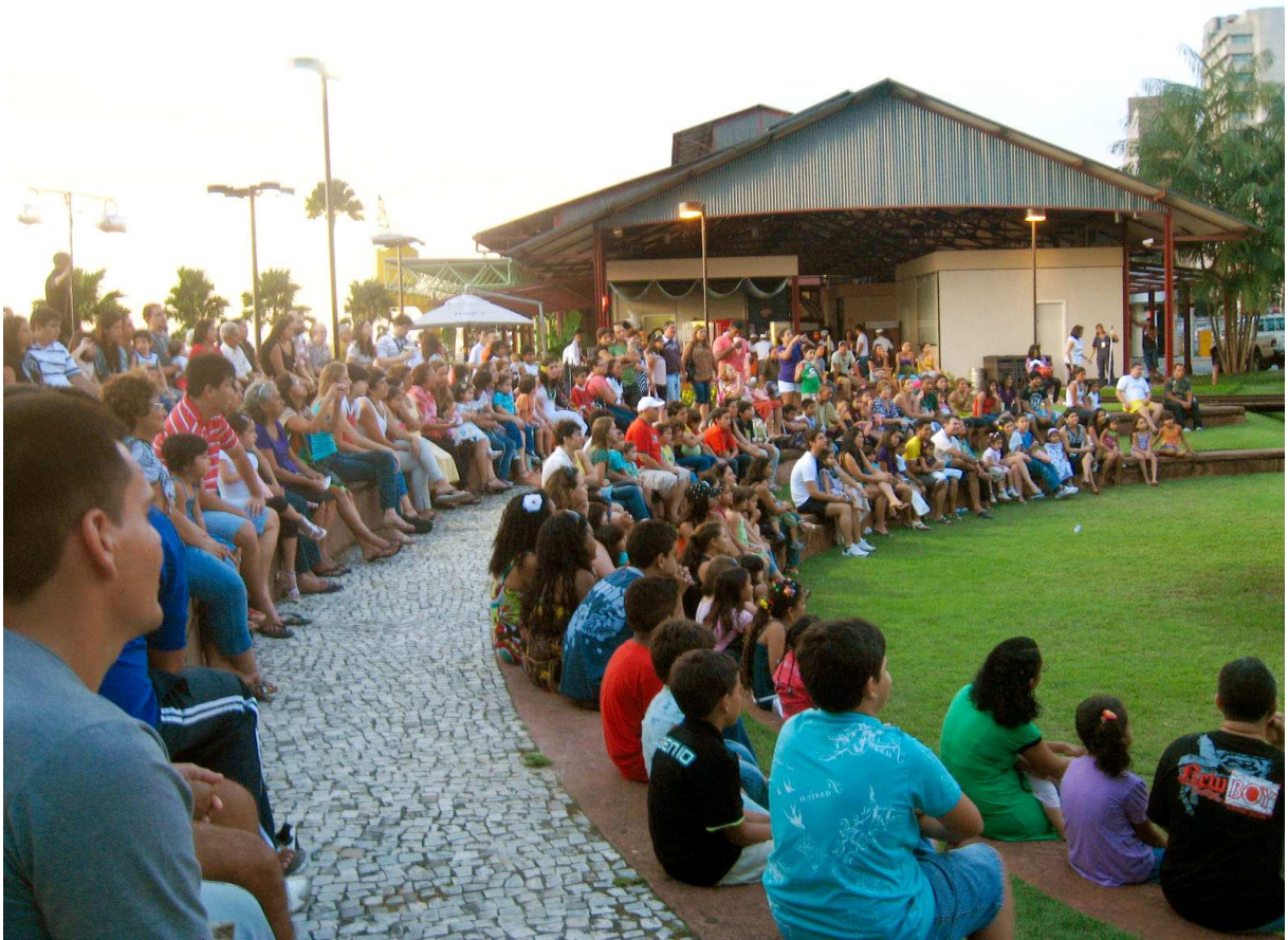
IMAGEM 11 PÚBLICOS DO TEATRO AO PÔR-DO-SOL . IMAGEM DA AUTORA