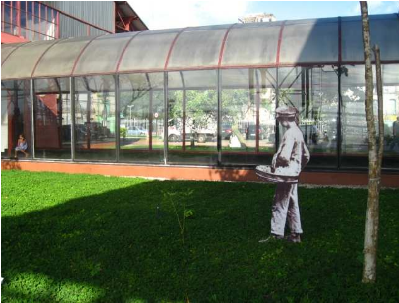
IMAGEM 6 UM DOS “HABITANTES DOS JARDINS” SAÍDOS DE CARTÕES POSTAIS DO SÉCULO XIX. NA IMAGEM O VENDEDOR DE JASMINIS.

Pode-se verificar na estética do projeto arquitetônico da ED uma mistura de elementos, da intenção lúdica (como nos “habitantes” vindos do passado), assim como a hibridização do novo/velho, características do que se classifica frequentemente como arquitetura pós-moderna, segundo Featherstone: