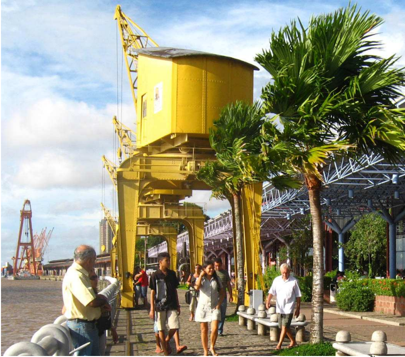
IMAGEM 4 OS GUINDASTES DE FABRICAÇÃO FRANCESA GARANTEM A ATMOSFERA PORTUÁRIA DO LOCAL.