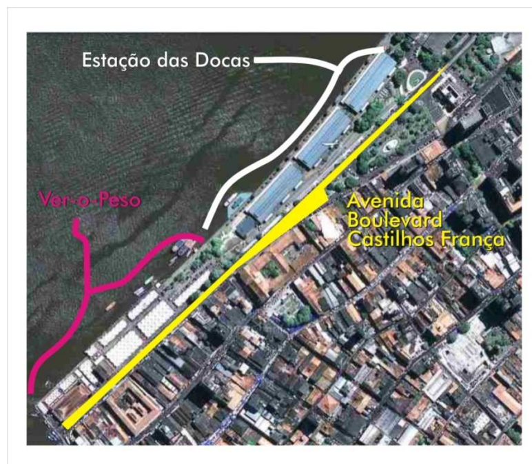
IMAGEM 1 VISTA ÁREA PARCIAL DO CONJUNTO ARQUITETÔNICO DO VER-O-PESO. IMAGEM DE SATÉLITE. ELABORAÇÃO DA AUTORA

A falta de integração entre as obras do Ver-o-Peso e da ED se torna ainda mais problemática, uma vez a ED faz parte conjunto arquitetônico e paisagístico do Ver-o-Peso, tombado pelo Iphan em 1977, que abrange também o conjunto de casas e prédios históricos situados ao longo da Boulevard Castilhos França. Na imagem abaixo temos uma visão parcial do conjunto arquitetônico do Ver-o-Peso, mas podemos ter uma ideia clara da proximidade entre este e a ED.