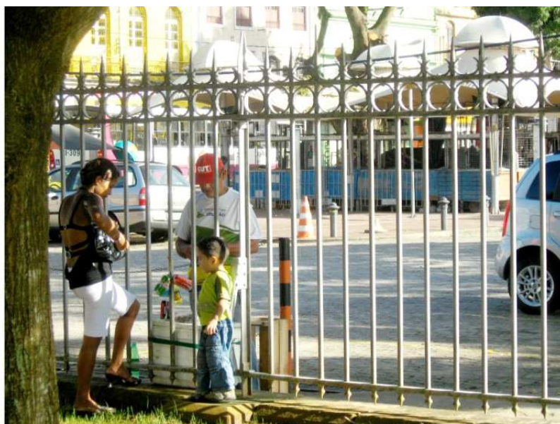
IMAGEM 9 VENDEDOR FICA NO VER-O-PESO E VENDE BEBIDAS PARA OS FREQUENTADORES DA ED.

aqui é uma área pública, todos podem entrar aqui. O que não pode é pedinte e vendedor ambulante, ai nesses casos nós temos que abordar porque não é permitido, porque tem lojas aqui dentro vendendo o que eles estão vendendo. (J. S, 2008)