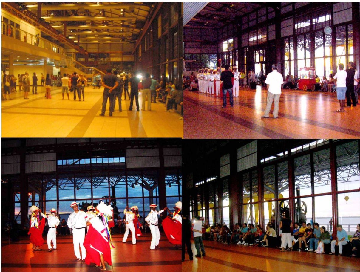
IMAGEM 7 PROJETO PÔR-DO- SOM SENDO APRESENTADO DENTRO DO GALPÃO 3.

de acesso. Na prática, isso não se dá de forma tão simples, são várias as dificuldades para que isso aconteça, desde a localização geográfica (dada à dificuldade de deslocamento físico nas grandes cidades), até a existência de padrões de consumo cultural diversos.