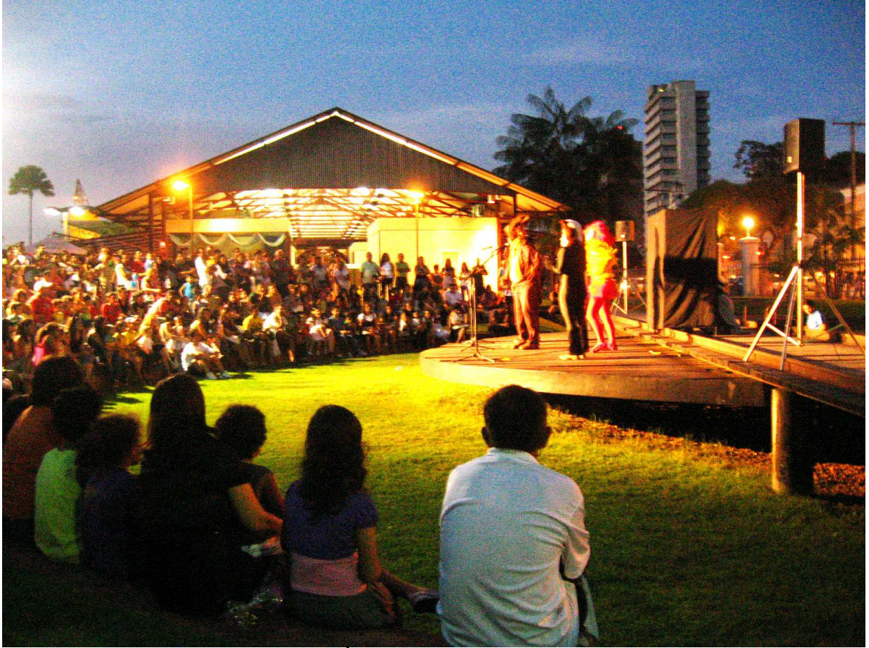
IMAGEM 10 PROJETO TEATRO AO PÔR-DO-SOL. IMAGEM DA AUTORA