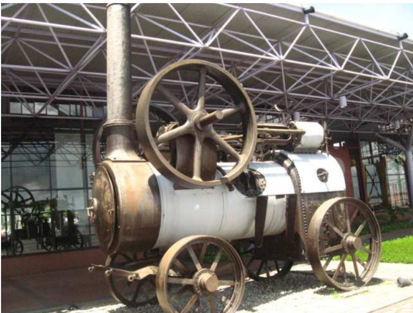
IMAGEM 5 A MÁQUINA À VAPOR GARANTIA ENERGIA PARA ATIVIDADES DO PORTO.