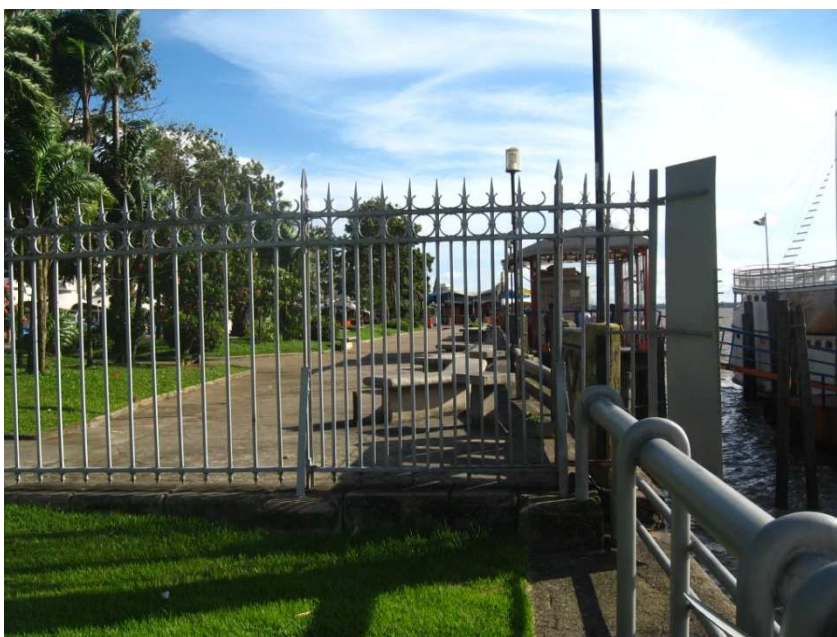
IMAGEM 2 A GRADE QUE SEPARA OS DOIS AMBIENTES. ANTES DA GRADE A ESTAÇÃO DAS DOCAS, DEPOIS DA GRADE O VER-O-PESO. ALÉM DA GRADE FOI INSTALADA UMA PLACA METÁLICA QUE IMPEDE QUE PESSOAS PULEM DE UM LADO PARA O OUTRO.

Segundo Amaral (2005) que desenvolveu um trabalho comparativo de tais intervenções no âmbito do planejamento urbano, além das diferenças estéticas na realização de tais projetos, uma das diferenças mais marcantes entre os projetos da prefeitura e do Estado se deu na forma como estes foram concebidos. Enquanto os projetos da prefeitura buscaram adequá-los às demandas da população através de consultas populares, os projetos do governo do Estado foram concebidos de forma vertical, ou seja, pensados dentro da Secult e apresentados a população já prontos sem ouvir suas demandas reais.