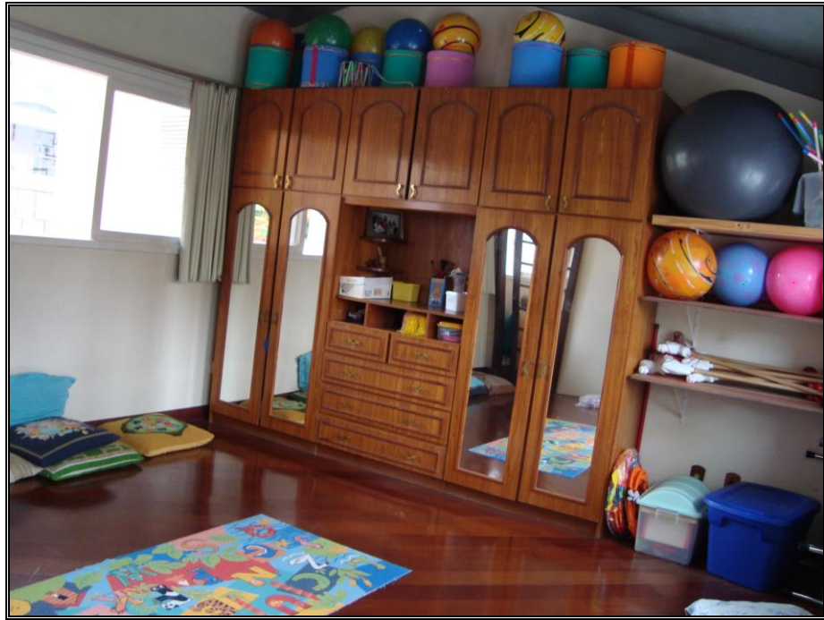
FOTO 5 – armário com materiais diversos (escola privada).