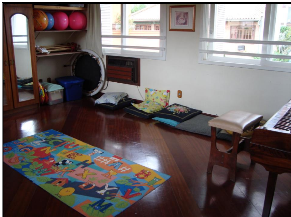
FOTO 6 – espaço da aula de música, almofadas e materiais diversos (escola privada).