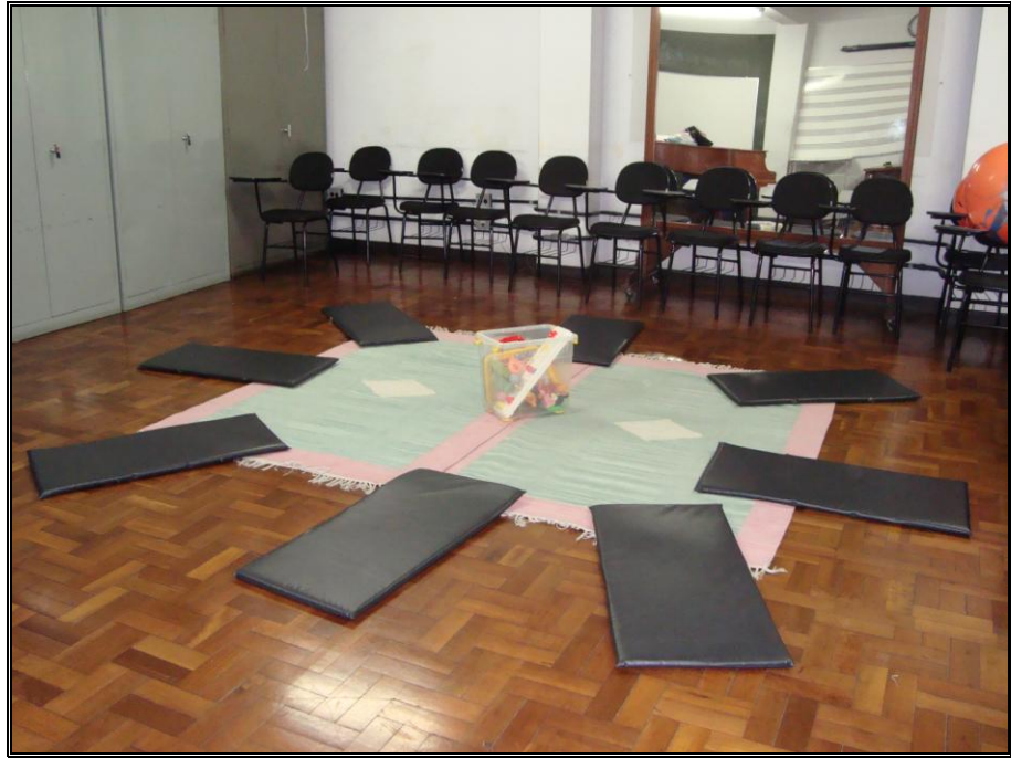
FOTO 1 – espaço da aula de música e armários para materiais diversos (escola pública).