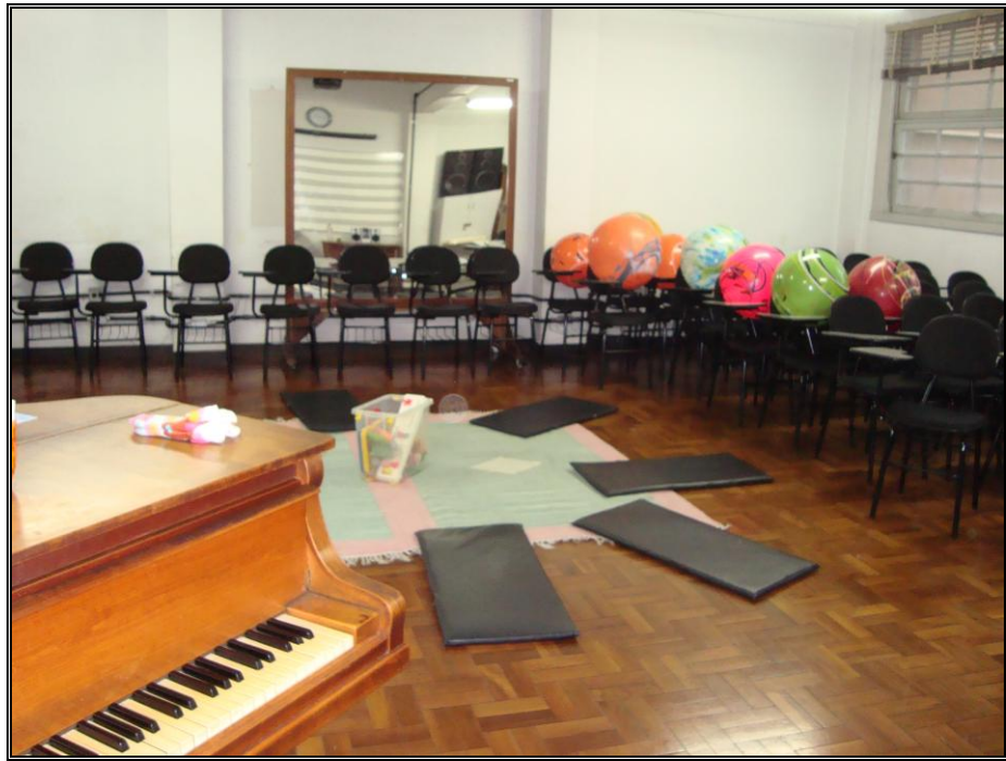
FOTO 3 – espaço da aula de música (escola pública).