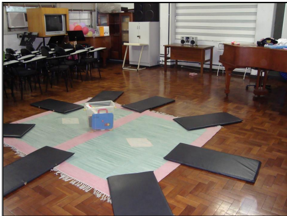
FOTO 2 – colchonetes, caixa de brinquedos, aparelho de som e piano (escola pública).