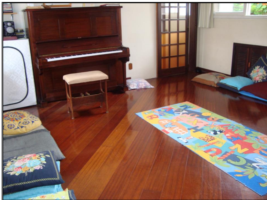
FOTO 4 – espaço da aula de música com aparelho de som e piano (escola privada).