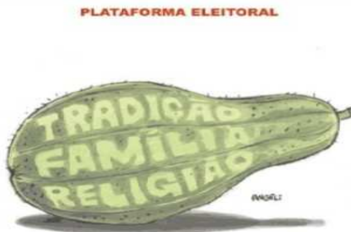
Charge 2. (Folha de São Paulo 20/06/06)

Quanto à charge 02 , Angeli usa a ironia, representada pela figura de um chuchu, popularmente caracterizado como “sem graça e sem gosto” para referir-se à imagem de Alckmin.