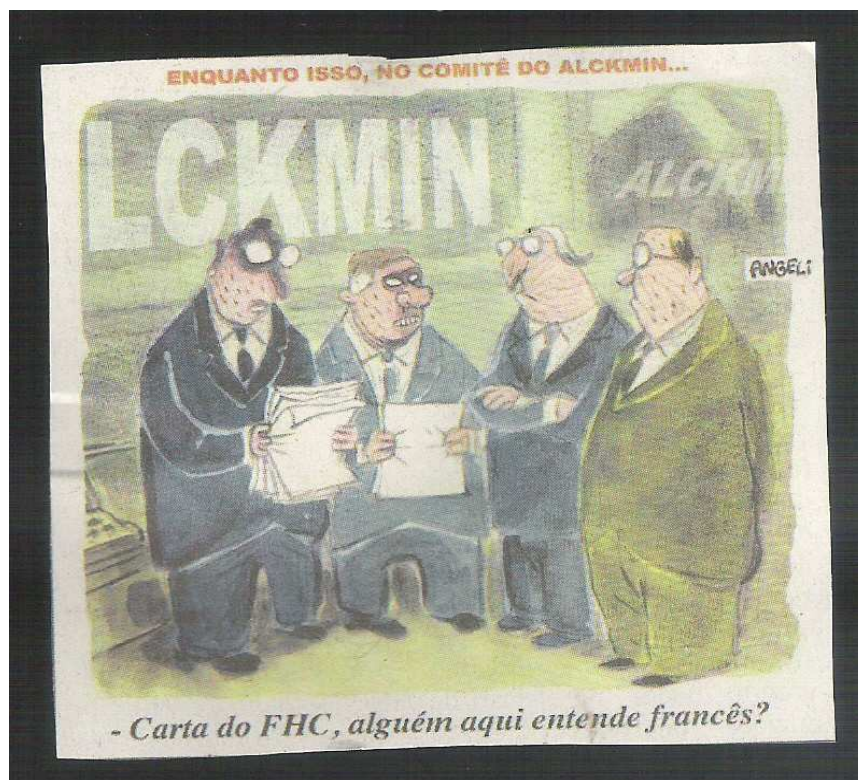
Charge 4. (Folha de São Paulo 05/07/06)

Nessa charge, Angeli faz primeiramente uma alusão ao ex-presidente da república Fernando Henrique Cardoso, no que diz respeito a sua capacidade intelectual, por isso o uso irônico do enunciado: Carta do FHC, alguém aqui entende francês? Para a sociedade, FHC foi um dos presidentes brasileiros que mais se destacaram pela sua influência e cultura; sua capacidade intelectual tornou-se sua marca registrada. O chargista “diverte-se” com a perplexidade dos assessores de Alckmin diante da carta, e o humor satírico da charge instala-se justamente nesse primeiro momento . O cartunista aguça o leitor a um segundo momento , a nova releitura. Ele usa uma “segunda voz”, uma voz polêmica e irônica internalizada na imagem erudita de Fernando Henrique Cardoso.