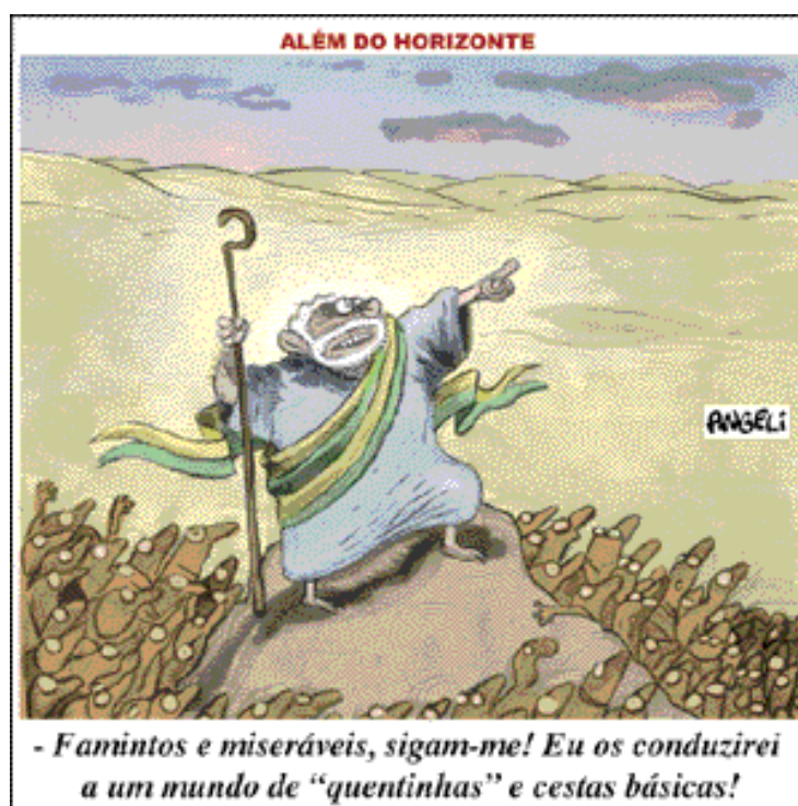
Charge 1. (Folha de São Paulo 16/06/06)

A charge 01 , que simula um diálogo entre Lula e o “povo brasileiro”, constitui-se na mescla dos discursos religioso e político de cunho militante, carnavalizados, representando uma inversão jocosa: