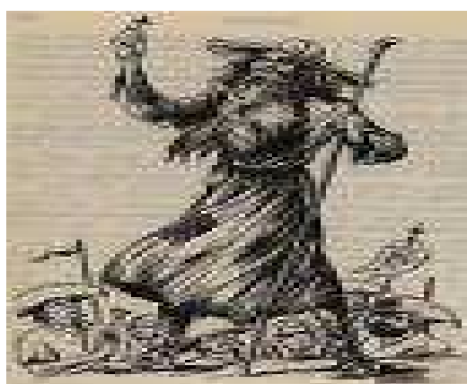
Fig. 03. Imagem de Antonio Conselheiro www.cce.ufsc.br/~nupill/literatura/cunha.gif

O texto não verbal também pode dialogar com a imagem de Antônio Conselheiro 14 , como se nota na figura 03 :