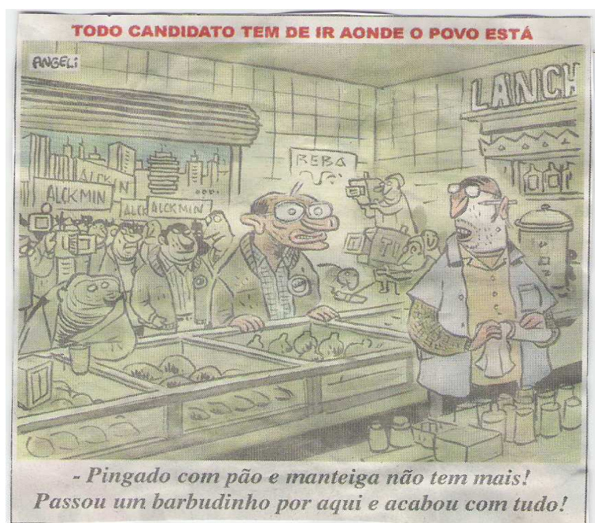
Charges 6. (Folha de São Paulo 27/07/06)

No enunciado “Pingado com pão e manteiga não tem mais passou um barbudinho por aqui e acabou com tudo”, revela à intenção irônica de Angeli, perante a imagem estereotipada de “povão” condicionada a Lula, este deixa implícita outra leitura para esta imagem: se acabou o “pingado e pão com manteiga”, é porque “alguém” comeu tudo, sem se importar com o restante. E essa ironia pode sugerir um Lula vulnerável aos problemas de corrupção e não tão “simplório e humilde” como quer parecer. Vejamos: