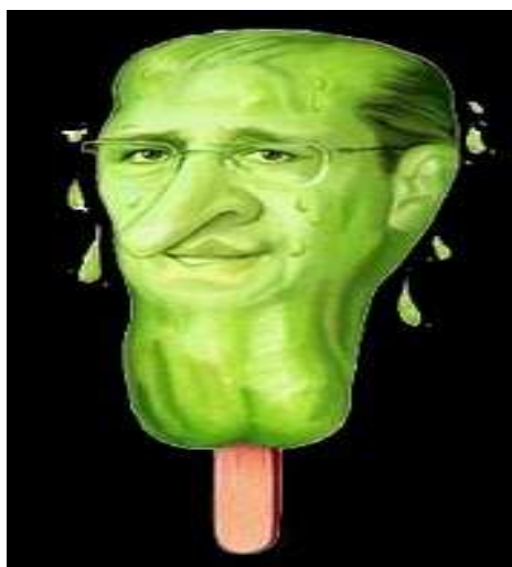
Fig. 06. Imagem (Alckmin) Picolé de chuchu 1.bp.blogspot.com/_wUSmd3QxQ7A/R-GDI60uEmI/AA..

O texto do chargista relaciona-se, pela intertextualidade, com a imagem criada pelo colunista José Simão, do jornal Folha de São Paulo , que vinculou a imagem de Alckmin a um "picolé de chuchu". Essa designação, segundo o próprio José Simão, denomina-se na política brasileira para indicar governantes que se destacam pelo pragmatismo, pela competência e pela falta de graça, conforme se nota na fig. 06 .