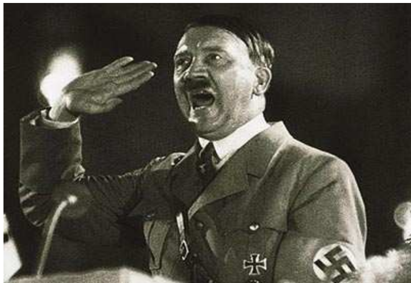
Fig. 08 24 . Retrato de Adolf Hitler www.profetico.com.br/.../2010/adolf-hitler.jpg

Angeli elege o paradoxo ideológico das figuras: “direita” (FHC - elite) versus “esquerda” (Lula – povo/Brasil), para dar sequencialidade à charge.