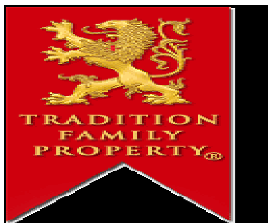
Fig. 07 23 . Imagem brasão da TFP http://www.rodrigovianna.com.br/files/Image/TFP-Standard.gif

O “slogan” Tradição, família e propriedade” (TFP), antigo, “ultrapassado”, tinha o objetivo de defender e estimular a tradição católica, a família monogâmica e indissolúvel e a propriedade privada. Esse discurso foi propagado e aclamado na década de 1960, por uma elite conservadora, intelectual e politizada da Igreja Católica. Seu fundador foi Plínio Corrêa de Oliveira, então jovem universitário que participava do Congresso da Mocidade Católica, que propunha uma sociedade alicerçada nesses mesmos princípios. Vejamos o brasão abaixo: