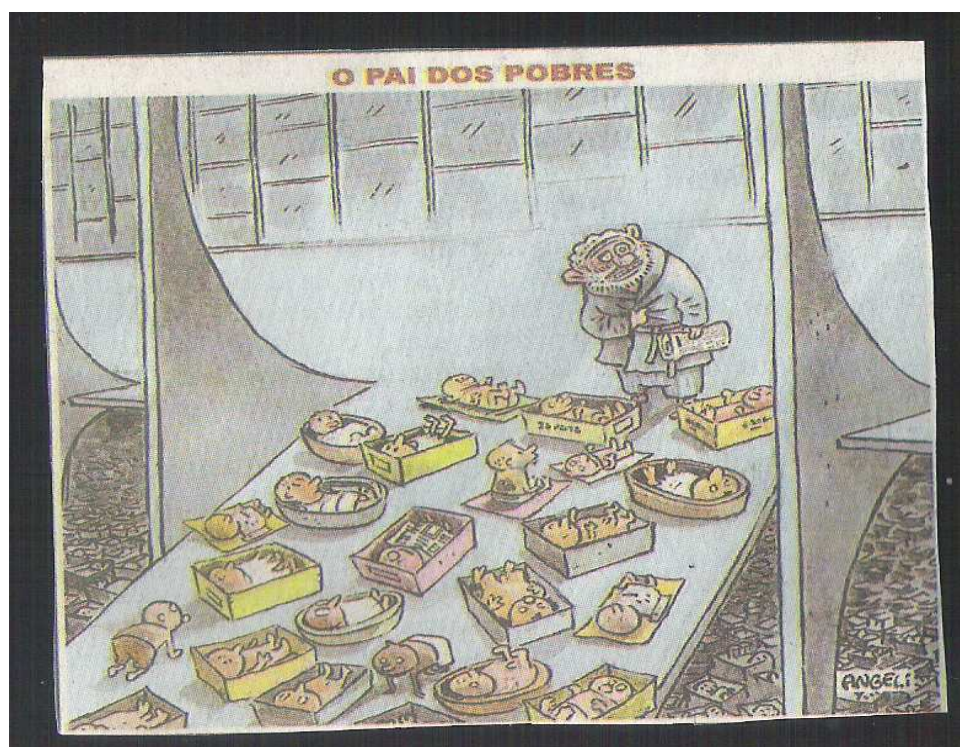
Charge. 05 (Folha de São Paulo 15/07/06)

O título da charge é uma referência intertextual ao governo de Getúlio Vargas, marcado pela sua popularidade, suas reformas e mudanças na base na plataforma governamental, com o objetivo do equilíbrio econômico entre as classes sociais. Com isso, fez surgir o salário mínimo e as Leis da CLT. Vargas, ao longo de sua primeira passagem pelo poder (1930-1945), mais precisamente durante o período do Estado Novo (1937-1945), implementou no país uma política de direitos sociais e trabalhistas. Além disso, ao longo do Estado Novo essas realizações foram sistematicamente divulgadas por um aparato de propaganda de massas que prestaram um verdadeiro "culto à personalidade" desse presidente.