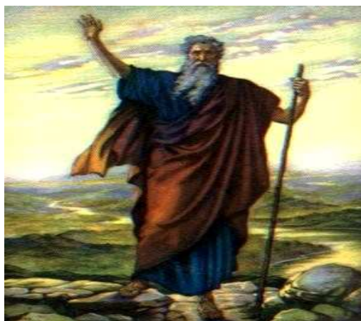
Fig .02. Imagem Moisés mark.files.wordpress.com/2009/10/Moises.jpg

“quentinhas” e “cestas básicas”, mas que não tem solidariedade para com o povo representado, a quem chama de miseráveis e famintos.