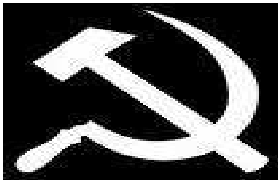
Fig. 05. Imagem Foice e Martelo

O Martelo simboliza os operários e a foice, os camponeses. Esse símbolo está estampado na bandeira da antiga URSS e produz a ideia de que o extinto Estado Soviético é construído sob aliança dos trabalhadores do mundo urbano com os trabalhadores do mundo rural. Daí dizer-se que a URSS era o Estado potencializado pela união dos operários com os camponeses. Esse instrumento de trabalho que se transformou em signo ganhou dimensão ideológica. A ideologia transitou por meio dos signos, remetendo ao posicionamento segundo o qual a bandeira da URSS representava um Estado, o Soviético, determinado pelos interesses dos trabalhadores: o símbolo da foice no cajado de Lula insinua o posicionamento do seu governo.